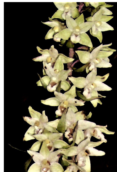
Abb. 2 bis 5: Dokumentation des Fundes von Epipactis purpurata am Westhang des Pfänders bei Bregenz

In der Schweiz kommt Epipactis purpurata im gesamten Mittelland nordöstlich des Neuenburger Sees bis zum Bodensee vor, mit einer Südostgrenze entsprechend der Linie von Luzern bis Arbon bei wenigen Ausreißern gegen (Süd)Osten (ARBEITSGEMEINSCHAFT EINHEIMISCHE ORCHIDEEN, AARGAU 2019). Diese Zone setzt sich jenseits des Bodensees