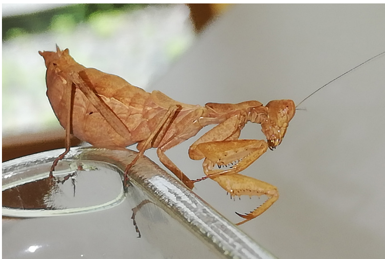
Abb. 13: Ameles spallanzania, Hohenems, 01.08.2019.