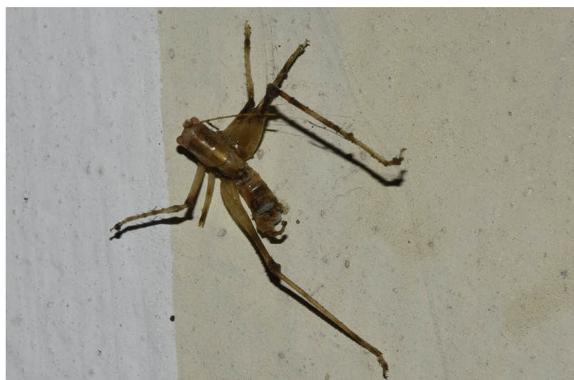
Abb. 4: Dieses Männchen von Meconema meridionale starb an einer Infektion von Entomophaga grylli agg., zeigt aber auch einen Befall durch andere Pilzarten; Hohenems, 26.11.2019.