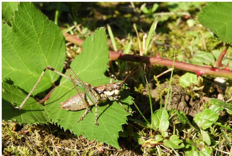
Abb. 6: Rhacocleis annulata, Rankweil, 08.09.2019.