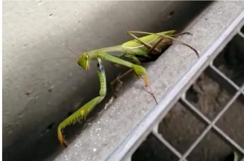
Abb. 11: Mantis religiosa, Sulz, 27.09.2019.