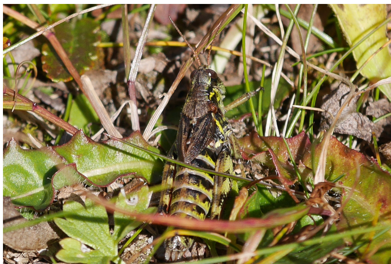
Abb. 9: Melanoplus frigidus, Raggal, 25.09.2016.