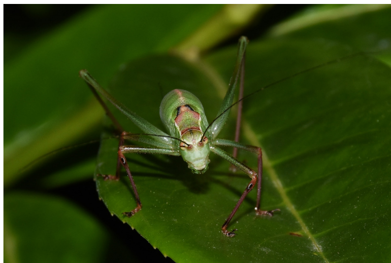
Abb. 1: Leptophyes punctatissima, Hohenems, 17.07.2017.