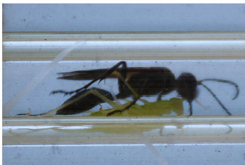
Abb. 2 und 3: Einflug von Isodontia mexicana mit einem Weibchen von Meconema meridionale sowie Transport innerhalb der Stegplatte, Dornbirn, 24.07.2019.