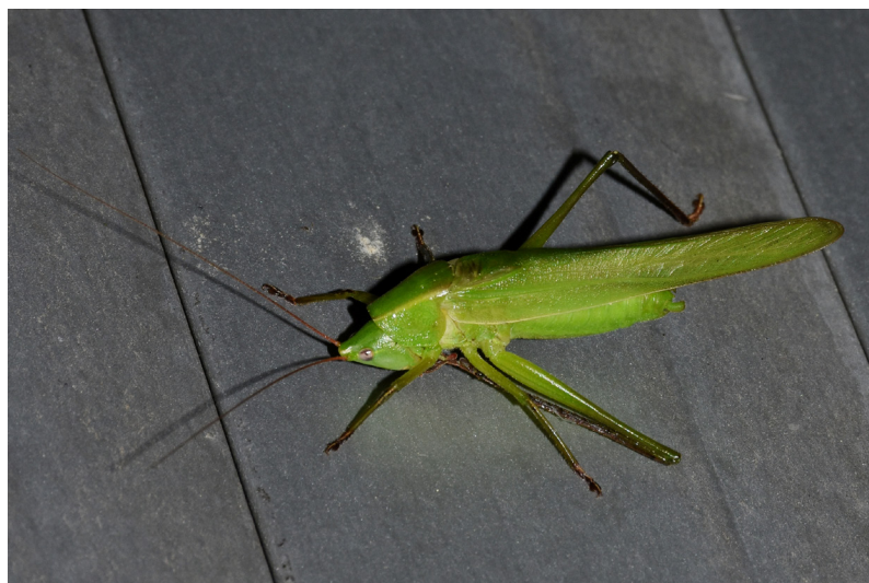
Abb. 5: Ruspolia nitidula, Hohenems, 05.08.2019.