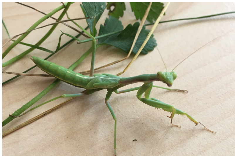
Abb. 12: Iris oratoria, Dornbirn, 16.10.2018.