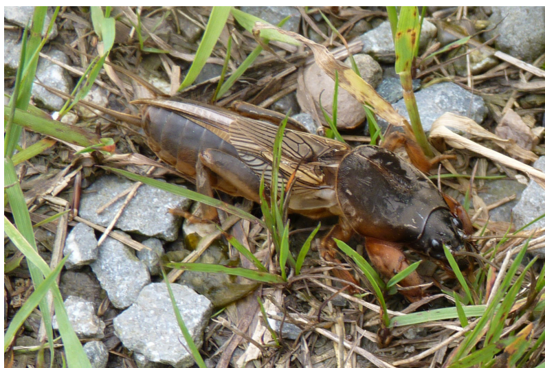
Abb. 7: Gryllotalpa gryllotalpa, Koblach, 11.06.2012.