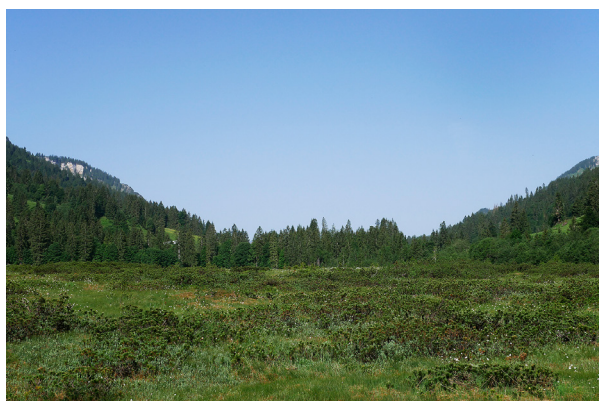
Abb. 2: Untersuchungsfläche Sumoos

Das auffälligste Merkmal der nur 5-15 g schweren und 6-8 cm großen Waldbirkenmaus ist der charakteristische schwarze Strich entlang der Rückenmitte (Abb. 1). Die Waldbirkenmaus besiedelt Gebiete vom Meeresniveau bis in 2.010 m Höhe. Sie ist dabei in verschiedenen Lebensraumtypen zu finden. Gemeinsam sind diesen eine hohe Feuchtigkeit und eine dichte Bodenvegetation, wobei sie offene Flächen dem geschlossenen Wald vorzieht. Dies gilt besonders während ihres Winterschlafes von Oktober bis April (PUCEK 1982). Das österreichische Hauptvorkommen der Waldbirkenmaus befindet sich in den Zentralalpen. Dort bevorzugt sie die mit Zwergstrauchheiden durchsetzten subalpinen Rasen und alpinen Matten sowie Moore im Bereich der oberen Waldgrenze (HABLE & SPITZENBERGER 1989; SPITZENBERGER 2001; RESCH & RESCH 2019, 2020). In Vorarlberg waren vor dieser Untersuchung ältere Vorkommen aus dem Bregenzerwald (vor dem Jahr 1979 in Schönenbach, Gemeinde Bezau) und in den Lechtaler Alpen (1971, Rand der Monzabonalpe, Gemeinde Lech) und der Elsenalpe in der Gemeinde Damüls im Jahr 1995 bekannt (HABLE & SPITZENBERGER 1989; Abfrage Biodiversitätsdatenbank der inatura Juni 2019).