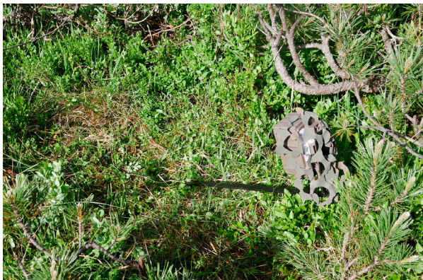
Abb. 6: Wildtierkamera zur Untersuchung von Kleinsäugetieren im Sumoos

& MØLLER 2018; STILLE et al. 2018; RESCH & RESCH 2019). In der vorliegenden Untersuchung kamen insgesamt zwölf zur Erfassung von Kleinsäugetieren adaptierte Geräte (Fokusanpassung, Haltevorrichtung aus Metall) des Herstellers Cuddeback (Non Typical Inc., USA) zum Einsatz. In insgesamt zwölf Kontrollen in regelmäßigen Abständen erfolgten die Nachbeköderung mit lebenden Mehlkäferlarven, der