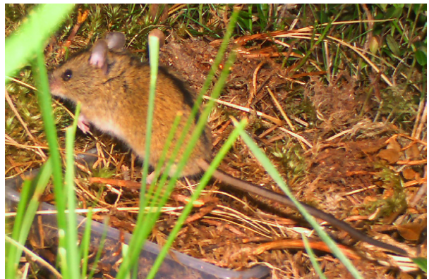
Abb. 7: WTK-Aufnahme der Waldbirkenmaus in Krüz