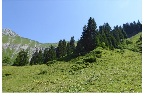
Abb. 5: Untersuchungsfläche Sulzried Alpe