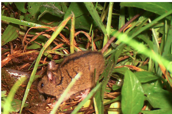
Abb. 8: WTK-Aufnahme der Waldbirkenmaus auf der Bellishegg Alpe