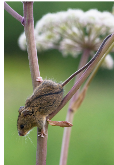
Abb. 1: Waldbirkenmaus ( Sicista betulina )

In Österreich gibt es aktuell nur wenige bekannte Vorkommen der streng geschützten Waldbirkenmaus ( Sicista betulina ) (SPITZENBERGER 2001; STÜBER et al. 2014; RESCH & BLATT 2017; RESCH & RESCH 2019, 2020; PLASS et al. 2021) und auch in der Roten Liste Vorarlbergs gilt der seltene Kleinsäuger als gefährdet (SPITZENBERGER 2006). Die Vorkommen im Bregenzerwald stellen zudem die Westgrenze ihrer europäischen Verbreitung dar und sind daher als bedeutsam einzustufen. Speziell zur Erfassung von Birkenmäusen umgebaute Wildtierkameras (WTKs) ermöglichen seit Kurzem eine einfache und, im Vergleich mit herkömmlichen Lebendfängen, kostengünstige Kartierung (RESCH & RESCH 2019). In dem vorliegenden Projekt wurden mit dieser neuen Methode etwaige Vorkommen auf ausgewählten Flächen in Vorarlberg untersucht.