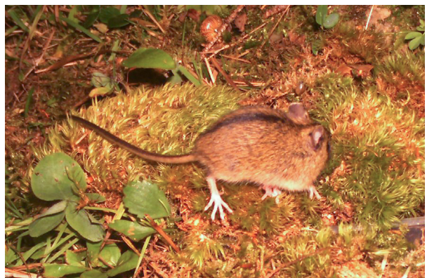
Abb. 9: WTK-Aufnahme der Waldbirkenmaus auf der Sulzried Alpe