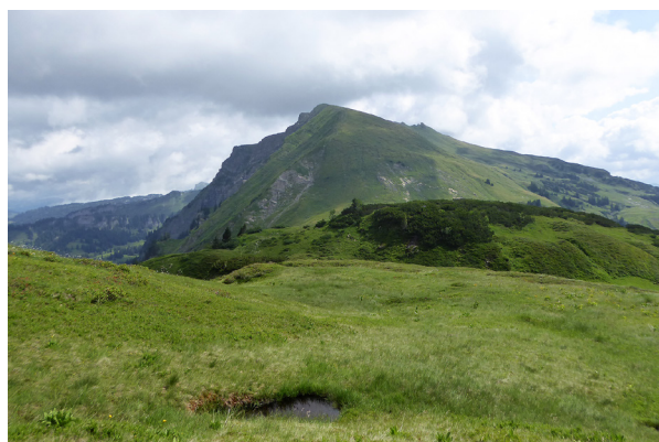
Abb. 3: Untersuchungsfläche Krüz

Mit Pferden (zehn Tiere) extensiv beweidete Alpe auf Steilhang mit strauchreichen Teilbereichen (Grünleren, Weiden und Fichten) und einzelnstehenden Fichten sowie einer Quellflur im unteren Hangbereich, in der Gemeinde Schröcken (WGS84: N 47,27290 / E 10,08935; Seehöhe 1.600 m). Untersuchungszeitraum und Umfang: drei WTKs von 19.06.2020 bis 21.08.2020.