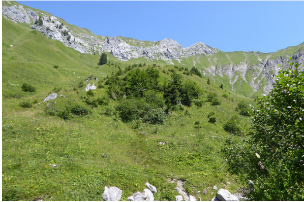
Abb. 4: Untersuchungsfläche Bellishegg Alpe