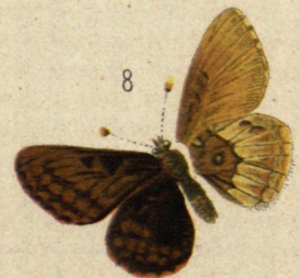
Fig. 1, 2, 3, 5, 8 Lud. Schneck, 4, 6, 7, 9 H.R.v. Mitis junx.