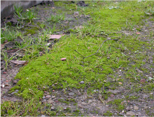
Abb. 28: Streblotrichum convolutum s. str. Flächige Bestände findet man regelmäßig auf offenen, älteren Wegen (Westfriedhof, Aachen/NRW, 27.12.2017,).