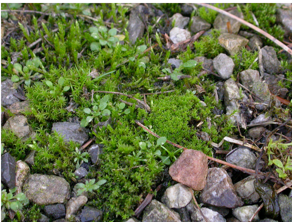
Abb. 32: Streblotrichum convolutum s. str. wächst selten auf frischem Schotter (Friedhof Kohlscheid-Kämpchen/NRW, 26.12.2017,).