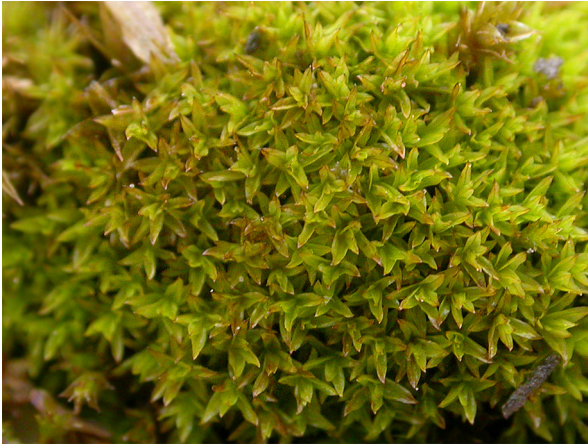
Abb. 20: Streblotrichum convolutum s. str. ist immer wieder mal auch dunkler gefärbt (nordwestlich Aachen-Vetschau/NRW, 09.03.2018,).