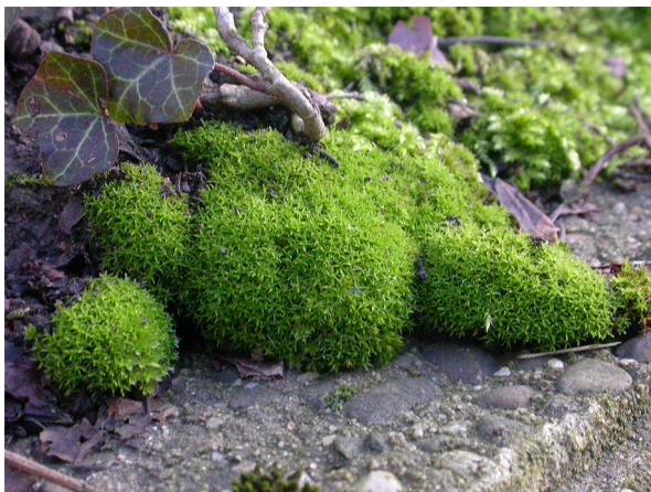
Abb. 4: Streblotrichum commutatum kann wie hier so kräftige Polster bilden, wie sie für Barbula unguiculata auf Mauern typisch sind, ist aber meist kleiner (Robert-Schuman-Straße, Aachen-Burtscheid/NRW, 13.01.2017,).