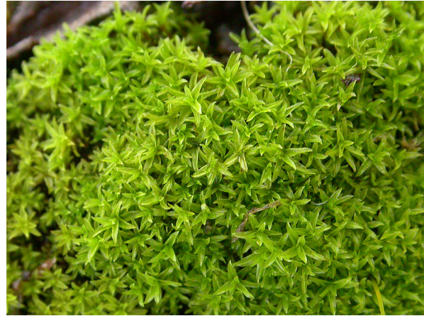
Abb. 21: Streblotrichum convolutum s. str. mit untypisch schmalen Blättern von gelbgrüner Farbe (Friedhof Aachen-Laurensberg-Hand/NRW, 28.12.2016,).