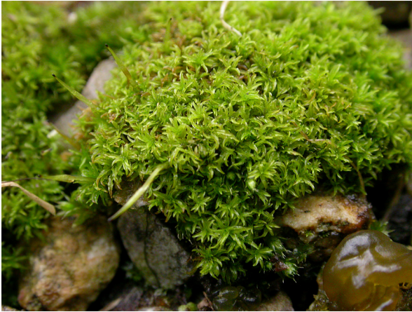
Abb. 8: Streblotrichum commutatum (Friedhof Kohlscheid-Ost/NRW, 26.12.2017,).