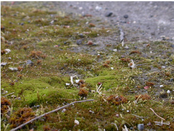
Abb. 30: Streblotrichum convolutum s. str. auf übererdetem Teer eines Straßenrandes in der Agrarlandschaft (nordwestlich Aachen-Vetschau/NRW, 09.03.2018,).