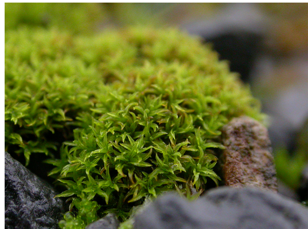
Abb. 7: Streblotrichum commutatum (Friedhof Aachen-Laurensberg-Hand/NRW, 04.11.2012,).