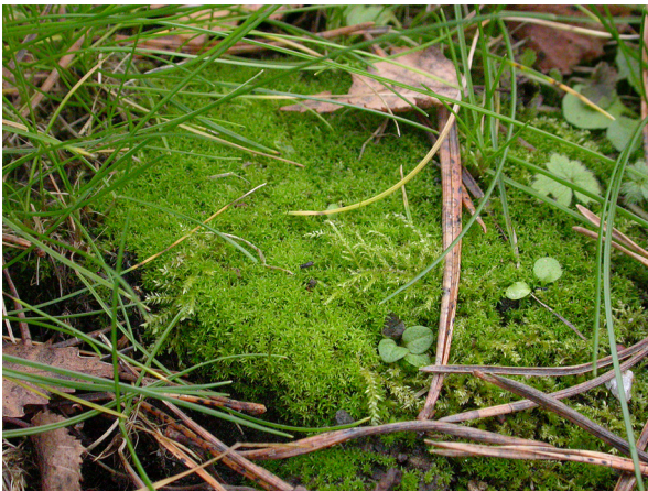
Abb. 26: Streblotrichum commutatum. Selten bildet die Art größere, homogene Rasen, besonders wie hier auf offenerdigen Stellen unter Waldrandklima (Waldfriedhof, Aachen/NRW, 31.12.2017,).