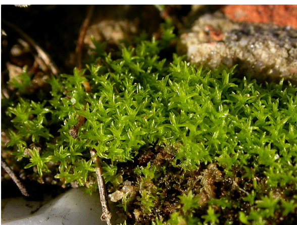
Abb. 18: Streblotrichum convolutum s. str. (Campus Melaten, Aachen/NRW, 03.12.2016,).