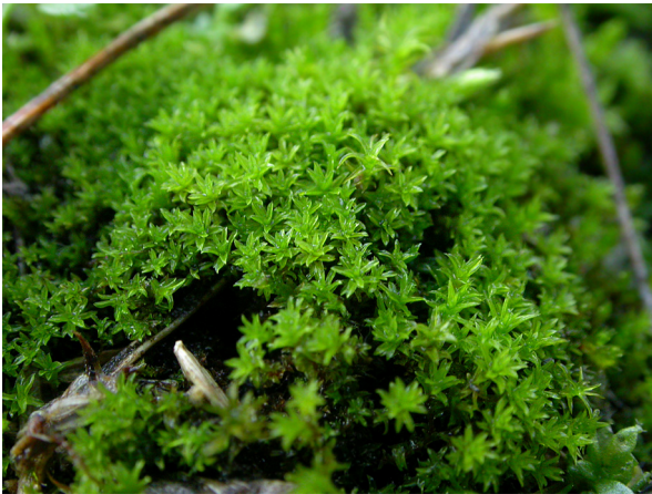
Abb. 16: Streblotrichum convolutum s. str. (Friedhof Kohlscheid-Kämpchen/NRW, 26.12.2017,).