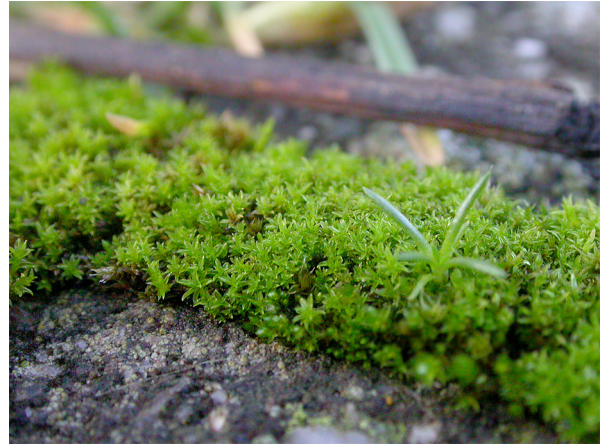
Abb. 29: Streblotrichum convolutum s. str. in Pflasterfuge (Westfriedhof, Aachen/NRW, 27.12.2017,).