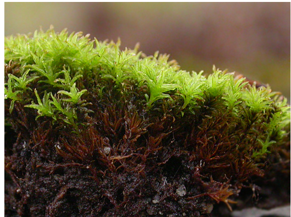
Abb. 11: Streblotrichum commutatum (Aachen-Laurensberg/NRW, 11.03.2018,).