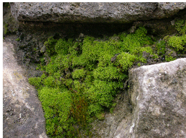
Abb. 23: Streblotrichum commutatum, großer Bestand in Mauerfuge (Aachen-Laurensberg/NRW, 11.03.2018,).