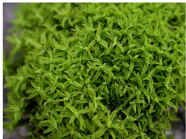
Abb. 13: Streblotrichum commutatum, trocknend (Robert-Schuman-Straße, Aachen-Burtscheid/NRW, 13.01.2017,).