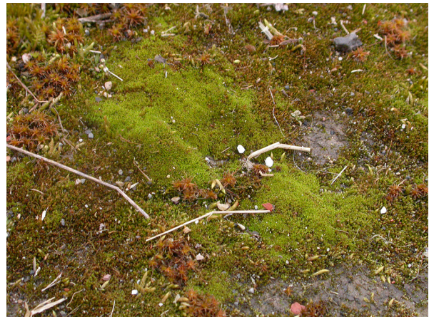
Abb. 31: Flächiger Bestand von Streblotrichum convolutum s. str. an Straßenrand (nordwestlich Aachen-Vetschau/NRW, 09.03.2018,).