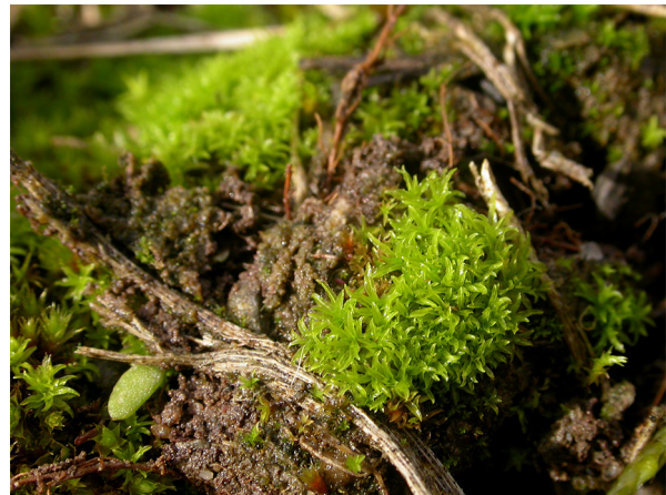
Abb. 27: Streblotrichum commutatum als Pionier an Störstellen am Rand einer Magerweide u. a. mit Potentilla verna, Bryum dichotomum und Phascum cuspidatum (zwischen Aachen-Walheim, Aachen-Sief und Aachen-Schmidthof/NRW, 21.01.2018,).

Streblotrichum commutatum ist offenbar in vielen Regionen Deutschlands deutlich seltener als S. convolutum (vgl. Einleitung). Parallel zur Seltenheit von S. commutatum wird ein ökologisch stenökes Verhalten genannt (Quellen vgl. Tab. 3): kalkreich, nährstoffreich, wärme- und feuchtigkeitsliebend und schattig. Im Aachener Raum ist S. commutatum verbreitet bis häufig und ökologisch relativ euryök. Hier sind Wärme, Kalk, Nährstoffreichtum, Feuchtigkeit und Schatten keine notwendigen Standortfaktoren, nur mögliche, teilweise bevorzugte Eigenschaften. Dies liegt sicher mitbegründet an dem hier herrschenden, wintermilden und feuchten atlantischen Klima. Jedenfalls kommt die als wärmeliebend geltende Art selbst auf Mauern im montanen Monschau (5403/14; 400–500 m ü. NN) recht häufig vor, wobei ein warmes Lokalklima im Rurtal und wärmespeichernde Mauern das kühle Montanklima mildern können. Im Stadtgebiet Aachen werden oft Stellen besiedelt, die nicht als warm bezeichnet werden können. Ebenfalls ist die Art im Untersuchungsgebiet nicht feuchtigkeitsliebend. Die Standorte sind zwar nicht extrem trocken, oft aber gut wasserzünftig. Selbst im Vergleich mit S. convolutum handelt es sich nicht um die Feuchtigkeit bevorzugendere Art. Eine Beurteilung der in der Literatur genannten Standortbedingungen im Untersuchungsgebiet wird zusammenfassend in Tab. 3 dargestellt.