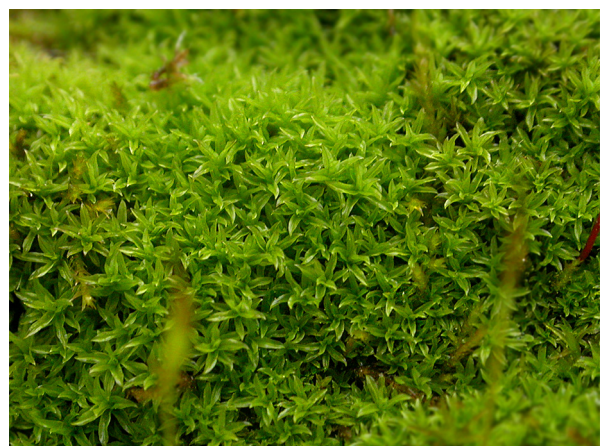
Abb. 19: Streblotrichum convolutum s. str. (zwischen Aachen-Vetschau und Aachen-Orsbach/NRW, 09.03.2018,).