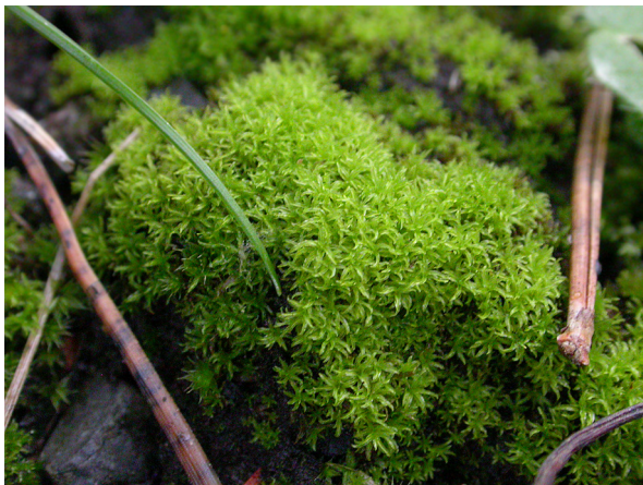
Abb. 6: Streblotrichum commutatum (Waldfriedhof, Aachen/NRW, 31.12.2017,).