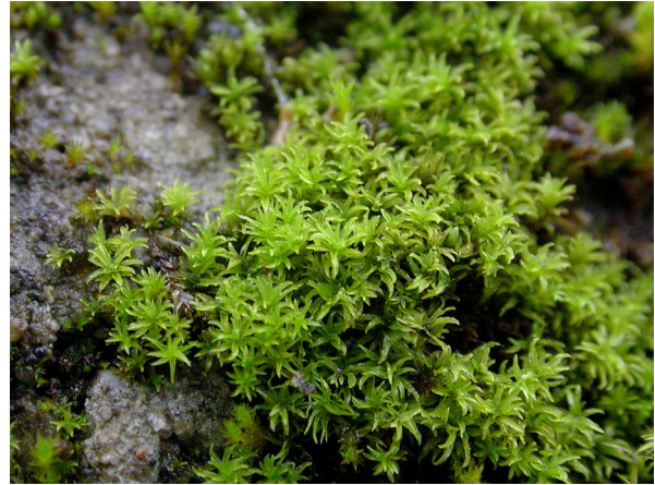
Abb. 9: Streblotrichum commutatum (Friedhof Kohlscheid-Ost/NRW, 26.12.2017,).