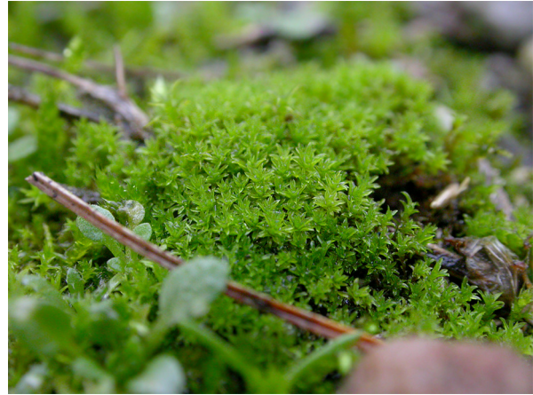
Abb. 15: Streblotrichum convolutum s. str. (Friedhof Kohlscheid-Kämpchen/NRW, 26.12.2017,).