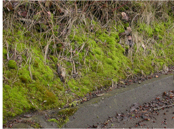
Abb. 25: Streblotrichum commutatum, große Bestände an einer halbschattigen Straßenböschung (Aachen-Laurensberg/NRW, 16.03.2018,).