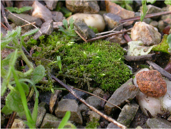
Abb. 24: Streblotrichum commutatum auf offenem Schotter (Friedhof Kohlscheid-Kämpchen/NRW, 26.12.2017,).