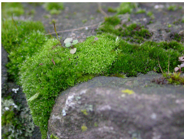
Abb. 22: Streblotrichum commutatum auf einer Mauerkrone (Turmstraße, Aachen/NRW, 25.12.2017,).

Streblotrichum commutatum besiedelt auch regelmäßig offene Böden (Abb. 25 & 26). Dies konnte besonders an schattigen Stellen beobachtet werden. Jedoch zeigen Feststellungen an Störstellen in Viehweiden und an deren Rändern im Raum Aachen-Walheim (5202/44 & 5203/33), dass die Art auch offene, relativ magere und relativ trockene Pionierstandorte besiedeln kann (Abb. 27). Die Böden sind dabei meist lehmig, selten auch etwas sandig.