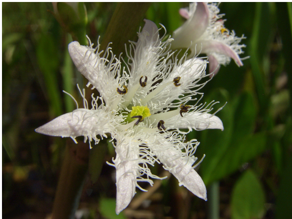
Abb. 1: Menyanthes trifoliata, Blüte (Witten, in Kultur, 04.05.2006,).

Es bleibt also zu erwarten, dass wir 2020 die attraktive Blüte des Fieberklees bei klimapolitischen Themen in den Medien häufig zu Gesicht bekommen, jedenfalls häufiger als wir sie am natürlichen Standort bewundern können.