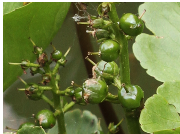
Abb. 14: Menyanthes trifoliata, unreife Früchte (Kleintettau/BY, 28.05.2011,).