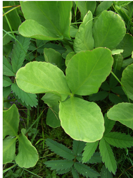
Abb. 16: Menyanthes trifoliata am Moosberg/BW mit Comarum palustre (09.06.2012,).