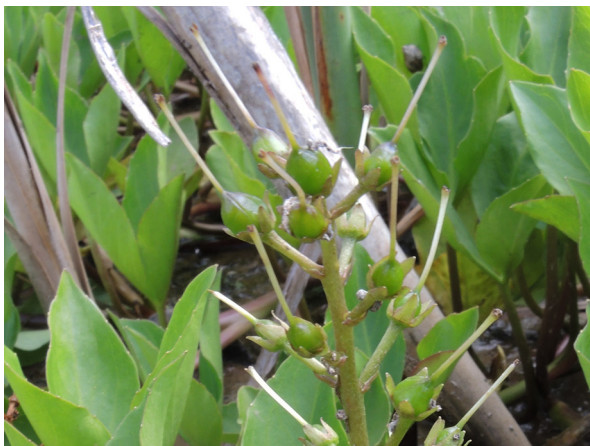
Abb. 13: Menyanthes trifoliata, verblüht (Wuppertal, NSG Eskesberg, 15.06.2014,).