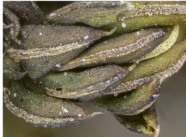
Abb. 4: Syntrichia papillosa in trockenem Zustand. Die dorsale Seite der Blätter, insbesondere die Rippe, ist von zahlreichen Papillen bedeckt. Lange Bildkante 1,8 mm (N. J. Stapper).