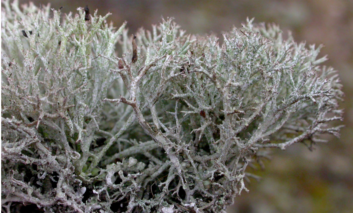
Abb. 8: Cladonia rangiformis, erwachsene Podetien seitlich (Halde Gouley, zwischen Kohlscheid und Würselen, Städteregion Aachen/NRW, 16.02.2013,).