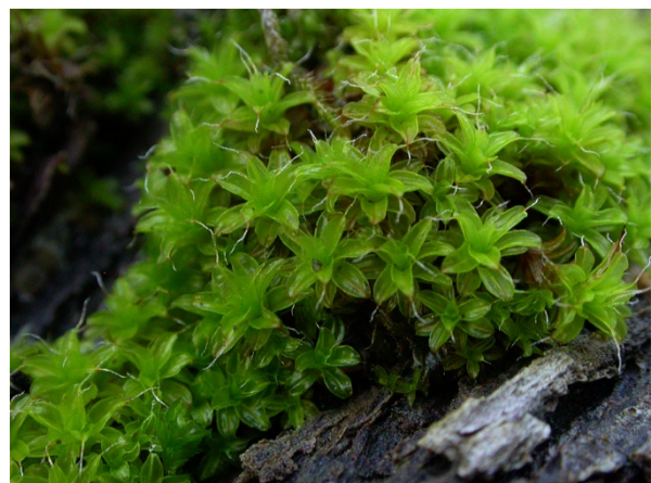
Abb. 23: Das Kalkbewohnende Netzmundmoos, Syntrichia calcicola wächst auf Mauern und auf basenreichen, offenen Böden wie lückigen Kalkmagerrasen (Westfriedhof, Aachen/NRW, 11.11.2012,).