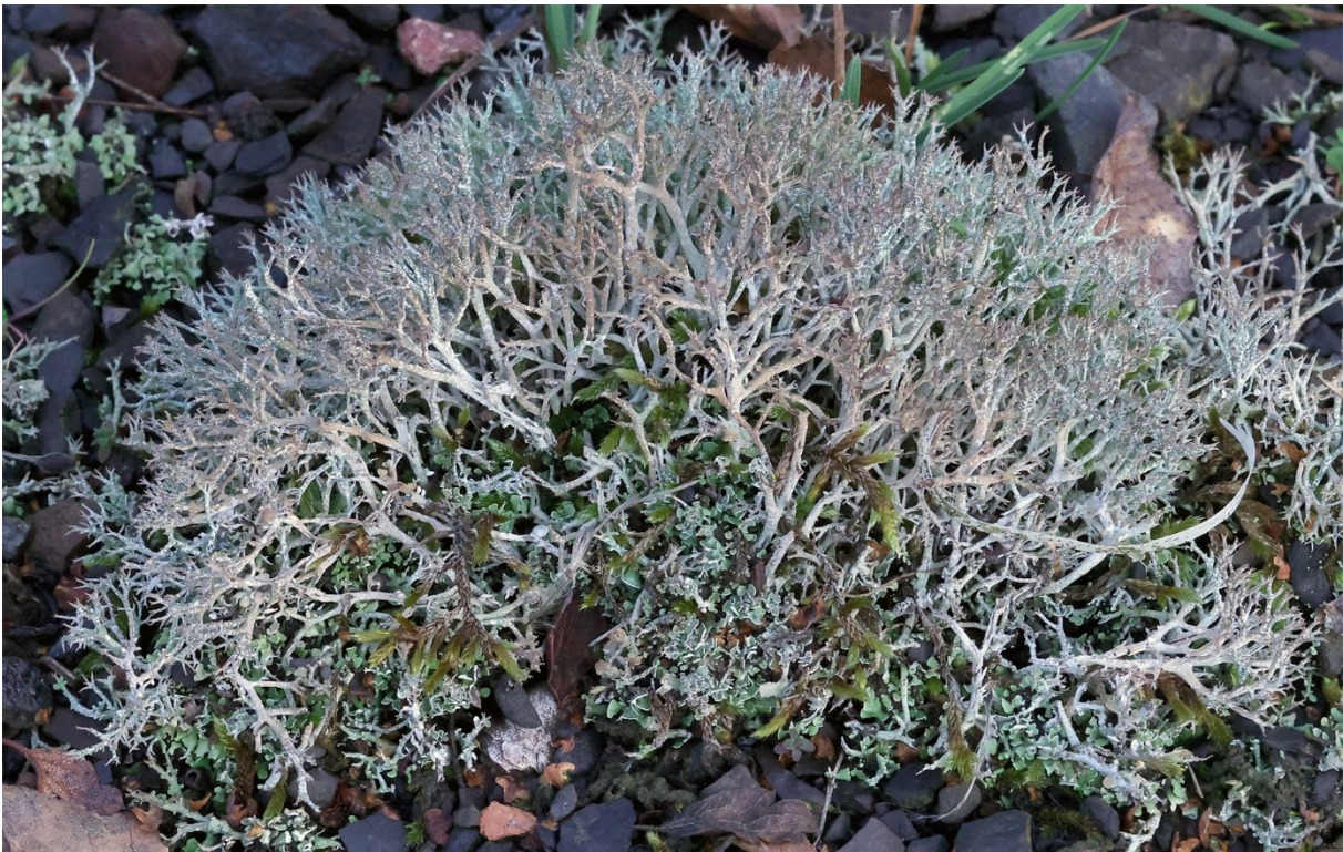
Abb. 7: Cladonia rangiformis, Habitus seitlich (Halde Gouley, zwischen Kohlscheid und Würselen, Städteregion Aachen/NRW, 08.01.2023,).