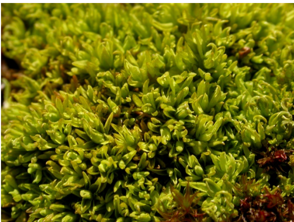
Abb. 17: Tortella inclinata, Polster von oben (am Wollerscheider Venn, Lammersdorf, Städteregion Aachen/NRW, 07.03.2021,).