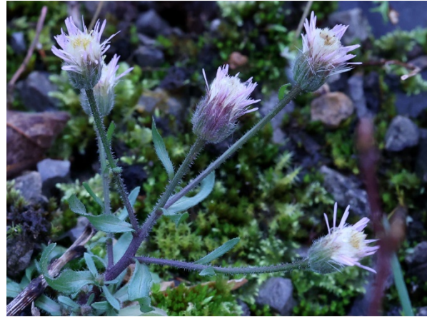
Abb. 25: Das Mauer-Berufkraut, Erigeron muralis blüht im Gegensatz zu E. acris s. str. später und hat gedrehte Stängelblätter. Es ist eine charakteristische Pionierart auf basenreichen Böden (Aachen-Hahn/NRW, 11.11.2023,).