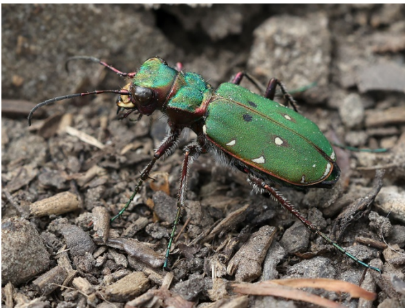
Abb. 26: Der Feld-Sandlaufkäfer, Cicindela campestris benötigt auch als Larve offene Böden. Die adulten Käfer suchen hier nach Beutetieren (Aachener Stadtwald/NRW, 19.06.2022,).