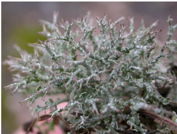
Abb. 9: Cladonia rangiformis, deutlich gefleckte Podetien mit einzelnen Schuppen (Halde Gouley, zwischen Kohlscheid und Würselen, Städteregion Aachen/NRW, 16.02.2013,).