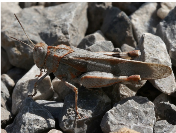
Abb. 32: Die Blauflügelige Ödlandschrecke, Oedipoda caerulescens hat sich in der letzten Zeit ausgebreitet und ist heute selbst auf offenen Flächen im Siedlungsbereich anzutreffen (Friedhof Jülich, Kreis Düren/NRW, 18.08.2022,).