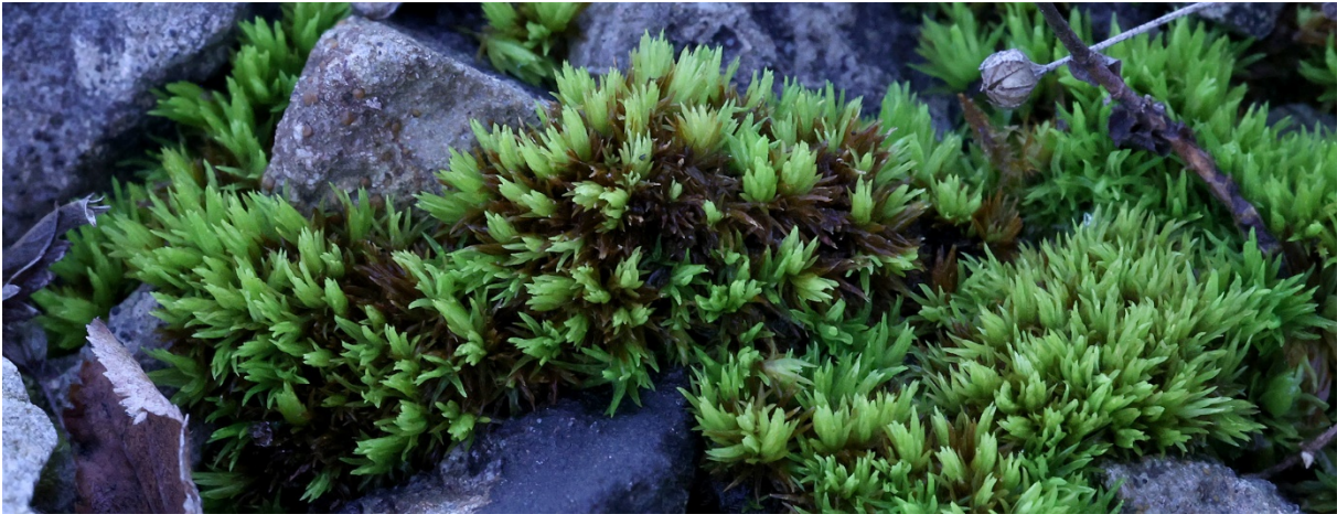
Abb. 16: Tortella inclinata, Habitus (Aachen-Hahn/NRW, 07.01.2023,).