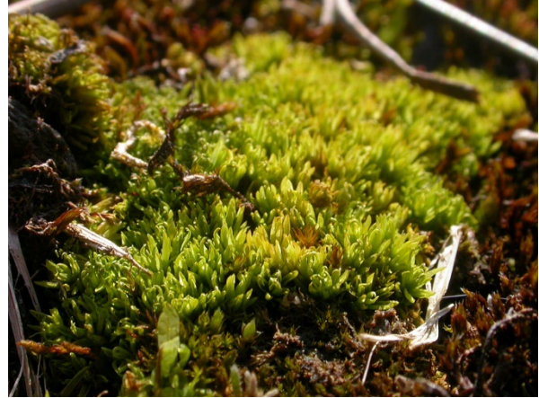
Abb. 15: Tortella inclinata, Habitus (am Wollerscheider Venn, Lammersdorf, Städteregion Aachen/NRW, 07.03.2021,).