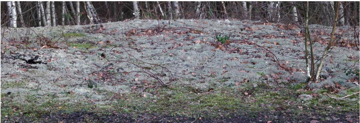
Abb. 2: Cladonia rangiformis, Bestand (Halde Gouley, zwischen Kohlscheid und Würselen, Städteregion Aachen/NRW, 08.01.2023,).