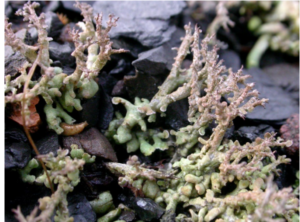
Abb. 6: Cladonia rangiformis, Habitus mit jungen Podetien (Halde Gouley, zwischen Kohlscheid und Würselen, Städteregion Aachen/NRW, 22.02.2014,).