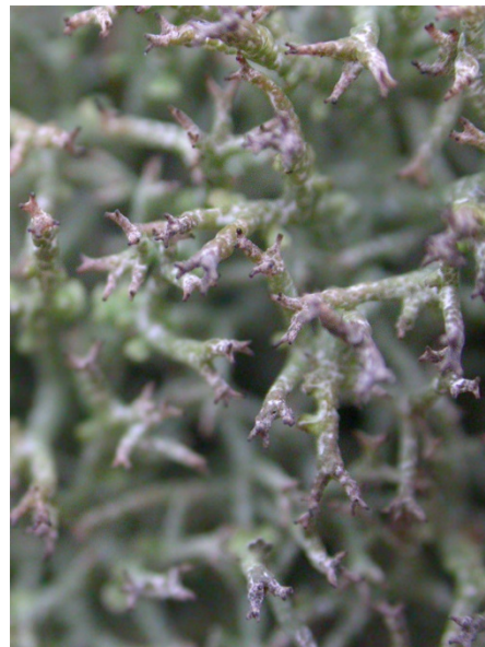
Abb. 10: Cladonia rangiformis, Spitzen der Podetien (zwischen Aachen-Sief und Aachen-Walheim/NRW, 19.02.2006,).