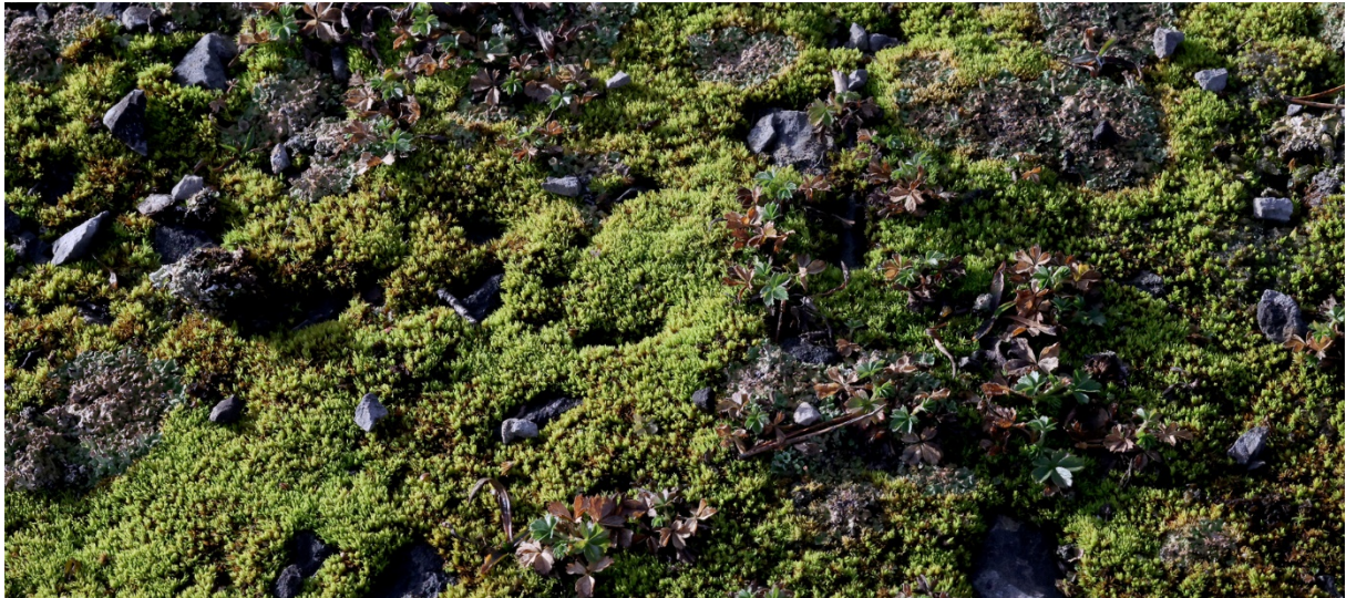
Abb. 12: Tortella inclinata, Bestand (Aachen-Hahn/NRW, 07.01.2023,).