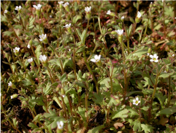
Abb. 30: Der Dreifinger-Steinbrech, Saxifraga tridactylites ist ein Pionier basenreicher Böden und besiedelt heute auch vielfach naturfernere Lebensräume (Aachen-Hahn/NRW, 20.04.2013,).