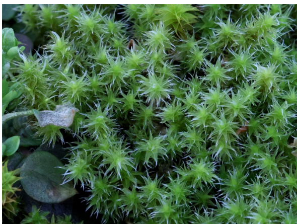
Abb. 22: Das Graue Zackenmützenmoos, Racomitrium canescens s. str. besiedelt eher als verwandte Arten basenreiche Böden und hier lückig bewachsene Flächen (Aachen-Hahn/NRW, 07.01.2023,).