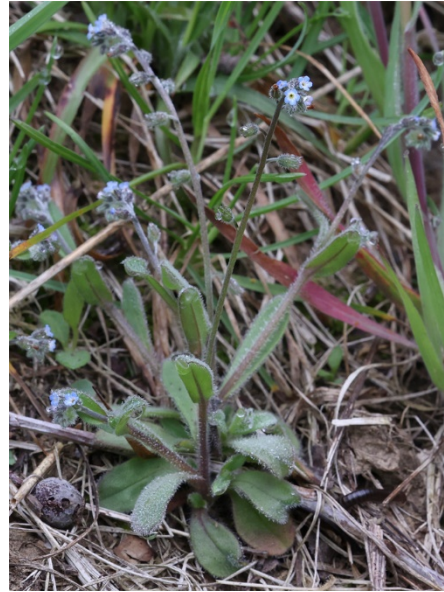
Abb. 31: Das Hügel-Vergissmeinnicht, Myosotis ramosissima war ursprünglich ein Pionier in offenen Magerrasen und ist heute an offenen Stellen besonders in der Nähe zu Bahnlinien weit verbreitet (bei Kohlscheid-Bank, Städteregion Aachen/NRW, 15.04.2022,).