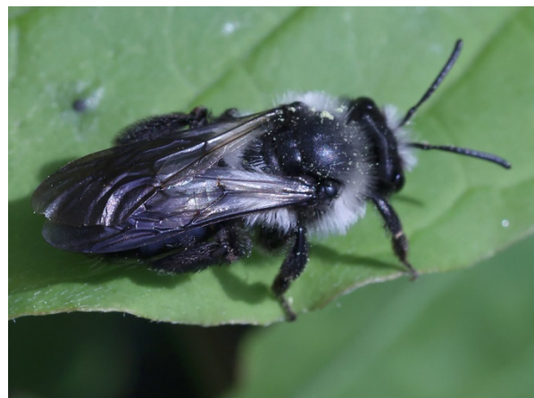
Abb. 29: Die Aschgraue Erdbiene, Andrena cineraria, ist eine recht verbreitete Art in mageren Rasengesellschaften. Zur Nestanlage benötigt sie wie viele im Boden nistende Bienen eine höchstens lückige Vegetation (Aachen-Hahn/NRW, 29.05.2023,).