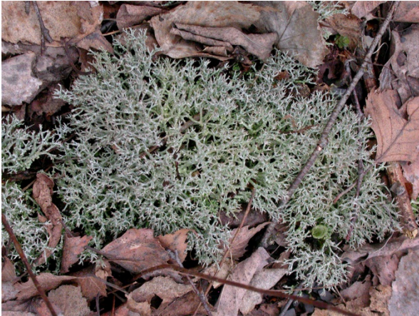
Abb. 5: Cladonia rangiformis, Habitus von oben (Halde Gouley, zwischen Kohlscheid und Würselen, Städteregion Aachen/NRW, 16.02.2013,).