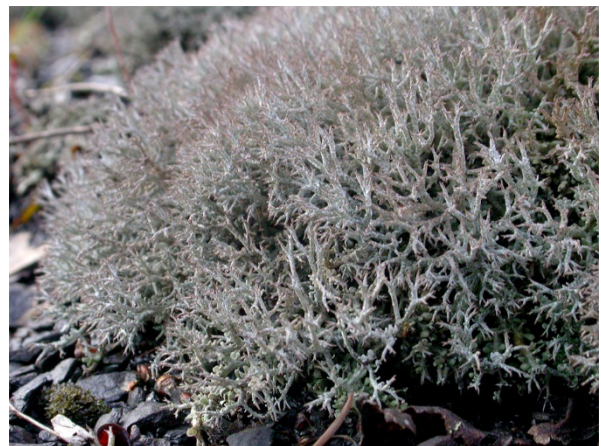
Abb. 4: Cladonia rangiformis, Habitus seitlich (Halde Gouley, zwischen Kohlscheid und Würselen, Städteregion Aachen/NRW, 22.02.2014,).