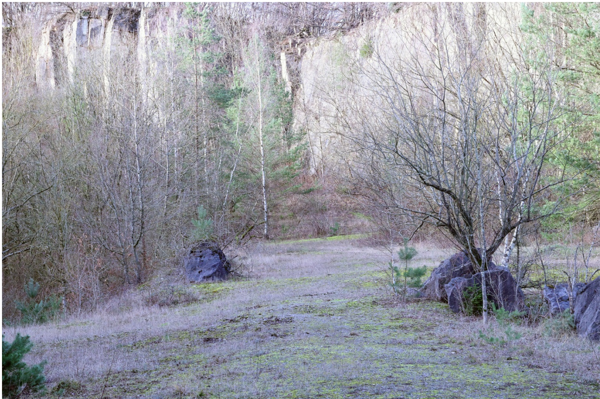
Abb. 11: Lebensraum Steinbruch mit reichen Vorkommen von Tortella inclinata (Aachen-Hahn/NRW, 07.01.2023,).

Das Geneigte Spiralzahnmoos ( Tortella inclinata ) ist ein mittelgroßes Laubmoos, das kleine Polster bildet oder flächig wächst. Die Grundfarbe ist ein reines, recht helles Grün. Hierdurch ähnelt T. inclinata vielen anderen Moosen. Näher betrachtet fällt es jedoch auf durch aufrechte, feucht gerade Blättchen, die plötzlich in eine recht stumpfe, kapuzenförmige Spitze verschmälert sind. Im oberen Bereich sind die Blattränder zur Oberseite hin eingebogen. Sie sind matt und undurchsichtig. Hierdurch lässt sich die Art von habituell und farblich ähnlichen Moosen wie z. B. Arten der Gattungen Barbula , Didymodon , Pseudocrossidium und Streblotrichum unterscheiden. Der charakteristische Lebensraum von T. inclinata kann die Bestimmung unterstützen. Im Zweifelsfall ist jedoch eine mikroskopische Untersuchung unter Berücksichtigung von Spezialliteratur notwendig.