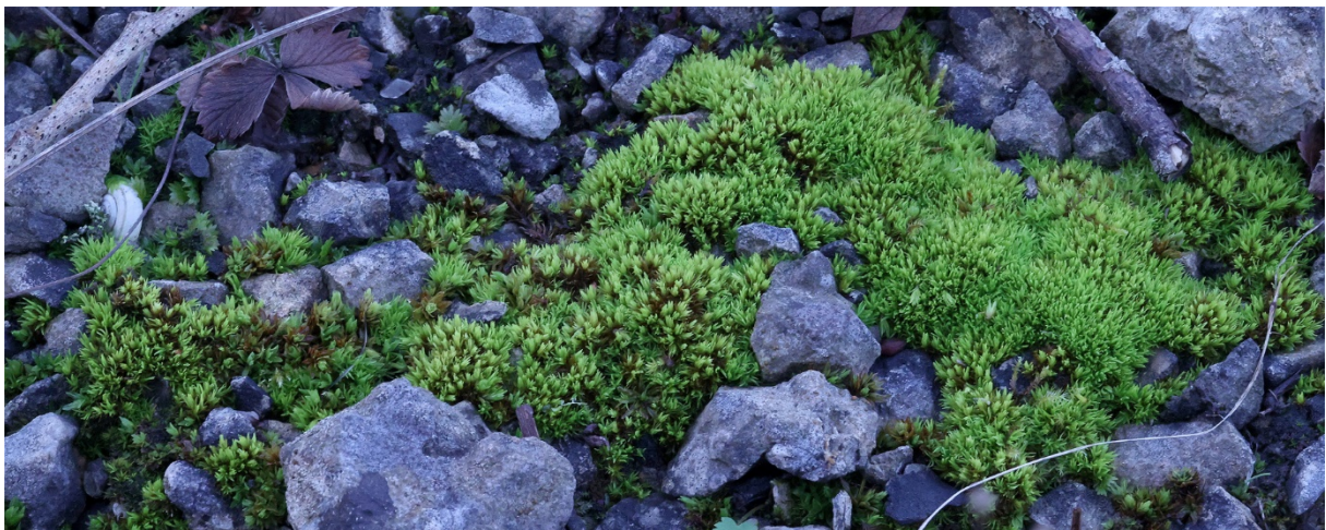
Abb. 13: Tortella inclinata, Habitus (Aachen-Hahn/NRW, 07.01.2023,).