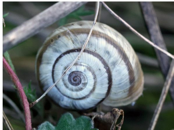
Abb. 27: Die Gewöhnliche Heideschnecke, Helicella itala ist eine charakteristische Art kalkreicher, offener Flächen und gerne in lückigen Kalkmagerrasen zu finden (Campus Melaten, westl. Aachen-Hörn/NRW, 07.11.2023,).