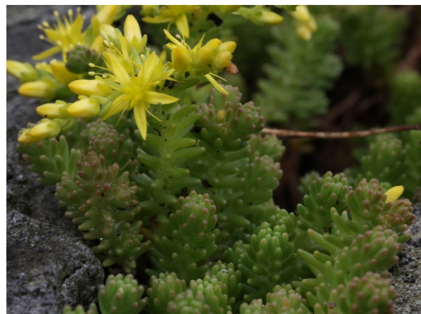
Abb. 33: Der Milde Mauerpfefter, Sedum sexangulare war früher gebietsweise eine seltene Art und konnte sich in jüngerer Zeit ausbreiten und diverse trocken-warme Orte im Siedlungsraum besiedeln (Friedhof Monschau, Städteregion Aachen/NRW, 26.06.2022,).