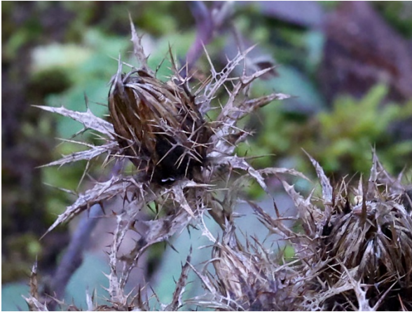
Abb. 24: Die in lückigen Kalkmagerrasen und anderen basenreichen Pionierlebensräumen wachsende Gewöhnliche Golddistel, Carlina vulgaris hat auch noch abgestorben einen optischen Reiz (Aachen-Hahn/NRW, 11.11.2023,).