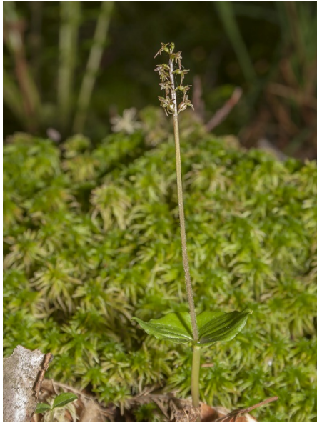
Abb. 3: Neottia cordata, blühende Pflanze (Kreis Olpe, 03.07.2007,).