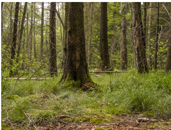
Abb. 5: Neottia cordata in einem Bruchwald im Kreis Olpe (03.06.2007,).