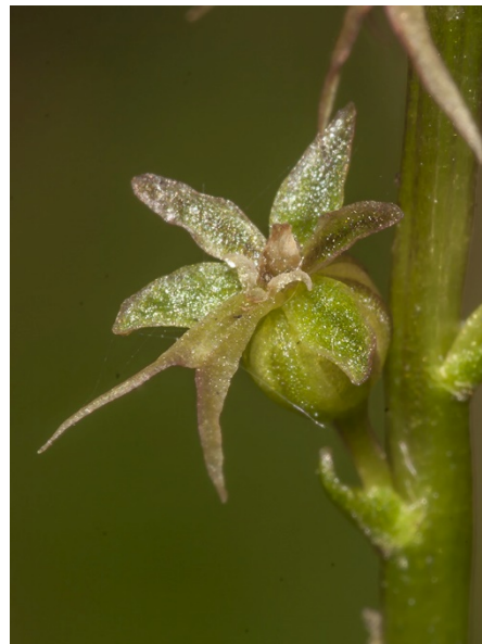
Abb. 12: Neottia cordata, Einzelblüte mit tief zweizipfelter Lippe (Kreis Olpe, 03.06.2007,).