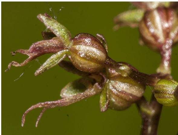
Abb. 1: Neottia cordata, Blüte mit verdickten Fruchtknoten (Kreis Olpe, 03.06.2007,).

Die Arbeitskreise Heimische Orchideen Deutschland haben für das Jahr 2023 das Herzblättrige (Kleine) Zweiblatt ( Neottia cordata ) zur „Orchidee des Jahres“ gewählt. Diese Orchideenart kommt heute in Nordrhein-Westfalen an nur einem einzigen Fundort vor. Nur in Baden-Württemberg und Bayern ist sie noch nicht gefährdet.