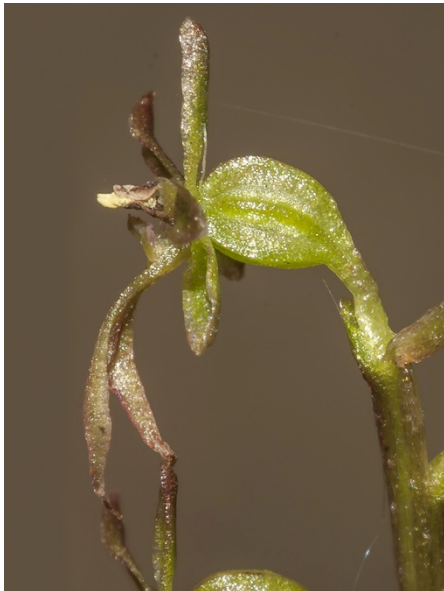
Abb. 15: Neottia cordata, Blüte mit Pollinien (Schweden, 06.06.2022,).