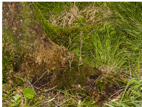
Abb. 6: Neottia cordata auf einer Baumwurzel, immer oberhalb der Wasseroberfläche (Kreis Olpe, 03.06.2007,).