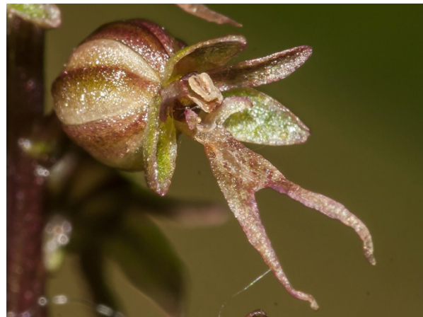
Abb. 2: Neottia cordata, Einzelblüte, Lippenbasis mit Nektargrube (Kreis Olpe, 03.06.2007,).