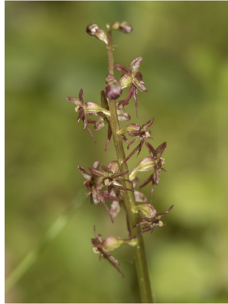
Abb. 10: Neottia cordata, Blütenstand mit bereits verdickten Fruchtknoten (Schweden, 06.06.2022,).