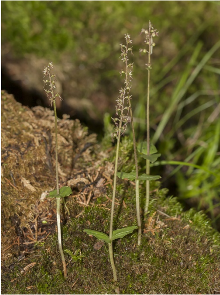
Abb. 9: Neottia cordata, Gruppe (Kreis Olpe, 03.06.2007,).