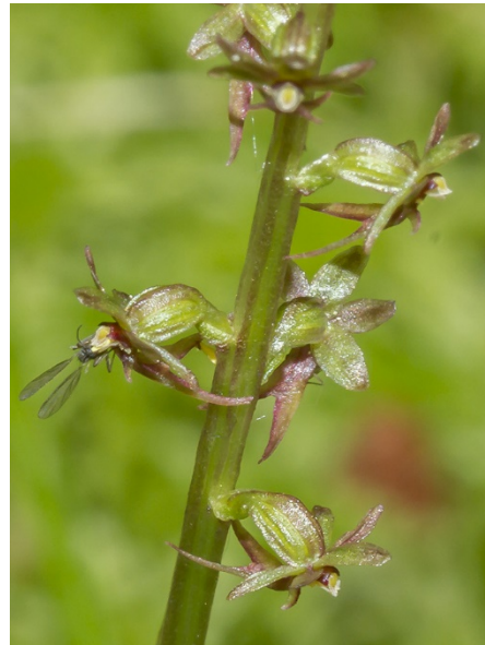
Abb. 16: Neottia cordata mit Bestäuber (Schweden, 06.06.2022,).