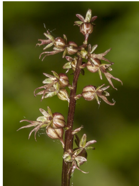
Abb. 8: Neottia cordata, Blütenstand (Kreis Olpe, 03.06.2007).

Die Blüten sind sehr klein, grün, und vor allem Lippe und Petalen sind meist stark braunrot überlaufen (Abb. 1, 2 & 13). Die Sepalen und Petalen sind ausgebreitet. Die Lippe ist tief zweispaltig mit spitzen Zipfeln (Abb. 1, 2 & 12). Sie hat an der Lippenbasis kleine Seitenlappen neben der Nektargrube (Abb. 12). Der Fruchtknoten ist meist kurz nach Blühbeginn schon verdickt (Abb. 10). Die Kronblätter bleiben bis zur Samenreife am Fruchtknoten (AHO NRW 2018). Die Art ist nur wenig veränderlich, sehr selten treten drei- oder vierblättrige Pflanzen oder Pflanzen mit gelbgrünen Blüten (Abb. 14) auf. In Nordrhein-Westfalen blüht sie von Ende Mai bis Juni.