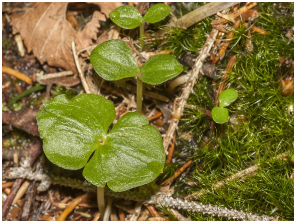
Abb. 7: Neottia cordata, Laubblätter (Kreis Olpe, 03.06.2007,).

Die Pflanzen sind klein, zart und unscheinbar, worauf auch ein weiterer Name – Kleines Zweiblatt – hinweist. Am 5–20 cm hohen Stängel sitzen zwei frischgrüne, oberseits glänzende herzförmige bis dreieckige ungestielte Laubblätter, auf die sich der deutsche und lateinische Name beziehen (Abb. 3 & 7). Sie sind fast gegenständig und stehen nur wenig über dem Boden. Der lockere Blütenstand besteht aus 8–15 Blüten (Abb. 8).