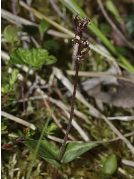
Abb. 13: Neottia cordata, dunkle Blütenfarbe (Schweden, Lappland, 04.07.2008,).