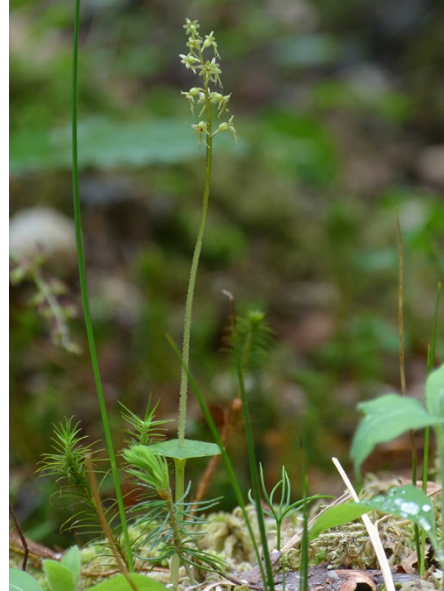
Abb. 14: Neottia cordata, grünliche Form (Kreis Olpe, 07.06.2021,).