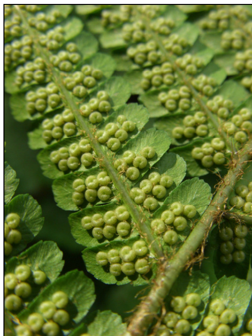
Abb. 5: Mit Spreuschuppen besetzte Rhachis sowie junge Sporangien von Dryopteris affinis s. l. am Fundort im NSG "Langeloh" in Herne (MTB 4409/42) (06/2008)