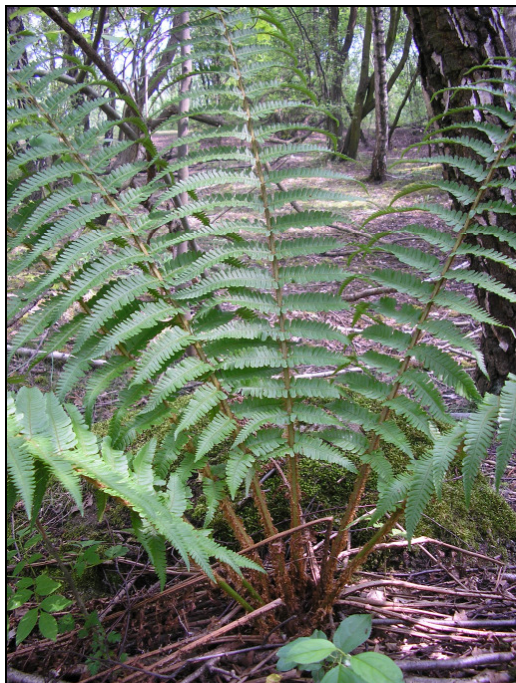
Abb. 2: Ein Stock von Dryopteris affinis s. l. in einem lichten Birken-Pionierwald im Landschaftspark "Pluto-Wilhelm" in Wanne-Eickel (MTB 4408/44) (06/2008, P. GAUSMANN)

einzelnen Sippen des Dryopteris affinis -Komplexes zu verschaffen. Interessant bleibt zu beobachten, ob die unterschiedlichen Sippen auch ein unterschiedliches ökologisches Verhalten zeigen oder sogar ein eigenes Areal ausbilden.