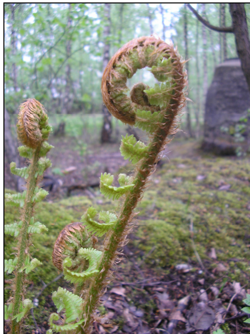
Abb. 3: Bereits die sich ausrollenden, jungen Wedel ("Bischofsstäbe") von Dryopteris affinis s. l. sind dicht mit Spreuschuppen besetzt, wie hier am Exemplar im Landschaftspark "Pluto-Wilhelm" (MTB 4408/44) (04/2009, P. GAUSMANN)