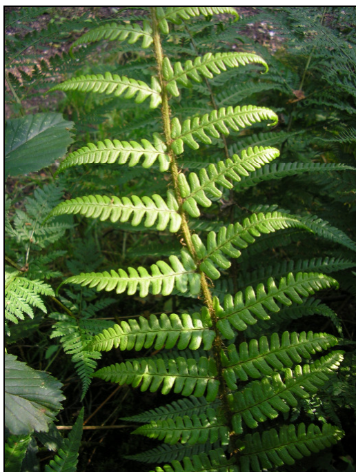
Abb. 4: Kümmerlich entwickelte Einzelpflanze von Dryopteris affinis s. l. am Fundort in Niederkrüchten (MTB 4703/33) (06/2008)