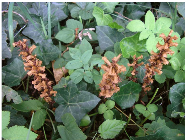
Abb. 2: Teil der Population von verblühter Orobanche hederæ am Saum eines Feldweges in Dortmund-Lütgendortmund mit Wirtspflanze Hedera helix sowie Aegopodium podagraria als Begleiter (09.08.2010,).

Im August 2010 konnte vom Erstautor eine kleinere Population von Orobanche hederæ in der Nähe von Schloss Dellwig in Dortmund-Lütgendortmund am Saum eines landwirtschaftlichen Wirtschaftsweges gefunden werden (MTB 4410/33, vgl. auch BOCHUMER BOTANISCHER VEREIN 2011).