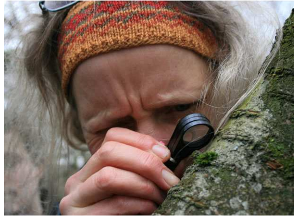
Durch die Lupe betrachtet (C. BUCH).