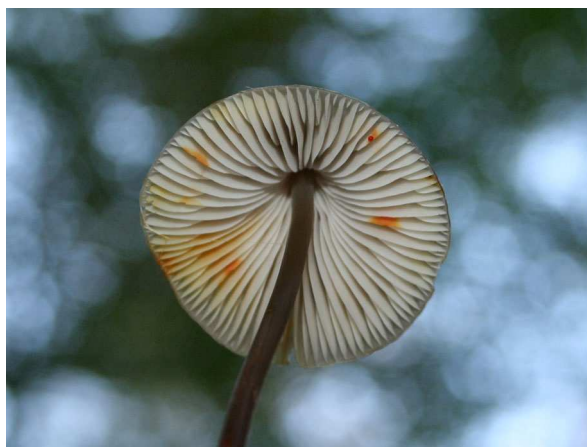
Safranmilchender Helmling ( Mycena crocata ) (C. BUCH).