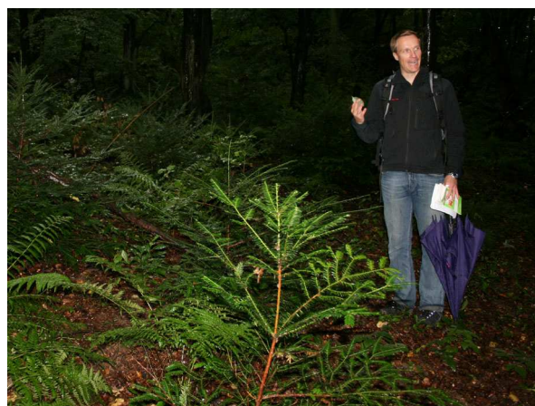
Verwilderte Eiben ( Taxus baccata ) (C. BUCH).