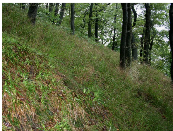
Hang mit Schmalblättriger Hainsimse ( Luzula luzuloides ) und Wald-Hainsimse ( Luzula sylvatica ) (C. BUCH).