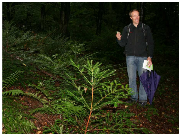
Verwilderte Eiben ( Taxus baccata ) (C. BUCH).