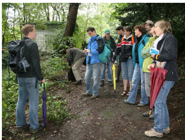
Exkursionsgruppe (C. BUCH).

Das Naturschutzgebiet rund um das Casino und die Burgruine Hohensyburg im Dortmunder Süden gehört geografisch zum Ardeygebirge an der Nordgrenze des Süderberglandes. An den flachgründigen, bis zu 150 m zum Hengsteysee hin abfallenden Südhängen des Sybergs (= Burgberg) ist v. a. das Luzulo-Quercetum (Hainsimsen-Traubeneichenwald) anzutreffen. Diese bodensauren und trockenen Hangwälder stocken hier auf flözführenden Schichten des Oberkarbons aus Sandsteinen mit Schiefertönen und Sandschiefern. Am Westhang des Sybergs sind noch ehemalige Stollenmundlöcher, Halden und Pingen zu erkennen, die zum Abbau des ersten abbauwürdigen Steinkohleflözes des Ruhr-Beckens entstanden sind. Bemerkenswert sind die Wälder u. a. wegen ihrer ungewöhnlich großen Anzahl an spontanen Verjüngungen der Europäischen Eibe ( Taxus baccata ).