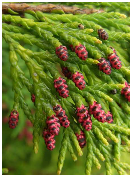
Abb. 6: Chamaecyparis lawsoniana (Lawsons Scheinzypresse, Cupressaceae ), männliche Blüten (Pollenzapfen).