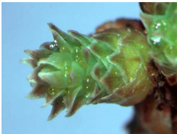
Abb. 13: Taxodium distichum (Sumpfyypresse, Cupressaceae ), Zapfen mit Bestäubungstropfen (A. JAGEL).