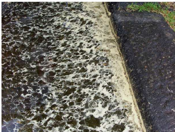
Abb. 5: Riesige Mengen von Pollen windbestäubter Arten in einer Pfütze. Die Pollenkörner haben ihr eigentliches Ziel verfehlt: die Bestäubung der weiblichen Blüte (A. JAGEL).

Bemerkenswert an dieser Stelle ist, dass es Allergien gegen Koniferen-Pollen bei uns aus bisher ungeklärten Gründen so gut wie nicht gibt, der Allergiker kann also tief durchatmen.