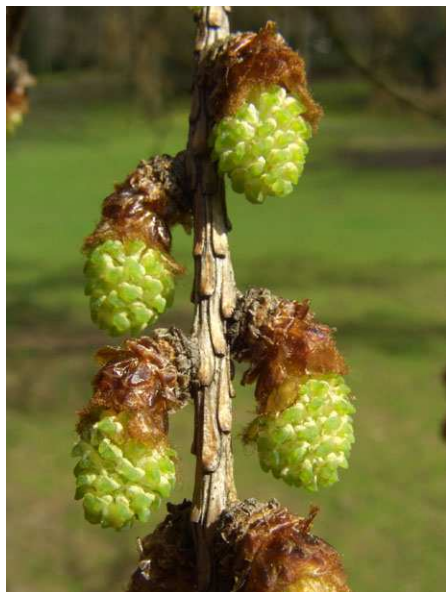
Abb. 7: Larix kaempferi (Japanische Lärche, Pinaceae ), männliche Blüten (A. JAGEL).