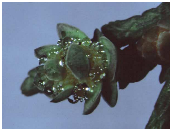
Abb. 17: Cupressus sempervirens (Mittelmeer-Zypresse, Cupressaceae ), Zapfen mit verschiedenen großen Bestäubungstropfen (A. JAGEL).

Die Zypressengewächse haben neben der Einlagerung von Zuckern zur Steigerung der Viskosität, weitere Mechanismen entwickelt, um die Größe des Tropfens zu erhöhen. Bei den echten Zypressen ( Cupressus spp. ) z. B. und bei einigen Wacholder-Arten ( Juniperus spp. ) laufen die Tropfen benachbarter Samenanlagen zu einem viel größeren, gemeinsamen zusammen. Hierdurch wird die Oberfläche zum Pollenfang deutlich vergrößert. Benachbarte Samenanlagen arbeiten also zusammen und es handelt sich dabei um ein selbstloses Miteinander, denn nicht jede beteiligte Samenanlage bekommt dabei ein Pollenkorn ab und verkümmert anschließend. Daher ist auch die Anzahl der Samenanlagen in einem Zypressenzapfen in der Regel sehr viel höher als die der letztlich herangereiften Samen.