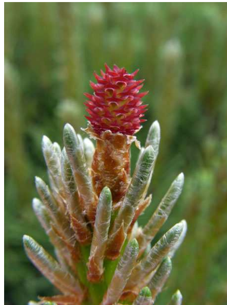
Abb. 4: Pinus mugo (Berg-Kiefer, Pinaceae ), blühender Zapfen (A. JAGEL).

Anders als tierbestäubte Arten überlassen die Koniferen, wie auch andere windbestäubte Gehölze, die Bestäubung in einem hohen Maße dem Zufall. Der Pollen wird durch den Wind verdriftet, breitet sich aber ansonsten ungerichtet aus und ist völlig unabhängig von den bestäubungsfähigen Samenzapfen unterwegs. Die Koniferen haben allerdings eine Reihe von Mechanismen entwickelt, die die Wahrscheinlichkeit erhöhen, dass auf der reifen Samenanlage auch wirklich ein Pollenkorn landet. Dazu wird zunächst einmal eine riesige Menge an Pollen in den Pollenzapfen (männliche Blüten) produziert (Abb. 6-8), denn der allergrößte Teil landet eben nicht auf Samenanlagen, sondern auf dem Erdboden (Abb. 5) oder besonders augenscheinlich auch auf Fenster- oder Autoscheiben. Eine gigantische Verschwendung, wenn man so will.