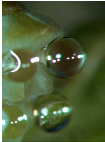
Abb. 20: Calocedrus formosana (Formosa-Weihrauchzeder, Cupressaceae ) aus Taiwan, die Bestäubungstropfen lehnen sich an und können dadurch größer werden.

In anderen Fällen scheinen die Samenanlagen förmlich bemüht zu sein, ein Zusammenfließen ihrer Tropfen zu vermeiden, wie dies z. B. bei den Wacholder-Arten der Sect. Juniperus der Fall ist. Hier ist die Öffnung der Samenanlage (die Mikropyle) etwas schräg ausgebildet, sodass der Tropfen nach außen zeigt und damit von den anderen Tropfen weg (Abb. 19). Der normal ausgebildete Zapfen innerhalb dieser Wacholdergruppe enthält nur drei Samen. Hier ist es offensichtlich sinnvoll, dass jede Samenanlage für sich alleine sorgt. Allerdings existieren auch Zapfen mit wenigen Samenanlagen, bei denen die Tropfen zusammenfließen, wie z. B. bei der Nutka-Zypresse ( Cupressus nootkatensis , vgl. Abb. 9).