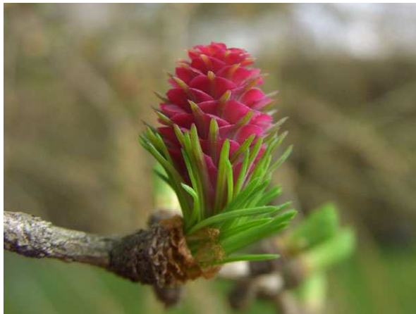
Abb. 3: Larix decidua (Europäische Lärche, Pinaceae ), blühender Zapfen (A. JAGEL).