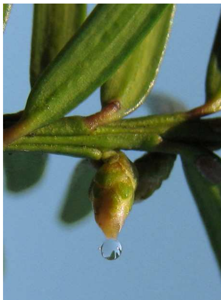
Abb. 16: Taxus baccata (Europäische Eibe, Taxaceae ), Bestäubungstropfen (V. M. DÖRKEN).

Die Zypressengewächse haben neben der Einlagerung von Zuckern zur Steigerung der Viskosität, weitere Mechanismen entwickelt, um die Größe des Tropfens zu erhöhen. Bei den echten Zypressen ( Cupressus spp. ) z. B. und bei einigen Wacholder-Arten ( Juniperus spp. ) laufen die Tropfen benachbarter Samenanlagen zu einem viel größeren, gemeinsamen zusammen. Hierdurch wird die Oberfläche zum Pollenfang deutlich vergrößert. Benachbarte Samenanlagen arbeiten also zusammen und es handelt sich dabei um ein selbstloses Miteinander, denn nicht jede beteiligte Samenanlage bekommt dabei ein Pollenkorn ab und verkümmert anschließend. Daher ist auch die Anzahl der Samenanlagen in einem Zypressenzapfen in der Regel sehr viel höher als die der letztlich herangereiften Samen.