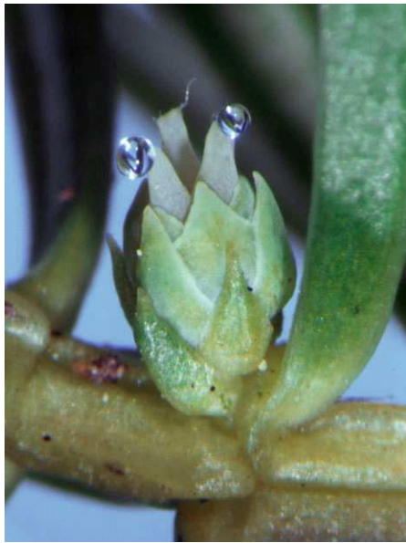
Abb. 19: Juniperus conferta (Küsten-Wacholder, Cupressaceae ), die Bestäubungstropfen werden durch eine schräge Öffnung der Samenanlage nach außen ausgerichtet, sodass die Tropfen nicht miteinander in Kontakt treten können (A. JAGEL).