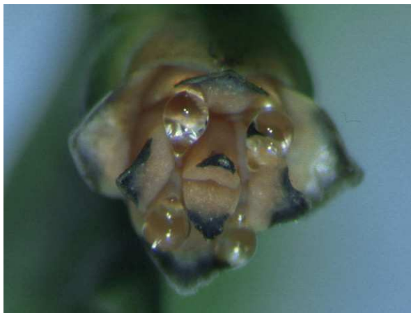
Abb. 11: Thuja occidentalis (Abendländischer Lebensbaum, Cupressaceae ), Zapfen mit Bestäubungstropfen.