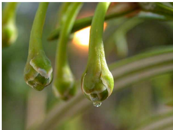
Abb. 15: Amentotaxus argotaenia ( Taxaceae ) Bestäubungstropfen (BG Bonn, A. JAGEL).

Entsprechende Bestäubungstropfen kommen (möglicherweise in etwas abgewandelter Funktionsweise) z. B. auch bei der Europäischen Eibe ( Taxus baccata ) und ihren Verwandten (Abb. 15 & 16, Taxaceae ) sowie bei den Kiefern ( Pinus spec. ) vor; bei Lärchen ( Larix spp. , Pinaceae ) und Araukarien ( Araucaria spp. , Araucariaceae ) allerdings fehlen sie.