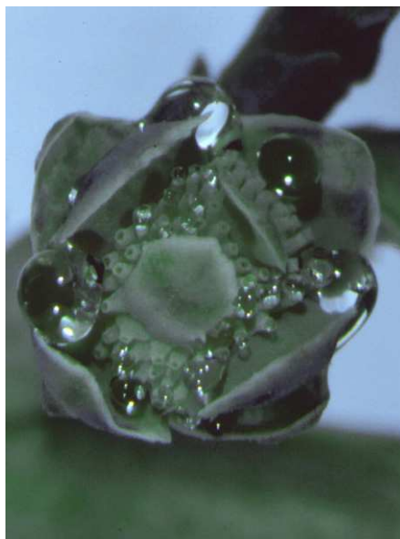
Abb. 18: Cupressus duclouxiana (Chinesische Zypresse, Cupressaceae ) aus China, Bestäubungstropfen fließen zu größeren zusammen.