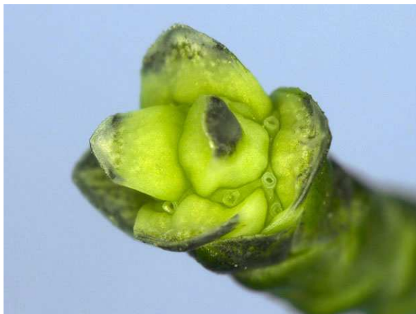
Abb. 1: Chamaecyparis lawsoniana (Lawsons Scheinzypresse, Cupressaceae ), Zapfen zur Blütezeit. Die Zapfenschuppen spreizen ab und geben die Samenanlage frei.

In vielen Fällen blühen Koniferen unauffällig. Ihre Blüten sind sparsam ausgestattet, vergleicht man sie mit denen der echten "Blütenpflanzen" (Angiospermen), also z. B. einer Rose oder einem Mohn. Es gibt bei den Koniferen keine Blütenblätter und es gibt auch keine Fruchtblätter: Die Samenanlagen stehen "nackt" in den Achseln oder auf der Fläche einer Zapfenschuppe, weswegen man die Koniferen zu der Gruppe der Nacktsamer (Gymnospermen) zählt. So braucht man bei vielen Koniferen einige Übung, die Blüten überhaupt zu finden. Bei den Zypressengewächsen ( Cupressaceae ) z. B. klappen an luftfeuchten, frostfreien Tagen einfach ein paar Schuppenblätter zur Seite und geben die Samenanlagen zur Bestäubung frei (Abb. 1 & 2). Zu diesem Zeitpunkt sind die Zapfen aufgrund ihrer geringen Größe als solche kaum zu erkennen. Manchmal haben die Zapfenschuppen zwar bereits jetzt eine andere Farbe als die Blätter. Nötig ist dies aber eigentlich nicht, denn die Koniferen werden nicht von Tieren bestäubt, sondern vom Wind.