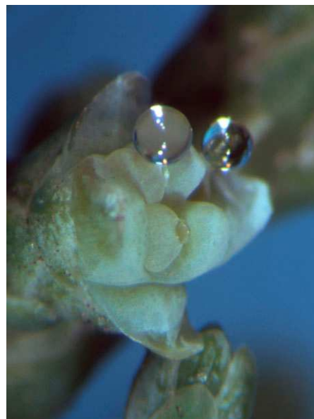
Abb. 14: Juniperus chinensis (Chinesischer Wacholder, Cupressaceae ), Zapfen mit Bestäubungstropfen (A. JAGEL).