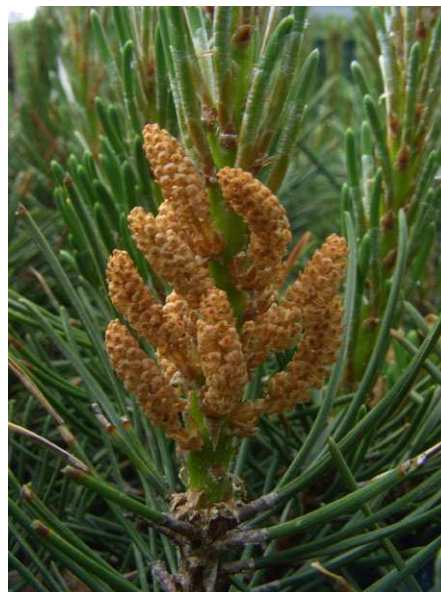
Abb. 8: Pinus mugo (Berg-Kiefer, Pinaceae ), männliche Blüten (A. JAGEL).

Die Blüten der Koniferen sind entweder einhäusig (monözisch) verteilt wie z. B. bei den Lärchen, dann existieren eingeschlechtliche weibliche und männliche Blüten auf einer Pflanze. Oder aber sie sind zweihäusig verteilt (diözisch), dann gibt es rein weibliche und rein männliche Pflanzen, wie das oft (aber nicht immer) bei unserem heimischen Gewöhnlichen Wacholder ( Juniperus communis ) der Fall ist. Zwitterige Blüten mit männlichen und weiblichen Anteilen, wie sie bei der Mehrzahl der Blütenpflanzen auftreten, gibt es bei den Koniferen nicht.