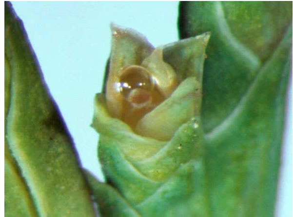
Abb. 10: Microbiota decussata (Sibirischer Zwerglebensbaum, Cupressaceae ), Bestäubungstropfen. Der Zapfen enthält nur eine Samenanlage.