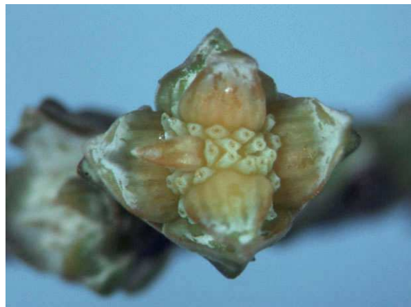
Abb. 2: Cupressus x leylandii (= x Cupressocyparis leylandii , Leyland-Zypresse, Cupressaceae ), Zapfen zur Blütezeit (A. JAGEL).

Auffälliger dagegen sind die meisten blühenden Zapfen der Kieferngewächse ( Pinaceae ), hier kann man schon aufgrund ihrer Größe, manchmal auch an der Farbe deutlich erkennen, dass sie blühen (Abb. 3 & 4). Die Blüten selbst sind hier aber nicht zu sehen. Sie stecken tief verborgen im Zapfen, der aus morphologischer Sicht einen Blütenstand darstellt.