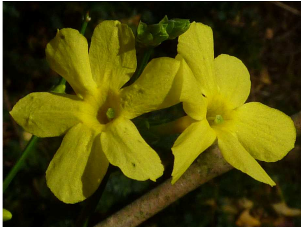
Abb. 6: Langgriffelige Blüte in Aufsicht, aus den Blütenröhren schaut nur die Narbe heraus, die Staubbeutel sind nicht zu erkennen.