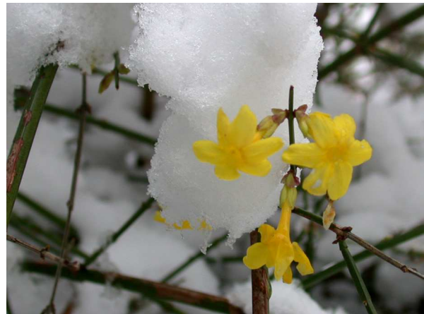
Abb. 2: Blüten im Schnee (30.01.2004,).