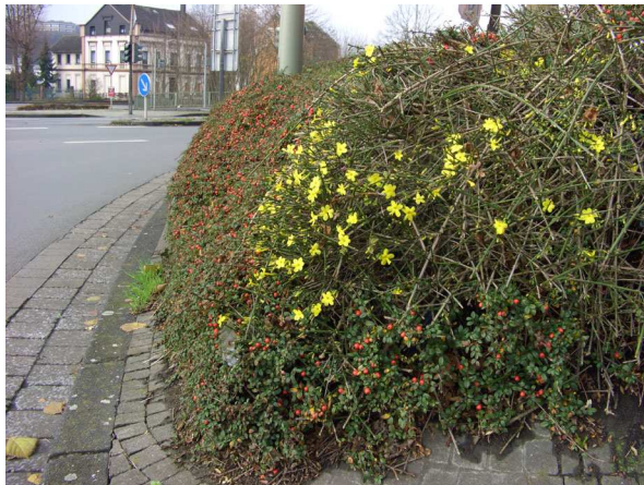
Abb. 1: Blühender Winter-Jasmin als Straßenbegleitgrün zwischen Cotoneaster in Wetter/Westfalen (23.11.2008,).

Winter-Jasmin ist die frosthärteste Art der überwiegend tropisch bis subtropisch verbreiteten Gattung. Allerdings erleiden die Blüten bei tiefen Temperaturen Frostschäden und bleichen aus (Abb. 3) und gelegentlich frieren auch die Triebe zurück. Aber irreversible Frostschäden kommen in unseren Breiten kaum vor, da sich die Sträucher gut regenerieren können.