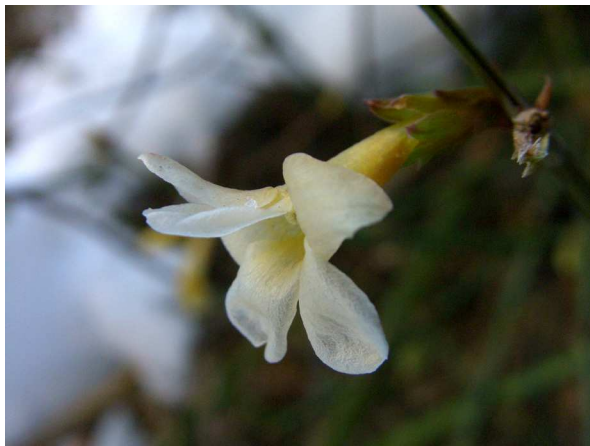
Abb. 3: Bei tiefen Frösten erleiden die Blüten Frostschäden und bleichen aus (10.01.2009,).