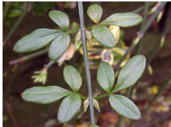
Abb. 4: Blätter (A. JAGEL).