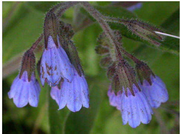
Abb. 4: Blüten von Symphytum caucasicum, bei Steckenborn, Städteregion Aachen/NRW (27.05.2009,).