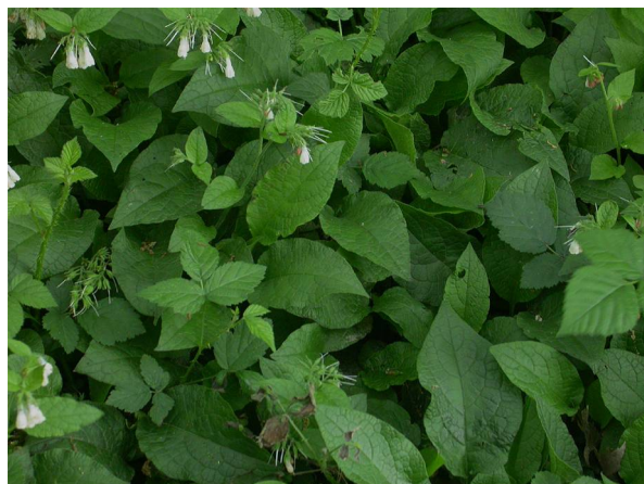
Abb. 7: Symphytum ×hidcotense, Teverener Heide, Kreis Heinsberg/NRW (21.05.2006,).