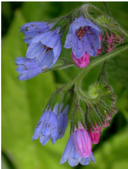
Abb. 5: Blüten von Symphytum caucasicum, bei Steckenborn, Städteregion Aachen/NRW (27.05.2009,).