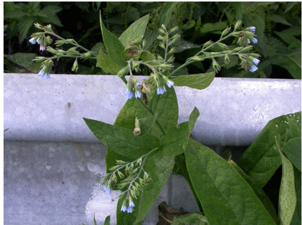
Abb. 2: Symphytum caucasicum, Aachen-Eilendorf/NRW (04.09.2008,).