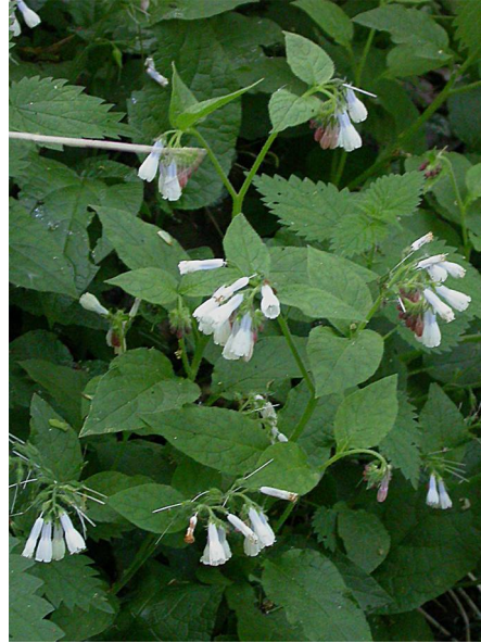
Abb. 9 & 10: Symphytum × hidcotense, Aachen-Laurensberg/NRW (02.05.2009,).