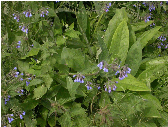
Abb. 3: Symphytum caucasicum an einem halboffenen Waldwegrand bei Steckenborn, Städteregion Aachen/NRW (27.05.2009,).