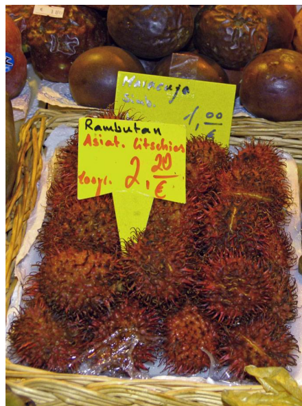
Abb. 2: Rambutan ( Nephelium lappaceum ) auf einem Markt in Frankfurt/Main (H. STEINECKE).