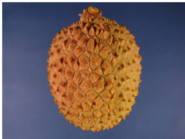
Abb. 5: Litschi ( Litchi chinensis ), reife Frucht (V. M. DÖRKEN).