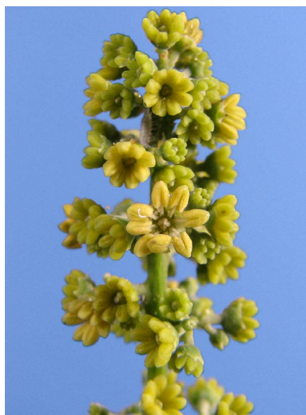
Abb. 4: Nephelium coriaceum , Blütenstand einer dem Rambutan nah verwandten Art (V. M. DÖRKEN).

Die Fruchtschale der Litschi ist aus kleinen fünf- bis sechseckigen Feldern zusammengesetzt (Abb. 5), bei Rambutan ist jedes dieser Felder mit einem langen, spitzen, borstigen Auswuchs versehen (Abb. 6). Darauf nimmt auch die volkstümliche Bezeichnung im Ursprungsland des Rambutans Bezug (rambut = Haar).