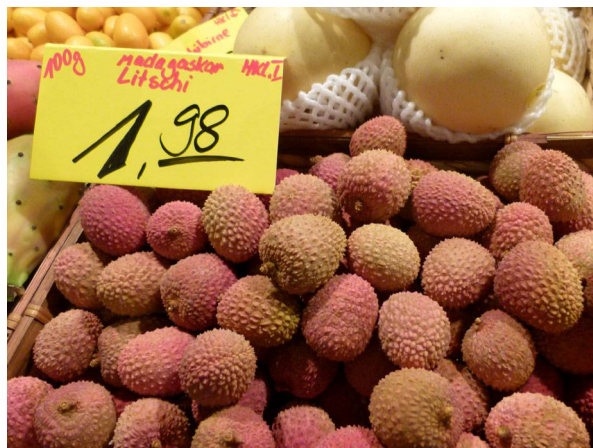
Abb. 1: Litschi ( Litchi chinensis ) auf einem Markt in Frankfurt/Main (H. STEINECKE).

In den letzten Jahren ist bei uns eine Zunahme von exotischen Früchten zu verzeichnen, die besonders in den Wintermonaten im deutschen Lebensmittelhandel angeboten werden (vgl. HETZEL & JAGEL 2011). Viele der exotischen Früchte sind bei uns zwar als Konservenobst schon lange erhältlich, konnten aber erst nach der Verbesserung von Transport- und Lagerungsbedingungen auch als Frischobst angeboten werden. So ist es noch gar nicht allzu lange her, dass es auch die Ananas ( Ananas comosus ) nur in Dosen bei uns zu kaufen gab. Unter den jüngeren Neuigkeiten stechen aus dem Obstsortiment vor allem Litschis ( Litchi chinensis , auch Lychee, Litschiplaume oder Chinesische Haselnuss genannt) und Rambutan ( Nephelium lappaceum , Falsche "Litschi") heraus (Abb. 1 & 2). Aufgrund ihrer eigentümlichen, fast schon künstlich anmutenden Oberflächen sind sie wohl die auffälligsten und ungewöhnlichsten Früchte, die die Frischobsttheken in den letzten Jahren erobert haben. Sie werden vor allem ab der Adventszeit bis in den Januar hinein und mittlerweile auch in den großen Lebensmitteldiscounter-Ketten angeboten. Litschi und Rambutan zählen in Ost-Asien zum beliebtesten Obst. Hier wird die Litschi sogar zu einer der feinsten Früchte der Welt gezählt.