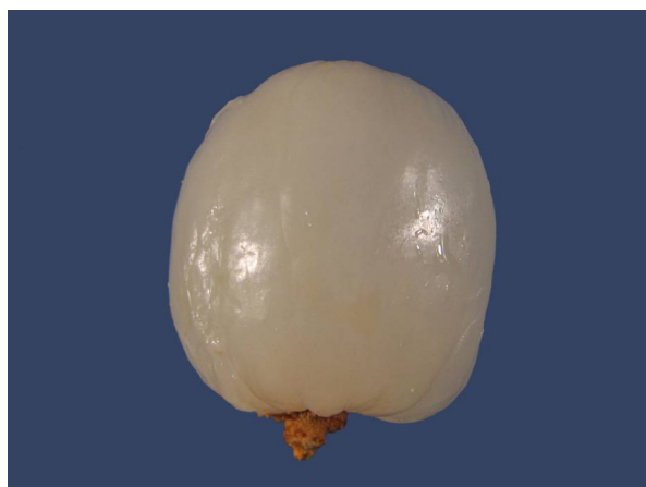
Abb. 7: Litschi ( Litchi chinensis ), gepellte Frucht (V. M. DÖRKEN).

Die Früchte von Litschi und Rambutan sind aufgrund ihres Aufbaus für den Botaniker interessant. Es handelt sich nämlich um einsamige Nüsse, auch wenn sie oberflächlich nicht nach Nüssen aussehen. Ihre gesamte Fruchtwand ("Schale") ist aber, wie für Nüsse typisch, trocken und holzig bzw. ledrig. Das, was man als "Fruchtfleisch" isst und zwischen der Schale und dem großen braunen, länglichen Samen als weiße, fleischige, süßlich schmeckende Schicht ausgebildet ist, ist keine Bildung der Fruchtwand, wie das bei Beeren oder Steinfrüchten der Fall wäre. Es ist aber auch keine fleischig gewordene Samenschale, sondern ein Auswuchs des Samenträgers, an dem der Samen sitzt (Funiculus). Eine solche Struktur nennt man Arillus, sie entspricht dem, was man auch von unseren heimischen Eiben als roten Samenmantel her kennt.