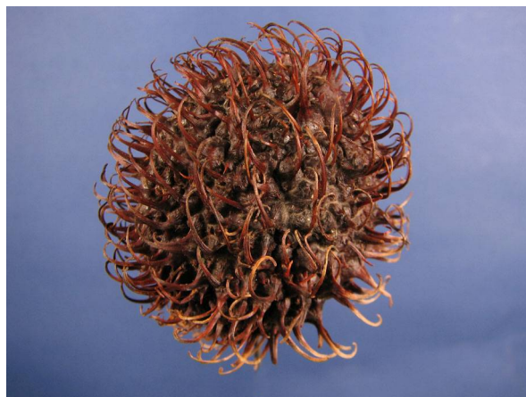
Abb. 6: Rambutan ( Nephelium lappaceum ).

Der Fruchtknoten baut sich aus zwei Fruchtblättern auf, die jeweils nur eine Samenanlage enthalten. Normalerweise entwickelt sich nur ein Fruchtblatt weiter zur Frucht, selten aber auch beide Fruchtblätter. Dann entstehen sog. Zwillingspflaumen, welche bei Litschi in O-Asien als Glückssymbol betrachtet werden (LIEBEREI & REISDORFF 2007).