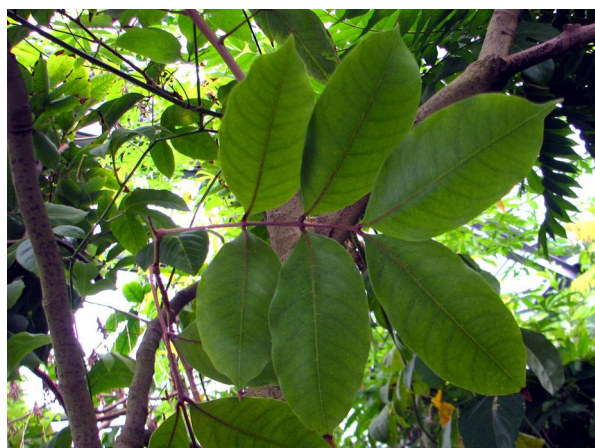
Abb. 3: Litschi ( Litchi chinensis ), Blätter (V. M. DÖRKEN).

Bei beiden Arten handelt es sich um kleine immergrüne Bäume mit wechselständig stehenden, gefiederten Blättern (Abb. 3). Die kleinen Blüten stehen in reichblütigen Blütenständen (Abb. 4). Bei Litschi gibt es auf ein und derselben Pflanze drei verschiedenen Blütentypen: männliche, weibliche und zwittrige (die letzteren sind aber funktionell ebenfalls weiblich, die Staubblätter sind hier nicht funktionstüchtig). Bei Rambutan sind sie sogar auf verschiedene Pflanzen verteilt, sodass es weibliche und männliche Pflanzen gibt (diözisch).