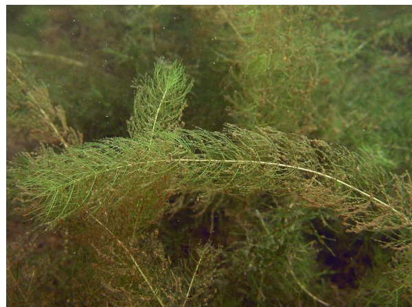
Abb. 4: Myriophyllum alterniflorum (Wechselblütiges Tausendblatt) mit quirlständigen Blättern (Heidesee in Nettetal, 2009).