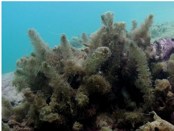
Abb. 5: Myriophyllum alterniflorum (Wechselblütiges Tausendblatt) (Heideseesee in Nettetal, 2009).