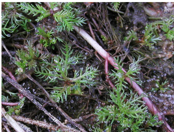
Abb. 3: Myriophyllum alterniflorum (Wechselblütiges Tausendblatt), Landform (Wolfssee in Duisburg, 2003).

Die Blätter von Myriophyllum alterniflorum stehen in meist vierzähligen Quirlen, sind oft aber auch wechselständig angeordnet. Sie bestehen aus 8-18-fädigen Fiedern (Abb. 4 & 6). Durch diese starke Zerteilung der Blätter kommt die Gattung zu ihrem Namen "Tausendblatt", was der fast wörtlichen Übersetzung des aus dem Griechischen stammendem Myriophyllum = "unzählige Blätter" entspricht. Myriophyllum alterniflorum bildet selten auch Landformen aus (Abb. 3).