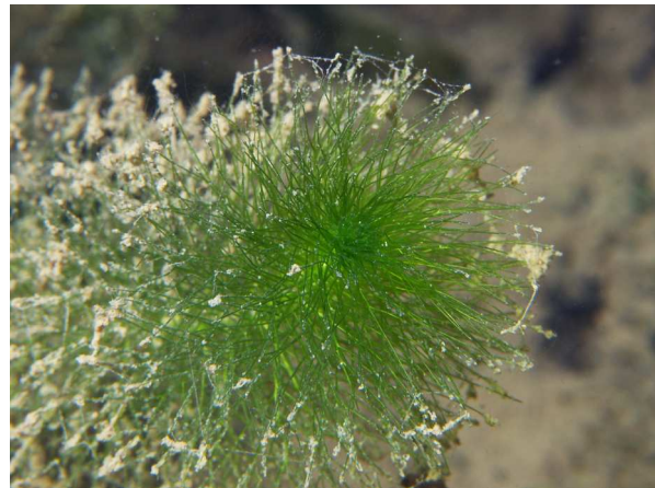
Abb. 6: Myriophyllum alterniflorum (Wechselblütiges Tausendblatt), Blätter (Heideseesee in Nettetal, 2012, K. VAN DE WEYER).

Die Blütezeit liegt im Hochsommer, wobei die Art bei uns nur selten überhaupt blüht. Die Blüten sind überwiegend eingeschlechtlich und einhäusig (monözisch) verteilt, gelegentlich werden allerdings auch zwittrige Blüten beobachtet (HEGI 1966). Die Blüten sind nur 1,5-2 mm lang und besitzen acht Staubblätter, bzw. 4 hellrote Narben (Abb. 7). Die Blüten sitzen an Blütenständen, die mehrere Zentimeter aus dem Wasser herausragen. Im Blütenstand stehen die weiblichen Blüten unten, die männlichen oben. Sie sind meist wechselständig angeordnet, worauf sich der Artname " alterniflorum " (= wechselblütig) bezieht. Bei anderen Myriophyllum -Arten sind alle Blüten gegenständig. Bestäubt werden die Blüten durch Wind. Nach der Befruchtung entstehen ca. 1,5-2 mm × 2 mm große Spaltfrüchte mit vier Kammern. Ihre Ausbreitung erfolgt durch Verdriftung im Wasser. Im Gegensatz zu den beiden anderen einheimischen Myriophyllum -Arten breitet sich M. alterniflorum vorwiegend vegetativ aus (DÜLL & KUTZELNIGG 2011).