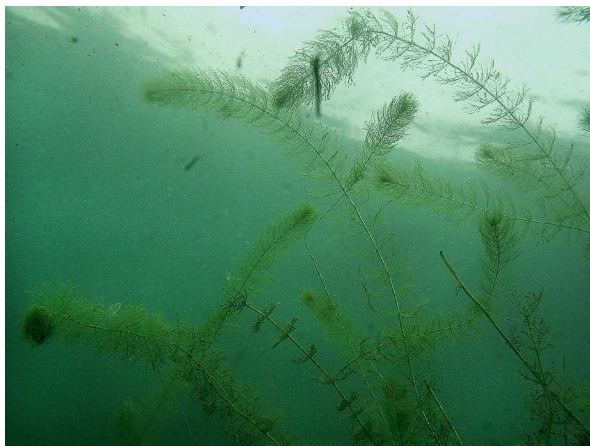
Abb. 1: Myriophyllum alterniflorum (Wechselblütiges Tausendblatt) im Wolfssee in Duisburg (2003, K. VAN DE WEYER).

Bei der Wasserpflanze des Jahres ist es in diesem Jahr sogar zu einer Doppelbenennung gekommen: Während der Verband Deutscher Sporttaucher ( www.vdst.de , www.wasserpflanze-des-jahres.org ), der diese Kategorie auch in den letzten Jahren kürte, das Wechselblütige Tausendblatt wählte, wurde vom Förderkreis Sporttauchen kommuniziert, dass es sich beim Igelschlauch ( Baldellia ranunculoides ) um die Art des Jahres in der Kategorie Wasserpflanzen handele. Nun ist die Verwirrung groß. Nachdem Baldellia ranunculoides beim Bochumer Botanischen Verein bereits durch ein Porträt von GAUSMANN (2014) vorgestellt wurde, erfolgt nun der Vollständigkeit halber eine entsprechende Ausführung zu Myriophyllum alterniflorum .