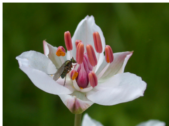
Abb. 7: Butomus umbellatus, Blüte mit Fliege (01.07.2003,).