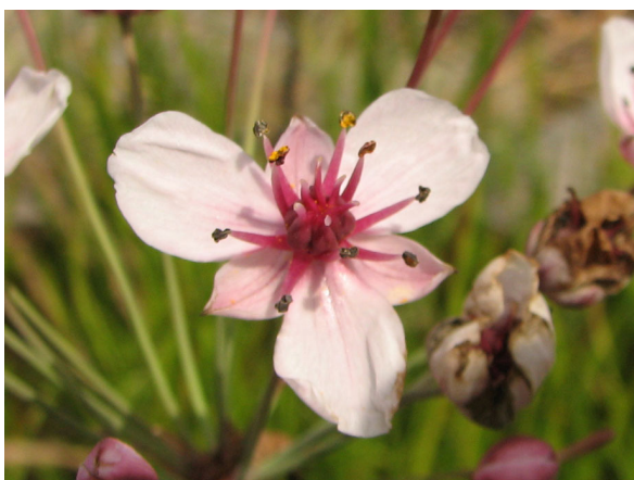
Abb. 6: Butomus umbellatus, Blüte in Nahaufnahme (05.07.2010,).

Im Sommer erscheinen hellrosa, radiärsymmetrische Blüten (Abb. 6) mit dunkleren, strichförmigen Saftmalen, die in schirmförmigen (doldigen) Blütenständen stehen (Abb. 1). Sie duften nach Honig und werden von Fliegen (Abb. 7), Bienen und Hummeln bestäubt, die von den nektarreichen Scheibenblüten angelockt werden.