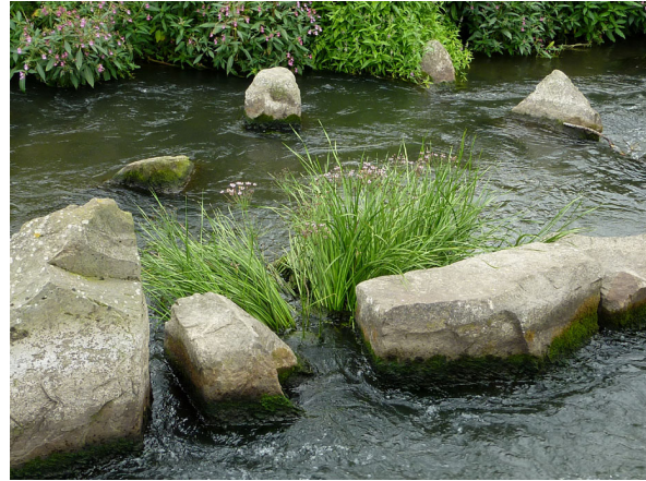
Abb. 4: Butomus umbellatus im Uferbereich der Ruhr (Bochum-Dahlhausen, 01.10.2010,).

Ist ein Standort weniger gut geeignet, kommt die Schwanenblume als Einzelpflanze oder mit wenigen Individuen in der amphibischen Gewässerzone vor. So siedelt die Art auch am Ufer von Fließgewässern wie der Ruhr (Abb. 4). Diese besitzt als Mittelgebirgsfluss naturgemäß keine so weitläufige Aue mit flachen Stillgewässern wie der Rhein und ist zudem im Ruhrgebiet noch stärker durch Uferverbau und Regulierung des jährlichen Überflutungsregimes betroffen. Butomus umbellatus wächst hier u. a. auf Bühnen oder lockeren Steinschüttungen, die daher ebenfalls als Ersatzlebensraum betrachtet werden können.