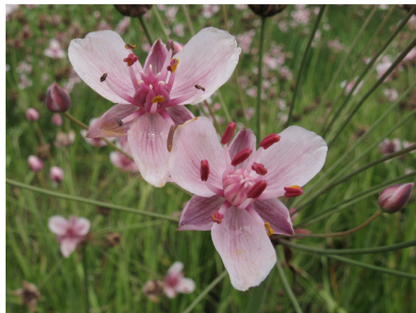
Abb. 2: Butomus umbellatus, Blüten (Duisburg-Homberg, 25.08.2013,).