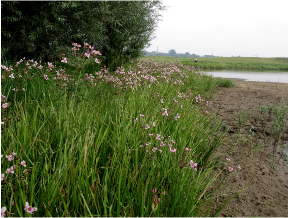
Abb. 3: Butomus umbellatus als Röhrichtbildner an einem Abgrabungsgewässer am Rhein (Duisburg-Homburg, 25.08.2013,).