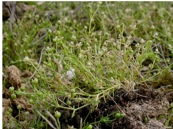
Abb. 16: Sagina procumbens – Niederliegendes Mastkraut (bei Vaals/Südlimburg, Niederlande, 25.06.2014,).