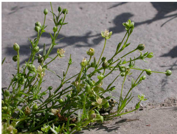
Abb. 17: Sagina procumbens – Niederliegendes Mastkraut (Westfriedhof, Aachen/NRW, 23.06.2014,).