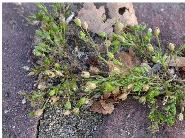
Abb. 4: Sagina apetala – Kronblattloses Mastkraut (Aachen-Hörn/NRW, 23.06.2014,).