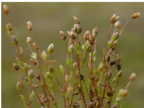
Abb. 13: Sagina micropetala s. l. – Aufrechtes Mastkraut i. w. S., ab und zu findet man reife Früchte mit anliegenden Kelchblättern (Lissingen-Birresborn, Landkreis Daun/RLP, 24.08.2014,).