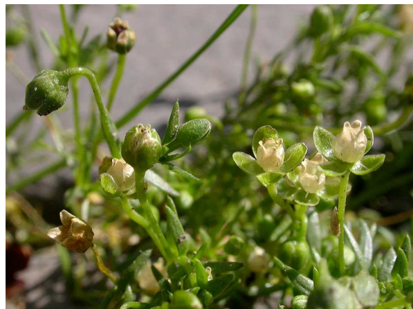
Abb. 18: Sagina procumbens – Niederliegendes Mastkraut (Westfriedhof, Aachen/NRW, 23.06.2014,).