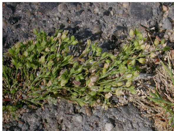
Abb. 3: Sagina apetala – Kronblattloses Mastkraut (bei Aachen-Richterich/NRW, 18.06.2014,).