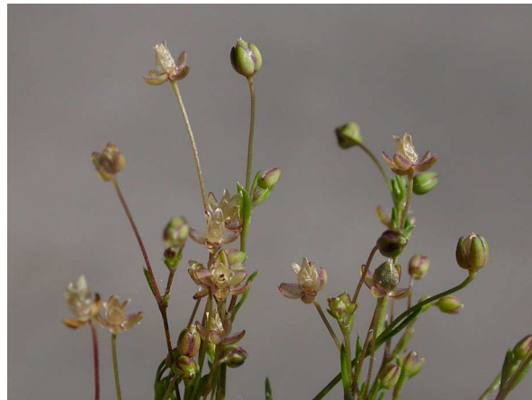
Abb. 12: Sagina micropetala s. str. – Aufrechtes Mastkraut i. e. S. (Westfriedhof, Aachen/NRW, 24.05.2011,).