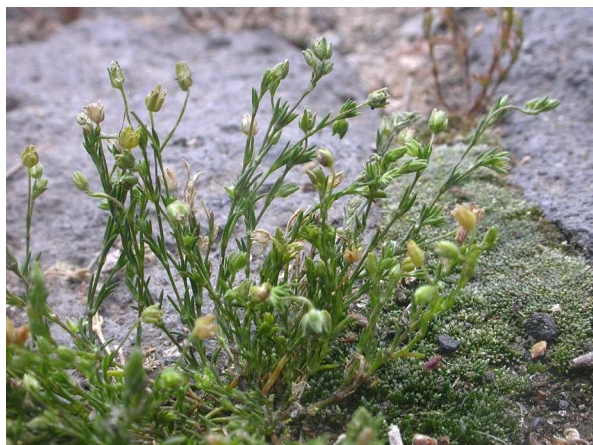
Abb. 2: Sagina apetala – Kronblattloses Mastkraut (bei Burg Elz/RLP, 21.05.2011,).