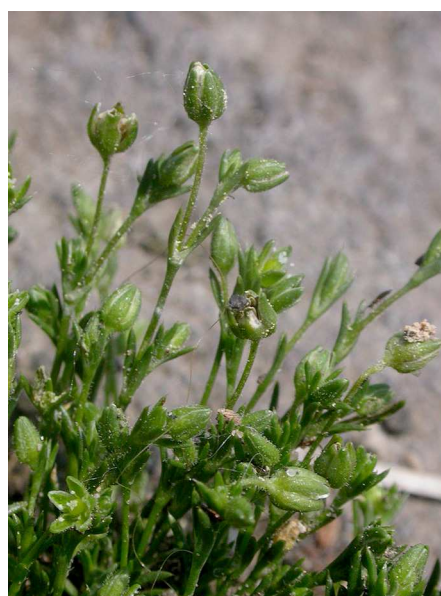
Abb. 7: Sagina apetala – Kronblattloses Mastkraut (bei Burg Elz/RLP, 21.05.2011,).