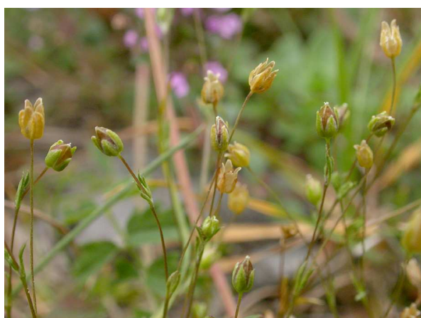
Abb. 6: Sagina apetala – Kronblattloses Mastkraut (Wahner Heide, Rhein-Sieg-Kreis/NRW, 13.07.2013,).