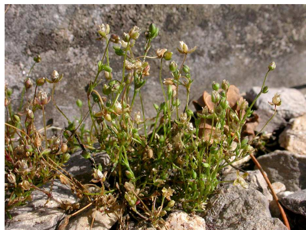
Abb. 10: Sagina micropetala s. str. – Aufrechtes Mastkraut i. e. S. (Westfriedhof, Aachen/NRW, 23.06.2014,).