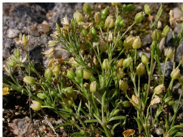
Abb. 5: Sagina apetala – Kronblattloses Mastkraut (bei Aachen-Richterich/NRW, 18.06.2014,).