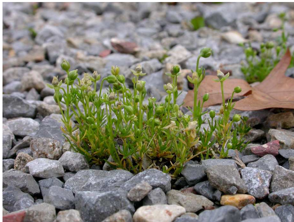
Abb. 15: Sagina procumbens – Niederliegendes Mastkraut (Friedhof Aachen-Horbach/NRW, 22.07.2014,).