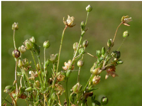
Abb. 11: Sagina micropetala s. str. – Aufrechtes Mastkraut i. e. S. (Westfriedhof, Aachen/NRW, 23.06.2014,).