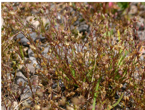
Abb. 9: Sagina micropetala s. str. – Aufrechtes Mastkraut i. e. S. (Friedhof Hüls, Aachen/NRW, 21.06.2014,).