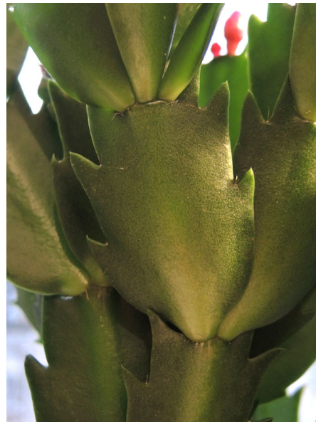
Abb. 6: Weihnachtskaktus ( Schlumbergera ), Sprossglieder (T. KASIELKE).