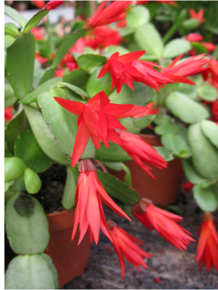
Abb. 4: Osterkaktus ( Hattiora ) mit roten Blüten (A. JAGEL).

Weihnachtskakteen sind dornenlos und haben abgeflachte, mehr oder weniger stark gezähnte Sprossglieder (Abb. 6). Das, was also so aussieht wie Blätter, sind morphologisch gesehen abgeflachte Sprosse (Platykladien). Sie entsprechen dem, was bei den Opuntien Ohren genannt wird, und ersetzen die Funktion der Blätter (Photosynthese), die im Laufe der Evolution beim Weihnachtskaktus reduziert worden sind.