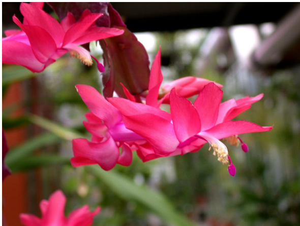
Abb. 5: Weihnachtskaktus ( Schlumbergera ), zygomorphe Blüte (A. HÖGEMEIER).

Weihnachtskakteen sind dornenlos und haben abgeflachte, mehr oder weniger stark gezähnte Sprossglieder (Abb. 6). Das, was also so aussieht wie Blätter, sind morphologisch gesehen abgeflachte Sprosse (Platykladien). Sie entsprechen dem, was bei den Opuntien Ohren genannt wird, und ersetzen die Funktion der Blätter (Photosynthese), die im Laufe der Evolution beim Weihnachtskaktus reduziert worden sind.