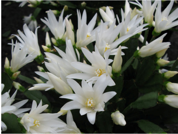
Abb. 3: Osterkaktus ( Hattiora ) mit weißen, radiären Blüten (A. JAGEL).