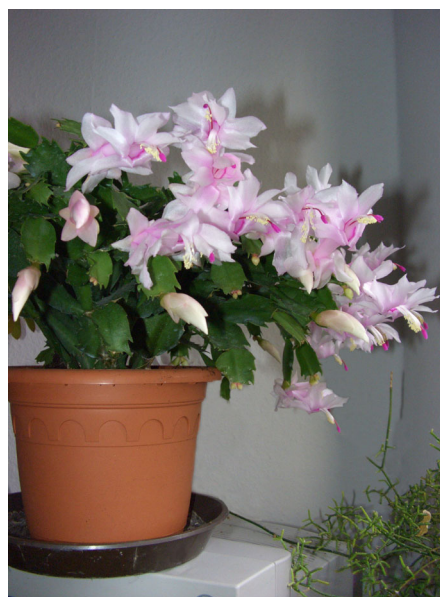
Abb. 2: Weihnachtskaktus mit blassrosa Blüten (A. JAGEL).