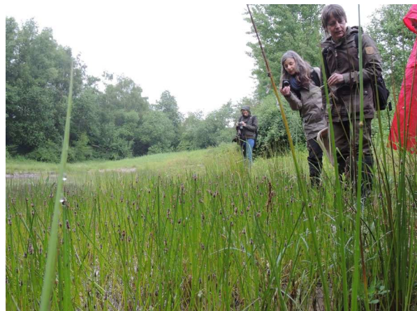
Abb. 2: Kleinhöhricht am Teich.