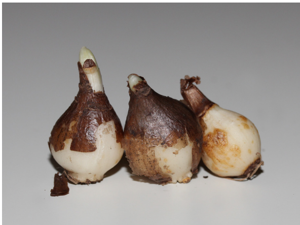
Abb. 3: Galanthus nivalis , Zwiebeln (C. BUCH).

Schneeglöckchen gehören zu den Zwiebelgeophyten. Ohne dass man oberirdisch etwas davon sieht, überdauern die Pflanzen den Sommer und Herbst als Zwiebel (Abb. 3) in der Erde, die dabei vollgepackt sind mit Speicherstoffen (Abb. 4). Dies hat den Vorteil, dass sie schon zeitig im Winter austreiben kann.