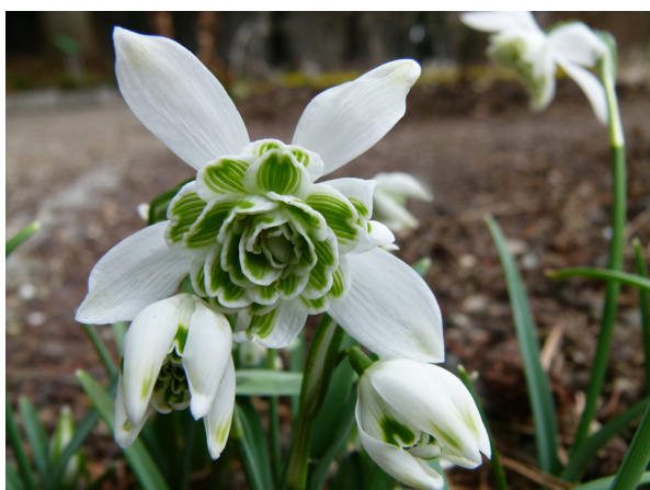
Abb. 13: Galanthus nivalis 'Flore Pleno', Sorte mit gefüllter Blüte (Frankfurt, 04.03.2009,).