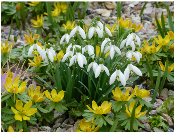
Abb. 1: Galanthus nivalis, zusammen mit Eranthis hyemalis verwildert im Palmengarten Frankfurt (04.03.2012,).