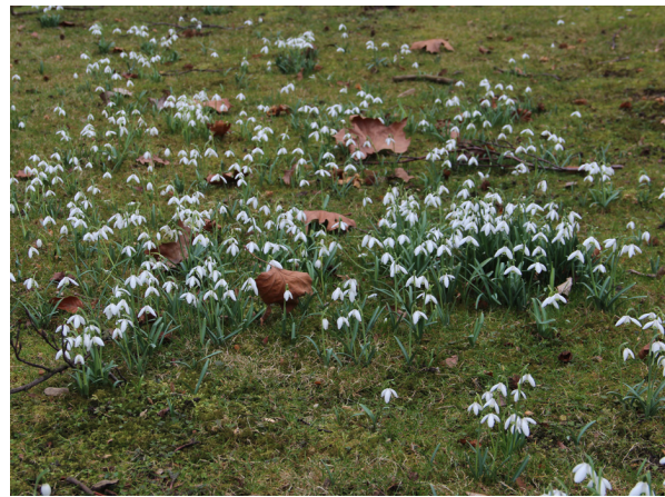
Abb. 2: Galanthus nivalis, verwildert im Bochumer Stadtpark (26.02.2017,).

Aufgrund der frühen Blütezeit und der hübschen Blüte gehört Galanthus nivalis zu den bekanntesten Arten unserer Flora und ist als Zierpflanze in Gärten und Parks äußerst beliebt. Hiervon zeugen auch die zahlreichen Verwildierungen im Siedlungsraum. Weniger bekannt sind zwei verwandte Arten, G. elwesii und G. woronowii , die ebenfalls als Kulturflüchter auftreten.