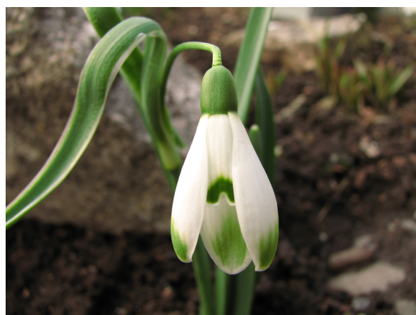
Abb. 14: Galanthus nivalis 'Scharlockii Big Ears' (Bochum, 01.03.2011,).

Das Kleine Schneeglöckchen nimmt selbst bei sehr tiefen Frösten normalerweise keinen Schaden. Erst lang andauernde Fröste, besonders bei gleichzeitigem Sonnenschein, können zu Wassermangel führen, der über die Wurzeln im gefrorenen Boden nicht ausgeglichen werden kann (Frosttrocknis). Dann sinken die Blätter und Blütenstiele schlaff zu Boden, da der Turgordruck in den Zellen nicht aufrechterhalten werden kann (Abb. 11). Dauert der Frost nicht zu lange, richten sich die Pflanzen aber ohne Schaden zu nehmen wieder auf. Selbst die