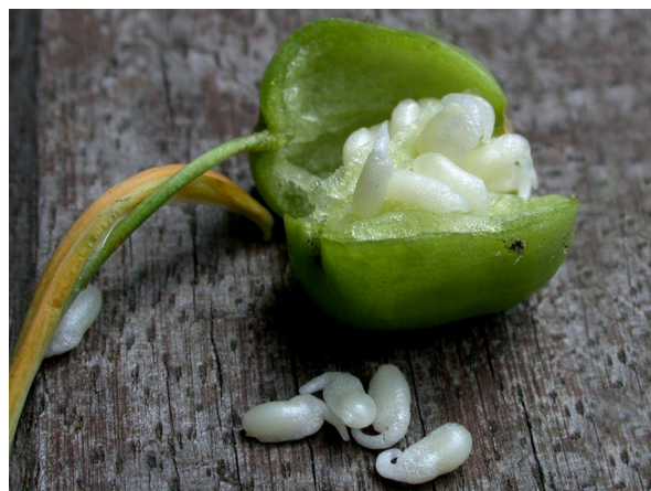
Abb. 10: Galanthus nivalis, geöffnete, unreife Frucht und Samen mit Elaiosom (Witten, 12.05.2003,).