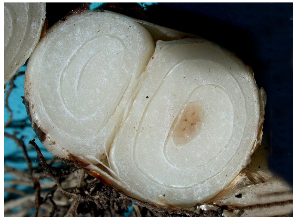
Abb. 4: Galanthus nivalis, Querschnitt durch eine Zwiebel mit Tochterzwiebel (04.04.2009,).