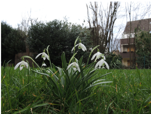
Abb. 15: Galanthus nivalis, in einem Vorgartenrasen in Bochum-Ehrenfeld (04.03.2016,).