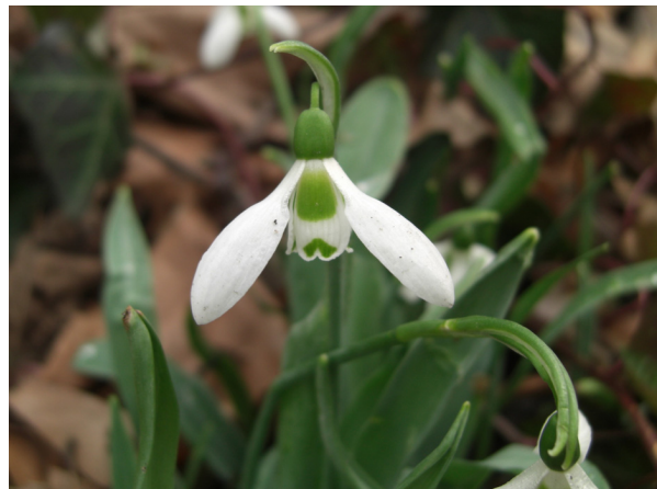
Abb. 18: Galanthus elwesii, Blüte (Essen, 28.02.2009,).