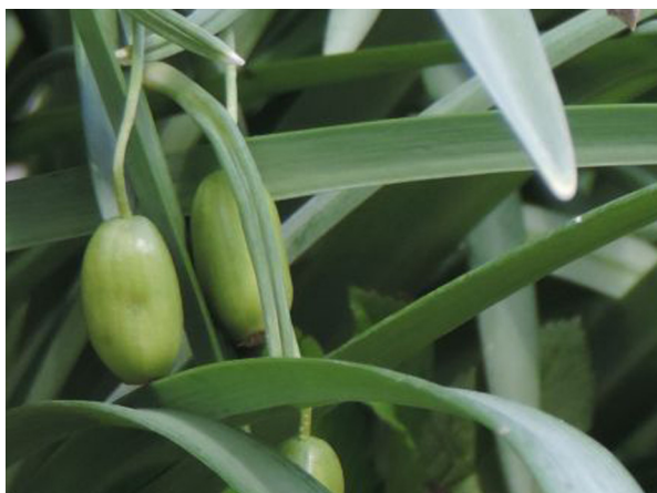
Abb. 9: Galanthus nivalis, Früchte (Ratingen, 09.04.2016,).