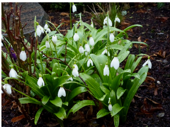
Abb. 25: Galanthus woronowii, blühende Gruppe (Bochum, 16.03.2016,).