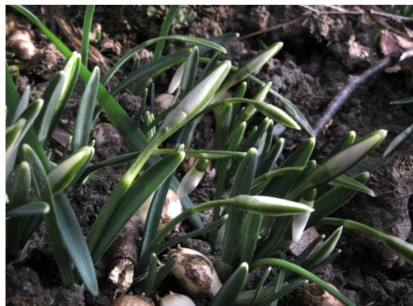
Abb. 6: Galanthus nivalis, austreibende Blätter und Blüten (Bochum, 03.02.2012,).