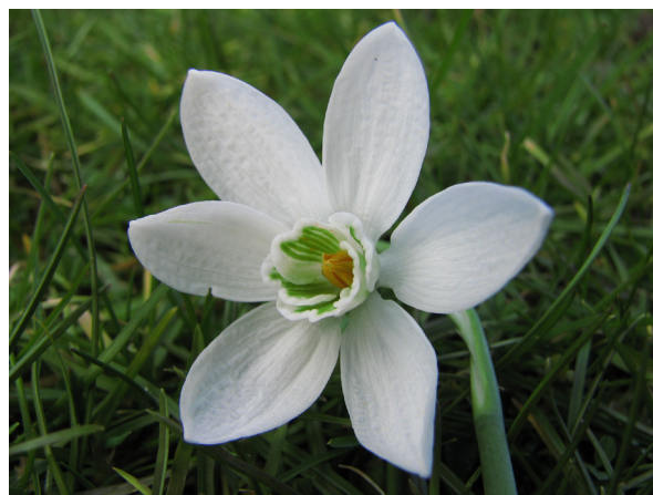
Abb. 24: Galanthus elwesii 'Godfrey Owen', Blüte von unten (27.02.2010,).