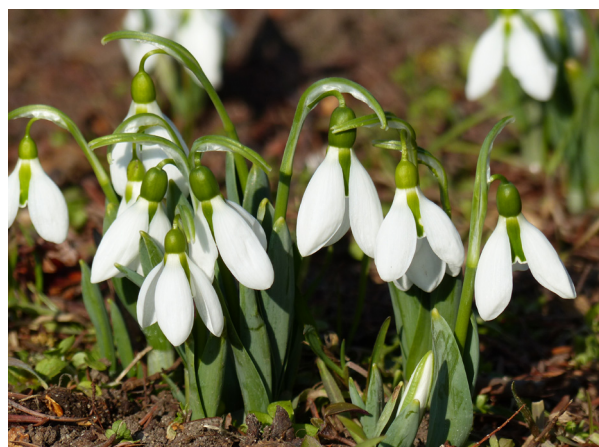
Abb. 20: Galanthus elwesii, blühend (Palmengarten Frankfurt, 15.02.2017,).