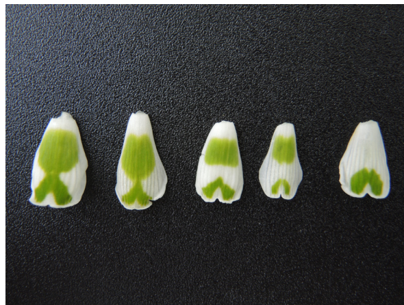
Abb. 22: Galanthus elwesii, Variation der Zeichnungen auf den inneren Blütenblättern (28.02.2016,).