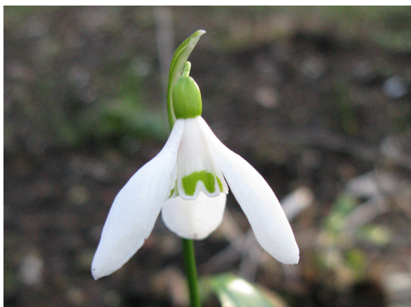
Abb. 27: Galanthus woronowii, Blüte (Bochum, 15.02.2011,).