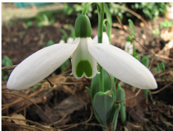
Abb. 23: Galanthus elwesii 'Comet', Blüte (Bochum, 24.02.2017,).