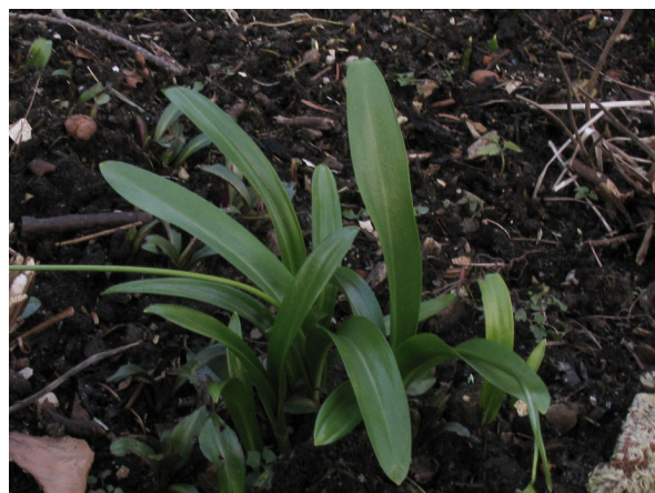
Abb. 26: Galanthus woronowii, Blätter (Bochum, 01.03.2011,).