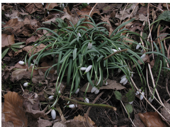
Abb. 11: Galanthus nivalis, nach lang andauerndem Bodenfrost (Bochum, 23.02.2011,).