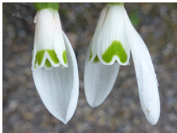
Abb. 28: Galanthus woronowii, Zeichnung der Innenkrone im Vergleich zu G. nivalis (rechts) (Bochum, 06.03.2016,).

Es hat ebenfalls breitere Blätter als G. nivalis , doch sind diese hell- bis dunkelgrün, aber nicht blaugrün gefärbt, und glänzen (Abb. 25 & 26). Die äußeren Perigonblätter sind ähnlich schlank wie die von G. nivalis . Auch hier ist die Zeichnung der inneren Perigonblätter ein wichtiges Bestimmungsmerkmal: Diese weisen an der Spitze zwei kleine, meist voneinander getrennte grüne Flecken auf, die nicht V-förmig zusammenlaufen, sondern wie mit dem Lineal gerade angeschnitten wirken (Abb. 27 & 28).