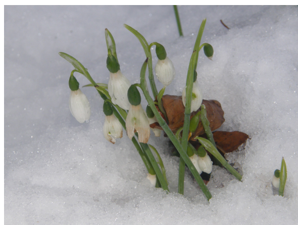
Abb. 12: Galanthus nivalis, im Schnee mit Frostschaden an den Blüten (Frankfurt/Main, 22.012.2009,).