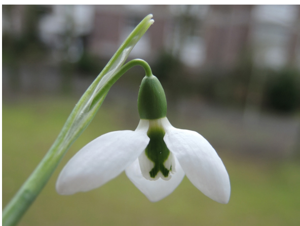
Abb. 19: Galanthus elwesii, Blüte (Bielefeld, 07.02.2016,).