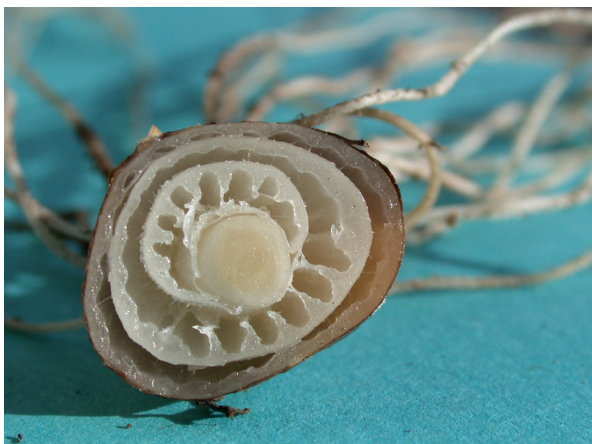
Abb. 5: Galanthus nivalis, Querschnitt durch eine Zwiebel nach dem Austrieb (Witten, 04.04.2009,).