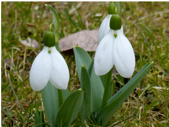
Abb. 17: Galanthus elwesii, Blüten (Palmengarten Frankfurt, 19.02.2017,).