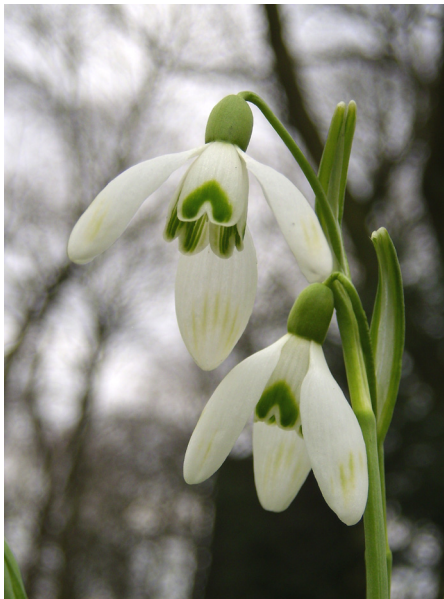
Abb. 7: Galanthus nivalis, Blüten mit typischer, V-förmiger Zeichnung (Mülheim, 20.03.2009,).

Das Kleine Schneeglöckchen besitzt zwei grundständige Blätter, die an der Basis von einer Blattscheide umhüllt sind. Sie sind blaugrün gefärbt, wachsbereift und schmal linealisch (Abb. 6). Die Blütenknospen sind zunächst von einer verwachsenen, häutigen Hochblattscheide umgeben und stehen aufrecht (Abb. 6). Erst kurz vor der Blütezeit beginnen sie zu nicken. Die Blüten stehen einzeln und sind aus inneren und äußeren Perigonblättern zusammengesetzt, wobei die inneren zu einer kurzen Röhre verwachsen sind. Sie weisen charakteristische grüne V-förmige Duftmale auf, die dem Bestäuber zur Orientierung dienen und dem Botaniker zur Bestimmung.