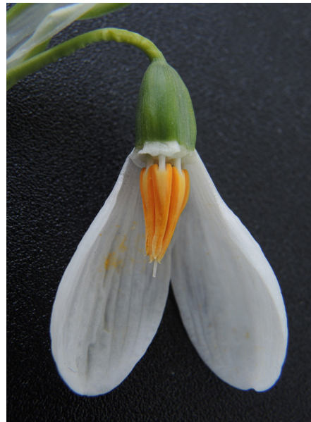
Abb. 8: Galanthus nivalis, Blüte, ein Großteil der Blütenblätter entfernt. Die orangefarbenen Staubbeutel bilden einen Streukegel, der Griffel ragt daraus hervor (Bochum, 28.02.2016,).