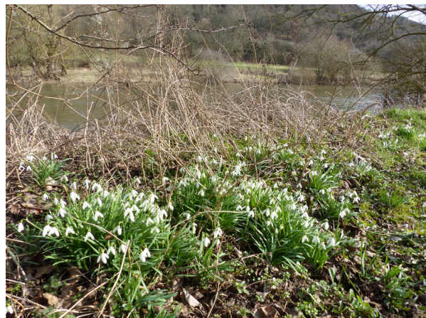
Abb. 16: Galanthus nivalis in der Nahe-Aue bei Bad Münster am Stein (12.03.2017,).