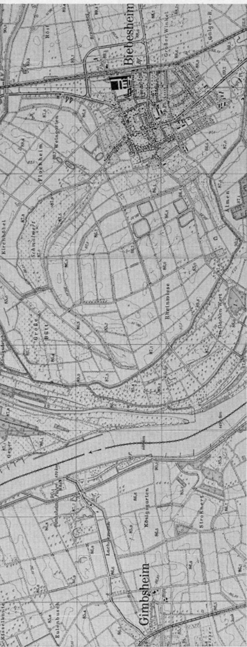
Karte 1. Verkleinerter Ausschnitt aus den Topographischen Karten 6116 (Oppenheim) und 6216 (Gernsheim); Maßstab ca. 1:43500