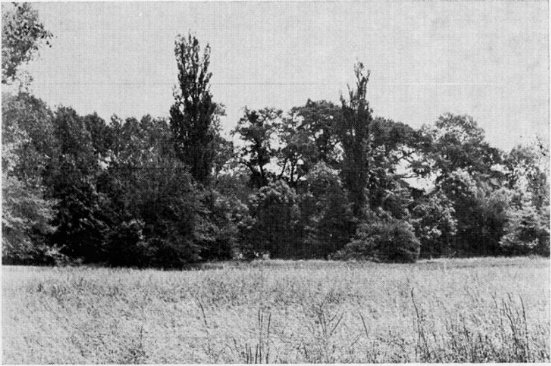
Abb. 1. „Eiswasser“