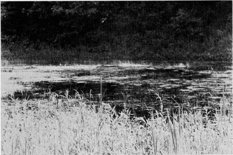
Abb. 2. Temporäres Gewässer am Kälberteicher Hof.