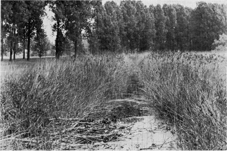
Abb. 3. Schilfbestände „Neue Anlage“.