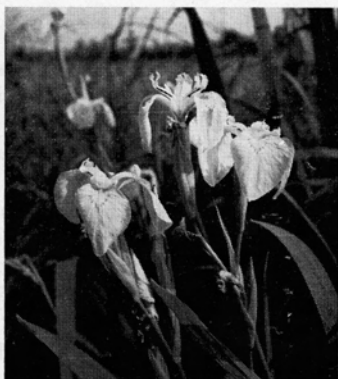
Abb. 3. Wasser-Schwertlilie ( Iris pseudacorus ), im gleichen Stock zwischen 2 engröhrligen Blüten eine weitröhrlige Blüte; \frac{1}{4} nat. Gr. — Wümmе bei Fischerhude, 21. Juni 1970.

Abb. 2. Wasser-Schwertlilie ( Iris pseudacorus ), im gleichen Stock links mehrere engröhrlige Blüten, rechts eine weitröhrlige Blüte; in der Blüte am weitesten links eine durch ? Hummelbesuch aufgebrochene Teilblüte; \frac{1}{3} nat. Gr. — Aufn. Verf., Mühlenfließ bei Friedland (Alle), 10. Juni 1938.