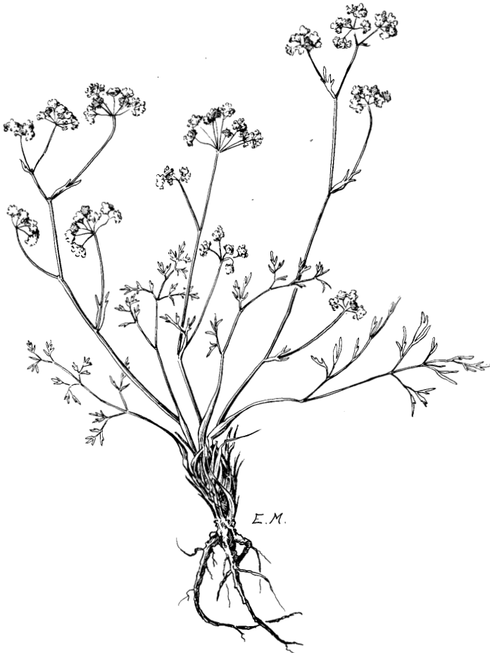
Abb. 4. Seegrüner Faserschirm ( Trinia glauca ). Zeichnung von E. MICHELS.

Die Buchenzeit zeigt das Ende der größeren Klimaveränderungen an. Mit ihr beginnt die Nachwärmezeit, die bis zum heutigen Tage andauert. Die Buche ist verhältnismäßig empfindlich gegen strenge Winter und heiße Sommer. Sie braucht viel Feuchtigkeit, nicht so sehr große Niederschlagsmengen als vielmehr eine hohe Luftfeuchtigkeit. Im Buchenwald wachsen Pflanzen, die meist im Mittelmeergebiet heimisch sind und dort in höheren Gebirgslagen wachsen. Sie haben eine gewisse Kälteresistenz, müssen aber im Frühjahr genügend Feuchtigkeit erhalten, um sehr früh, noch vor dem Austreiben der Bäume, blühen zu können. Zu ihnen gehören: