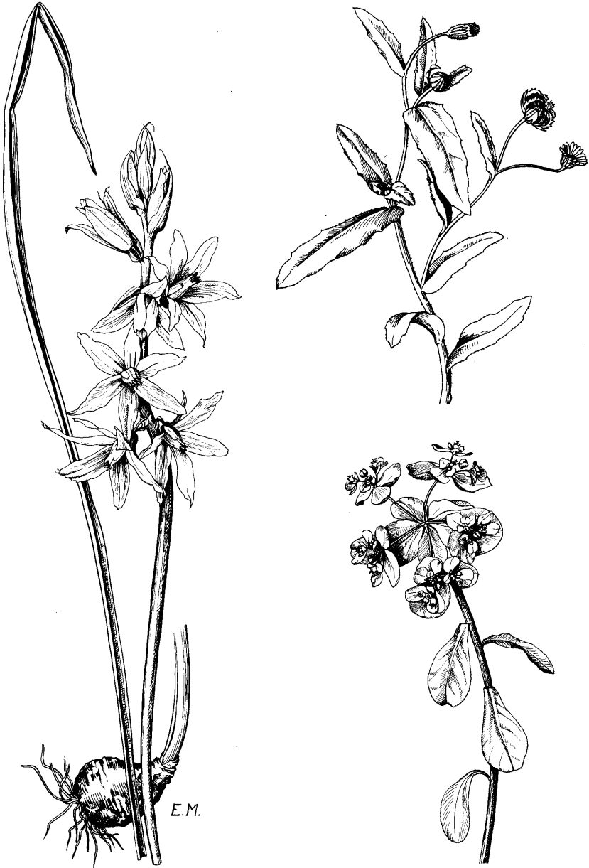
Abb. 5. Links: Nickender Milchstern ( Ornithogalum nutans ). Rechts oben: Acker-Ringelblume ( Calendula arvensis ). Rechts unten: Sonnen-Wolfsmilch ( Euphorbia helioscopia ). Zeichnungen von E. MICHELS (aus GROSSMANN 1976).