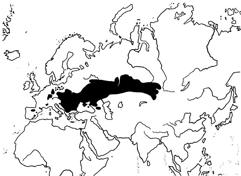
Karte 1. Areal des Frühlings-Adonisröschens ( Adonis vernalis ). Aus MEUSEL, JÄGER & WEINERT 1965 (umgezeichnet).