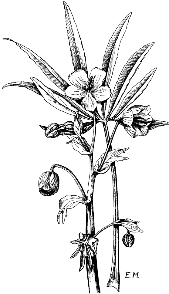
Abb. 3. Stinkende Nieswurz ( Helleborus foetidus ). Zeichnung von E. MICHELS (aus GROSSMANN 1976).

warmen Sommern und milden Wintern. Sie gedeihen auf neutralen bis sauren, nährstoffarmen Böden und vertragen Beschattung. Durch größere Niederschlagsmengen sind die Nährstoffe des Bodens weitgehend ausgewaschen. Manche dieser Arten haben in unserem Gebiet ihre Ostgrenze (z. B. Mibora minima ) oder reichen nur mit wenigen „Vorposten“ weiter nach Osten (z. B. Helleborus foetidus ).