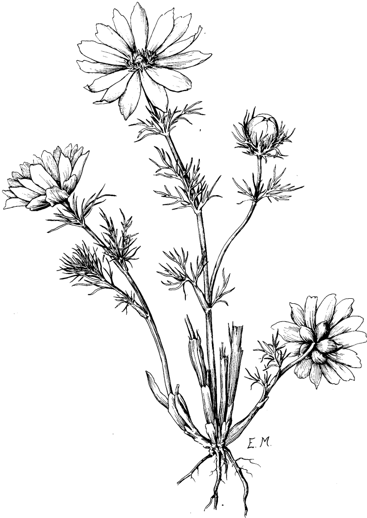
Abb. 2. Frühlings-Adonisröschen ( Adonis vernalis ). Zeichnung von E. MICHELS.

Außer dem Frühlings-Adonisröschen gibt es eine große Anzahl von Arten, die aus dem gleichen Gebiet und zur gleichen Zeit bei uns eingewandert sind.