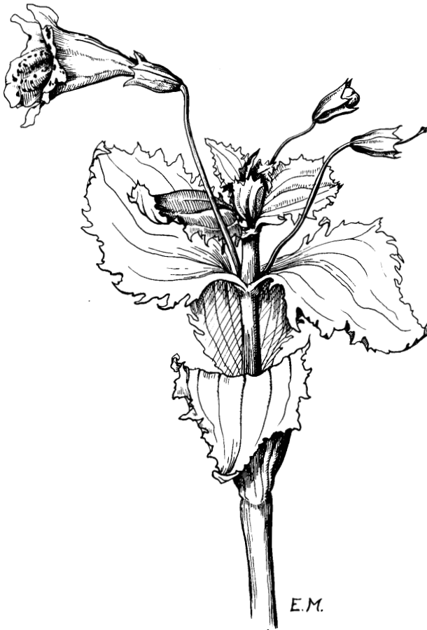
Abb. 6. Gelbe Gauklerblume ( Mimulus guttatus ). Zeichnung von E. MICHELS (aus GROSSMANN 1976).

Und so liegt diese Arbeit in den Händen von interessierten Pflanzenkennern, von Männern und Frauen, die ihre Heimat kennen und lieben. Sie liefern –