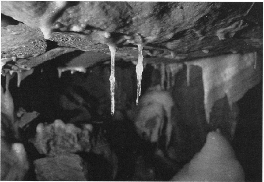
Abb. 3: Sinterfahne und Makkaronis im Eingangsbereich der Herbstlabyrinth-Höhle („Willy-Hofmann-Halle“).

Sie verengt sich im Westen zu einer ca. zwei Meter breiten Kluft, in der man über große, schwarze Flußgerölle (Basalt) steil bis zum endgültig verstopften Ende aufsteigen kann.