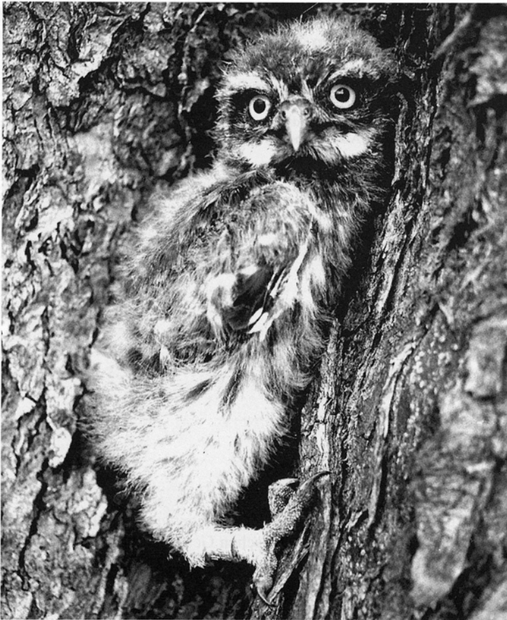
Abbildung 1: Junger Steinkauz (ca. 20 Tage alt)

Von wenigen vereinzelt Brutten vor 25 Jahren stieg der Brutbestand zeitweise auf bis zu 31 Brutpaare an.