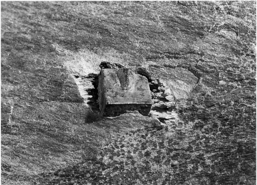
Abbildung 2: Pyritkristall von 5,5 mm Kantenlänge mit asymmetrischen Druckschattenhöfen

Da das Handstück nicht orientiert aus dem anstehenden Gestein entnommen worden ist, sondern lose von der Halde aufgelesen wurde, ist die in Abbildung 1 ge-