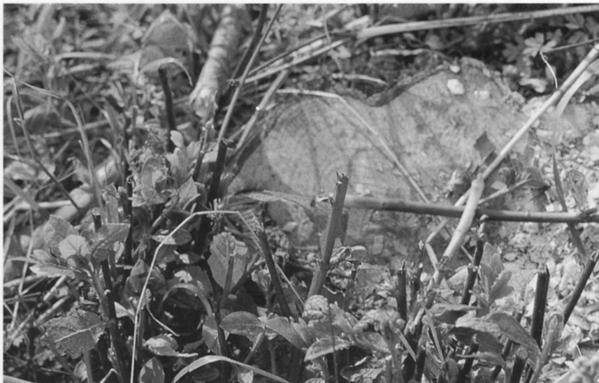
Abbildung 4: Erneut austreibende Weiden werden von den Galloway-Rindern effektiv verbissen.