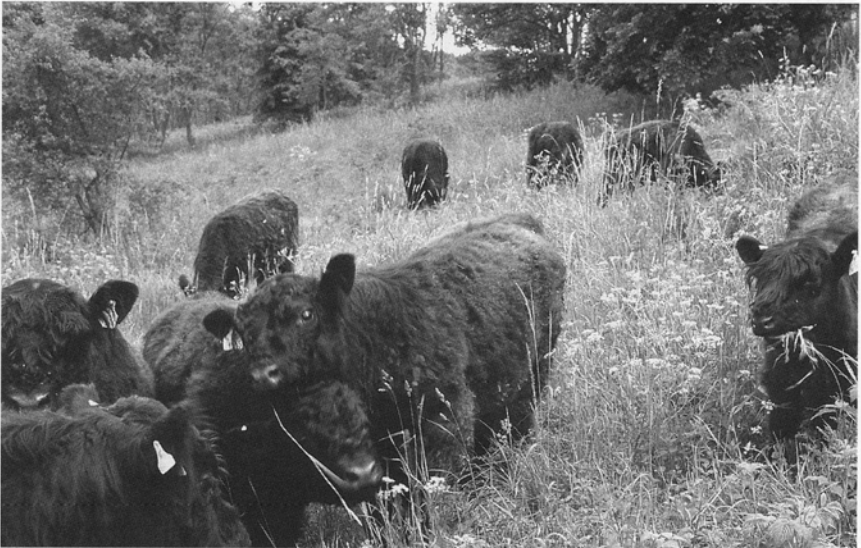
Abbildung 3: Eine Herde Jungbullen im Alter von 8–20 Monaten beweidet die großräumig eingezäunten, strukturreichen Teilflächen im Wechsel.

getragen. Seine Galloway-Rinder beweiden nun gemeinsam mit den Tieren seines Züchterkollegen PETER BIRKEL, Landwirt aus Idstein, die neugeschaffenen Wiesen. (Abb. 3)