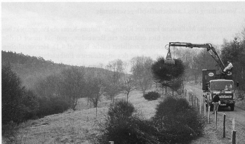
Abbildung 2: Das bei der Entbuschung in großen Mengen anfallende Schlehenschnittgut wird verladen und zu den Gradierbauten nach Bad Nauheim transportiert.

Vor diesem naturschutzfachlichen Hintergrund hat der Landschaftspflegeverband Rheingau-Taunus e. V. (LPV) in einem 6 ha großen Areal westlich von Niederglabach ein landschaftspflegerisches Projekt mit dem Ziel erarbeitet, die zuvor beschriebene ungünstige Entwicklung aufzuhalten und sogar umzukehren. Mit einer selektiven Entbuschung wurden im Projektgebiet die Voraussetzungen für die Wiederaufnahme einer landwirtschaftlichen Nutzung durch extensive Beweidung mit Galloway-Rindern geschaffen. Der Nebenerwerbslandwirt und Gallowayzüchter ARNO MOLTER aus Heidenrod ist langjähriger Vertragspartner des LPV und hat mit seinem Engagement wesentlich zum Gelingen des Projektes bei-