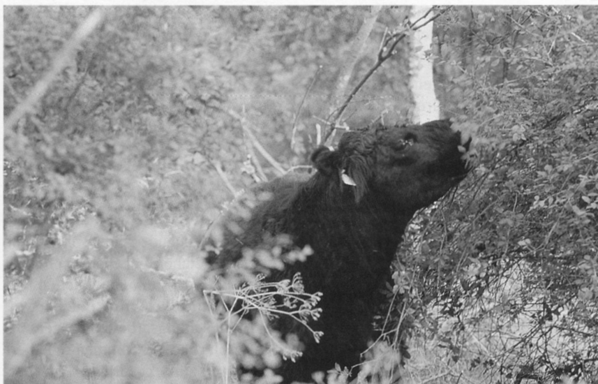
Abbildung 5: Auch vor dornigem Schlehengebüsch schrecken die Galloway-Rinder nicht zurück und helfen damit, ein erneutes Verbuschen der Flächen zu verhindern.