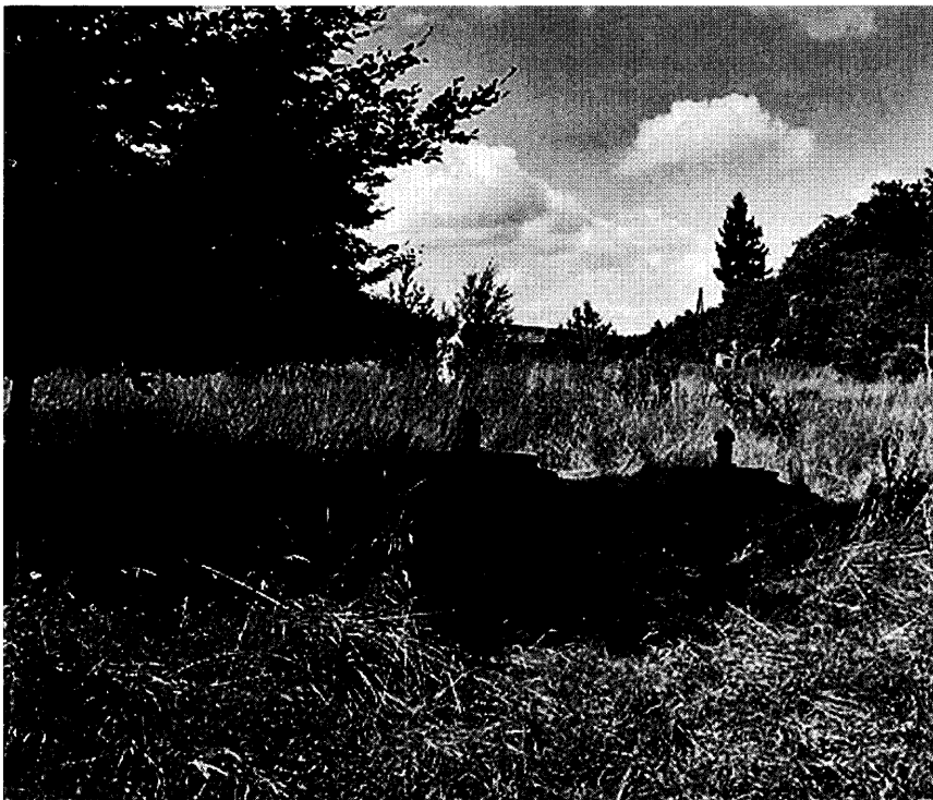
Abbildung 3: Das obere Tiefenbachtal bei der ehemaligen Dachschiefergrube „Kreuzberg“, Schachtfassung.

(Eisen-)Sulfid hinzuweisen ist. Analysen früherer Jahre zeigen Sulfatgehalte bis 266 mg/l (Grenzwert: 240 mg/l).