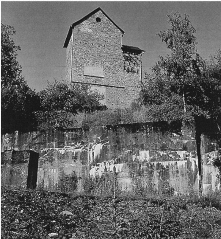
Abbildung 2: Überbauter Schacht der Schiefergrube „Meiers Hoffnung“ bei Heidenrod-Nauroth

Die Grube bestand seit 1860. Als der Dachschieferabbau und die anschließende Gewinnung von Rohstoff für die Herstellung von Schwebbeton zum Erliegen kamen, wurde noch versucht, den Rohstoff für die Gewinnung von Blähschiefer zu nutzen. Doch kam es nicht mehr zu einer wirtschaftlichen Nutzung.