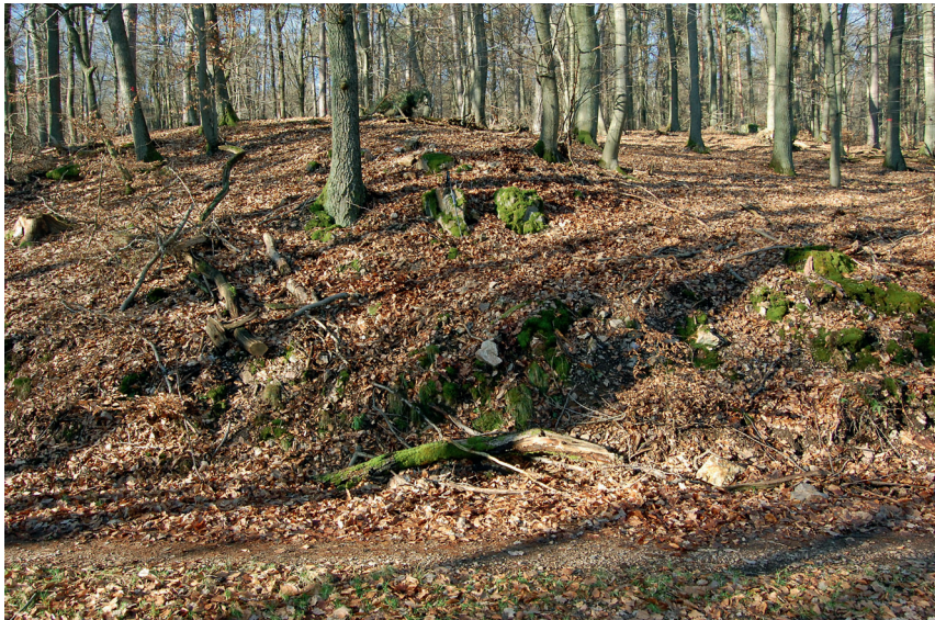
Abbildung 6: Felsklippen im Distrikt „Heidekeller“.

Ca. 50 m nordwestlich und oberhalb der Klippen befinden sich noch zwei größere Gangquarzblöcke (bis 2 m Länge).