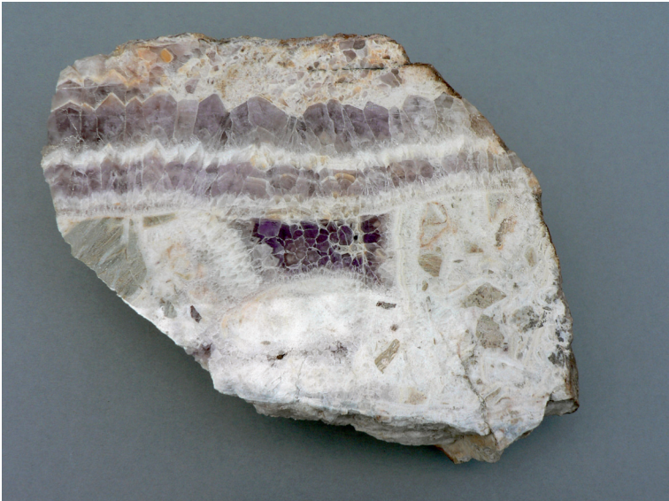
Abbildung 5: Kappenquarz-Amethyst, Distrikt „Breithag“ (Länge der Stufe: 15 cm).