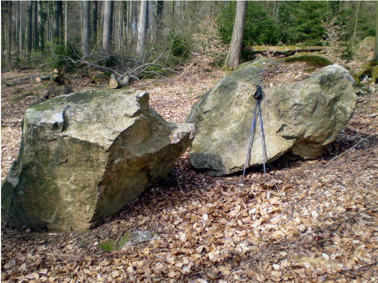
Abbildung 4: Quarzblöcke im Distrikt „Breithag“.