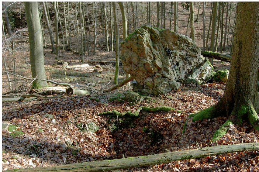
Abbildung 3: Obere Felsklippe (mit Pinge) im Distrikt „Wolfsborn“.