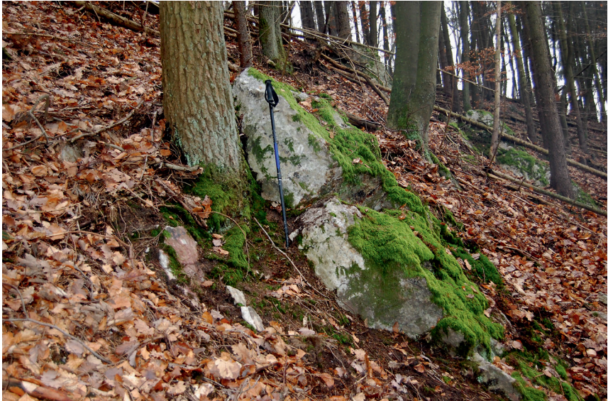
Abbildung 2: Felsklippen am Pfaffenborn.

Im Bachbett sieht man einzelne Quarzblöcke (bis 80 cm Länge) und mehrere kleinere Quarzgerölle.