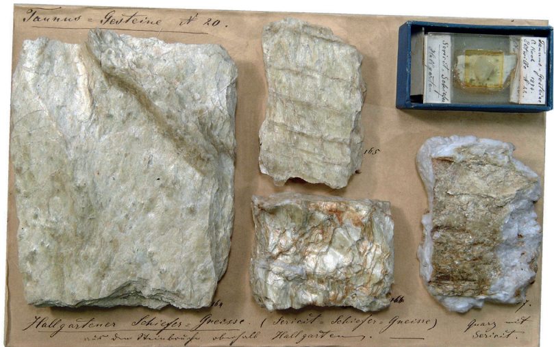
Abbildung 9: Tafel 20 (Taunus-Gesteine 20), Sericitgneis von Hallgarten.