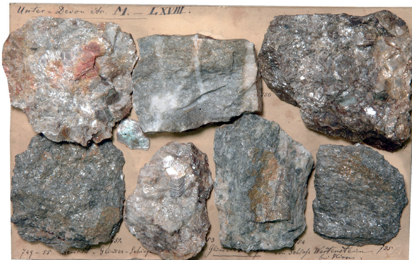
Abbildung 4: Tafel 111 (Unterdevon etc. M.-LXVIII), Gneise von Schloss Wartenstein bei Kirn.

Die ältesten Gesteine im Bereich des Hunsrücks und Taunus stellen die Gneise von Kirn/Wartenstein und von Schweppenhausen dar. Eine radiometrische Altersdatierung ergab ein Metamorphosealter von 522 Mio. Jahren (MEISL et al. 1989), sie sind also bei einer Gebirgsbildung im Kambrium entstanden. Im Rahmen plattentektonischer Modellvorstellungen sind die Gneisvorkommen von Kirn/Wartenstein und Schweppenhausen als kontinentale Kruste des sog. Avalonia-Terrans anzusehen, das den tiefen Untergrund des Rheinischen Schiefergebirges bildet und auch als cadomisches Basement bezeichnet wird. Im Bereich einer bedeutsamen tektonischen Störungszone, die vom südwestlichen Hunsrück bis in den östlichen Taunus und in den Harz zu verfolgen ist, treten diese sehr alten Gesteine an die Erdoberfläche (ANDERLE et al. 1995, FRANKE 1998, KLÜGEL 1997).