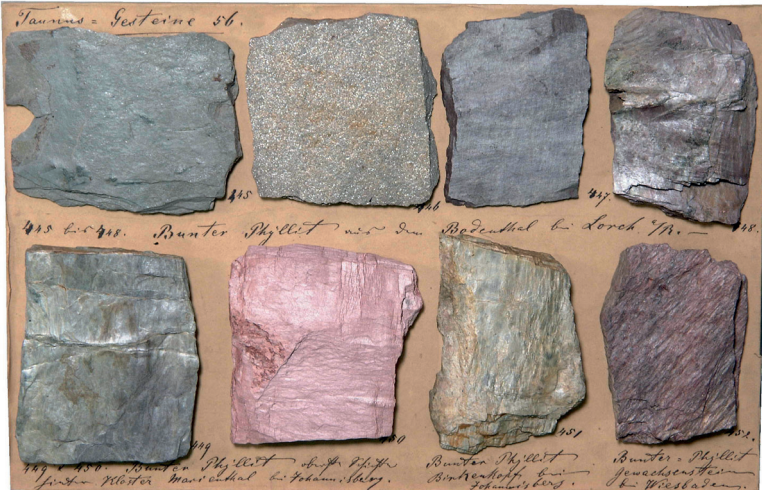
Abbildung 10: Tafel 52 (Taunus-Gesteine 56), Bunte Schiefer aus dem Bodenthal bei Lorch, von Kloster Marienthal und Johannisberg.

Über den Hermeskeilschichten folgt der Taunusquarzit (Siegen-Stufe) mit grau- und weißen, sehr festen Quarziten (Abb. 13). Sie bilden markante Bergrücken