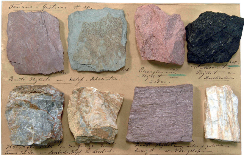
Abbildung 8: Tafel 30 (Taunus-Gesteine 30), Bunte Phyllite (Bunte Schiefer der Taunuskamm-Einheit) von Schloss Rheinstein (Samml.-Nr. 245, 246) und Königshofen (Samml.-Nr. 251, 252). Der Eisenglimmer-Phyllit von Bad Soden (Samml.-Nr. 247) gehört zu den Einlagerungen von Bunten Sericit-Schiefern in den Eppsteiner Schiefer, der Anthrazit-Phyllit von Breckenheim (Samml.-Nr. 245) und der körnige Kalk vom Lorschacher Kopf (Samml.-Nr. 249, 250) zu den Lorschacher Schiefer.

Innerhalb der Lorsbacher Schiefer treten graphitische Lagen auf, die Koch in seiner Sammlung dokumentiert (Abb. 8, Anthrazitschiefer).