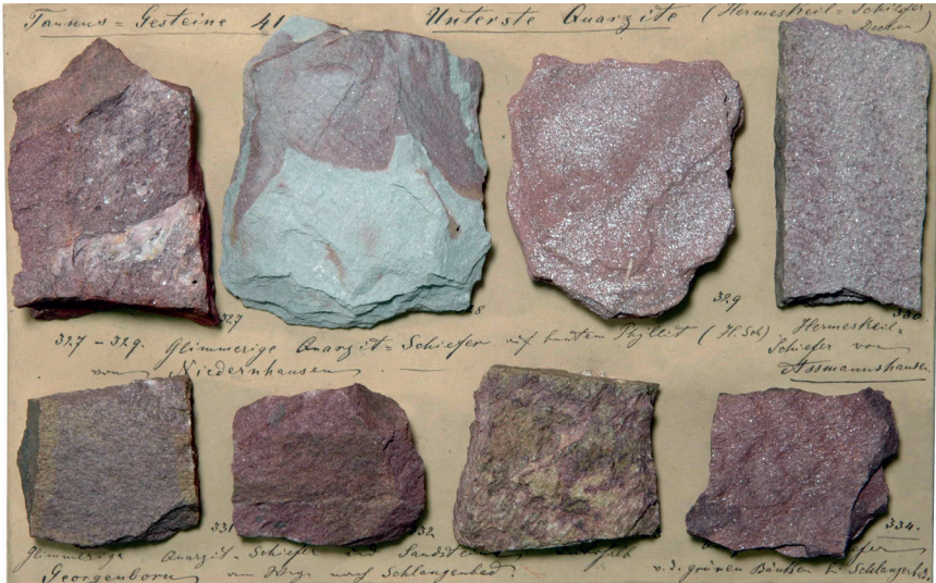
Abbildung 12: Tafel 41 (Taurus-Gesteine 41), Unterste Quarzite, Hermeskeil-Schiefer von Niedernhausen, Assmannshausen, Georgenborn, Schlangenbad.

wie die Rentmauer nördlich von Wiesbaden. Die Quarzite entstanden aus ziemlich reinen Quarzsanden, die in einer breiten Gezeitenzone des Meeres immer wieder umgelagert wurden.