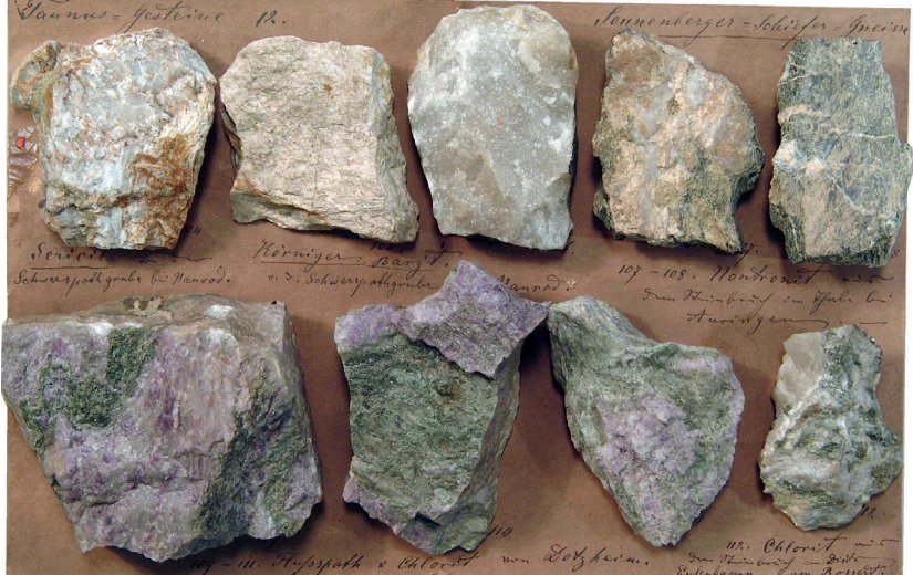
Abbildung 6: Tafel 12 (Taurus-Gesteine 12), Baryt von der Schwerspatgrube Naurod und violetter Fluorit aus dem Wiesbaden-Metarhyolith in Wiesbaden-Dotzheim.

sammen mit dem landläufigen Namen Sericitgneis benutzt. Heute werden sie nach moderner Nomenklatur entsprechend ihrer chemisch-mineralogischen Zusammensetzung als Wiesbaden-Metarhyolith bezeichnet (vgl. Tab. 1). In den Sericitgneisen von Dotzheim tritt schöner, violett gefärbter Fluorit auf (Abb. 6). Die radiometrische Altersdatierung ergab ein Alter von 426 Mill. Jahren, das entspricht einer stratigraphischen Einstufung ins Silur (SOMMERMANN et al. 1992).