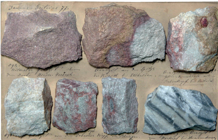
Abbildung 11: Tafel 73 (Taunus-Gesteine 77), Hermeskeil-Schichten von Nieder-Josbach, Ehlhalten, Taunusquarzit vom Erbacher Kopf im Rheingau und vom Hörkopf bei Assmannshausen.