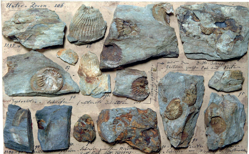
Abbildung 14: Tafel 125 (Unter-Devon 206), Zaphrentis-Schiefer, Korallen in Schiefererhaltung aus dem Distrikt Schnepfengärtchen zwischen Esch und Idstein.