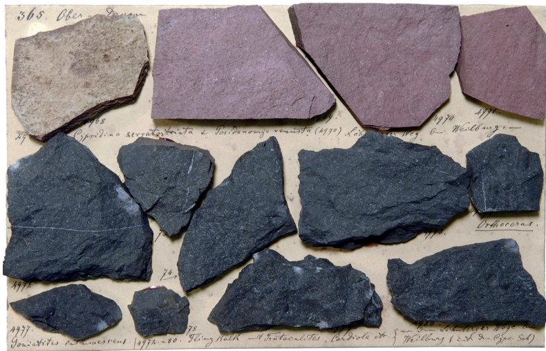
Abbildung 15: Tafel 129 (265 Ober-Devon), Rote Cypridinen-Schiefer mit Abdrücken von Cypridina serratostrata und schwarzer Flinzkalk mit Tentakuliten vom Löhnberger Weg, Weilburg.

gruppen über große Entfernungen verfolgen lassen, zeigt die geologische Übersichtskarte im Bereich der Lahn- und Dillmulde ein differenziertes Bild. Weit verbreitet sind Gesteine vulkanischen Ursprungs wie Diabas und Schalstein. Dazwischen treten tonige, sandige und kalkige Sedimenthorizonte auf, die teilweise miteinander verzahnt sind. Auffällig sind große Kalksteinkomplexe, die aus ehemaligen Riffen entstanden sind und früher als Lahnmarmor abgebaut wurden. Diese sehr unterschiedlich ausgebildeten Gesteine sind in einem Meeresraum entstanden, der durch Vulkane und Riffe in Tief- und Flachwasserbereiche gegliedert war (FLICK et al. 1998, THEWS 1989). Zu Zeiten Kochs galt es zunächst einmal, anhand von Fossilien eine Zuordnung der Schichten zu Mittel- und Oberdevon bzw. Unterkarbon herzustellen. Die Sammlung enthält Belege für typische Gesteine und Fossilien des Mittel- und Oberdevons. Beispiele für die Gesteine vulkanischen Ursprungs finden sich z. B. auf den Tafeln 141 und 144 in Form von Schalstein aus der Gegend um Limburg, Ennerich und Niederbrechen. Einige Stücke zeigen massenhaft Tentakuliten (Abb. 15, Tafel 129). Außerdem sind Abdrücke von Ostrakoden, den sog. Cypridinen, vertreten, die bereits Sandberger beschrieben hatte (Abb. 15, Tafel 129). Weiterhin befinden sich in der Sammlung – z. T. in Bruchstücken – Goniatiten, Trilobiten, Orthoceren und Pflanzenreste.