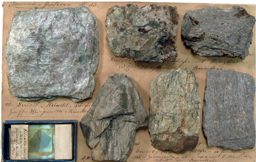
Abbildung 7: Tafel 23 (Taunus-Gesteine 23), Sericit-Hämatit-Schiefer (Bunte Sericit-Schiefer in den Eppsteiner Schiefen).

Auf die Metavulkanite folgen in der stratigraphischen Abfolge nach oben Gesteine sedimentären Ursprungs. Koch bezeichnete sie in seiner Sammlung als Eppsteiner Schiefer, Stauffen-Schiefer, Sericit-Phyllite, Sericit-Kalk-Phyllite, Sericit-Hämatit-Schiefer und Schiefer-Phyllite (Abb. 7). In der Kartierung Blatt Königstein, Wehen (Platte), Wiesbaden und Eltville kartierte er Glimmer-Sericit-Schiefer (seg) und Bunte Sericit-Schiefer (seb) aus und ordnete diese der Unteren Gruppe der Taunusgesteine zu. Die auf Koch folgenden Bearbeiter entwickelten die Gliederung in Eppsteiner und Lorsbacher Schiefer (vgl. Tab. 1, REINACH 1904, LEPLA 1922, 1924, STENGER 1961). Aus den Eppsteiner Schiefen sind nach wie vor keine Fossilien bekannt, die eine genaue stratigraphische Einstufung ermöglichen würden. Sie folgen in konkordanter Lagerung auf die silurischen Sericitgneise (KLÜGEL 1997), ihre stratigraphische Reichweite lässt sich also auf den Bereich vom oberen Silur bis in das Unterdevon eingrenzen. Die hangenden Lorsbacher Schiefer wurden anhand von Sporen in die Emsstufe des Unterdevons eingestuft, der obere Teil reicht sogar bis ins Oberdevon (ANDERLE 1998, REITZ 1989).