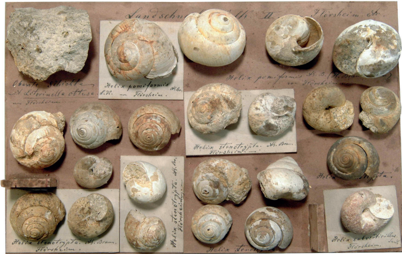
Abbildung 17: Tafel 182 (Landschneckenkalk II), Landschnecken von Flörsheim (Cerithienschichten).