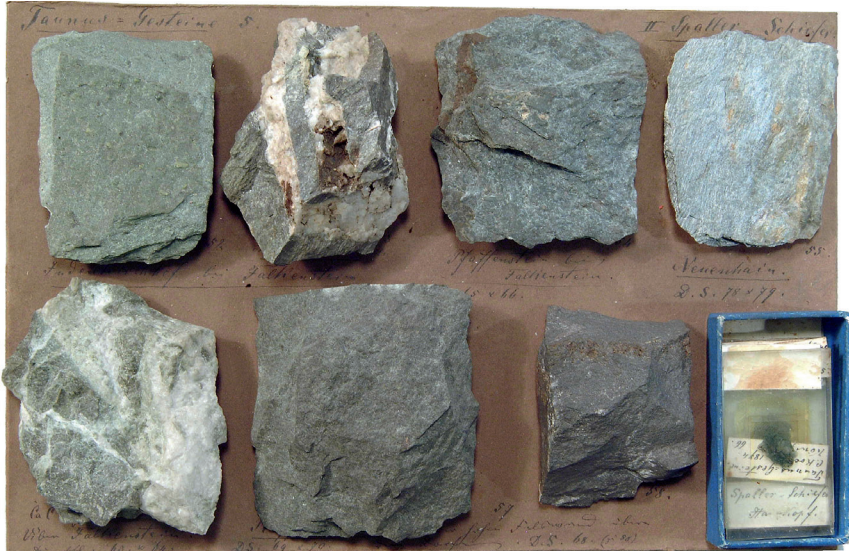
Abbildung 5: Tafel 5 (Taurus-Gesteine 5), Rossert-Metaandesite von Königstein-Falkenstein, unter Sammlungsstück 53 (verdeckt) erwähnt Koch das Mineral Axinit.

Interessant ist, dass Koch aus dieser Gesteinsfolge bereits das Mineral Axinit beschreibt (Tafel 5, Sammlungsstück 53). Es ist ein Indiz dafür, dass die Gesteine bei ihrer Entstehung mit Meerwasser in Kontakt gekommen sind (MEISL et. al 1992).