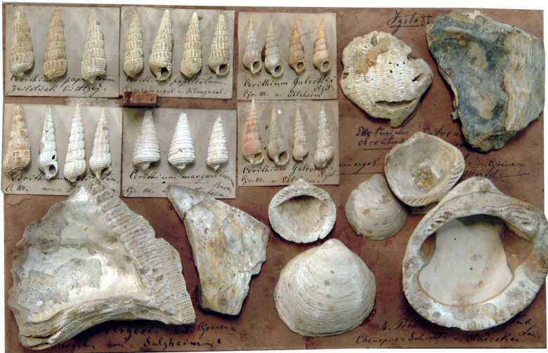
Abbildung 16: Tafel 176, Typische Fossilien aus dem Tertiär, Muscheln (Austern, Schinkenmuscheln, Pecten) und Schnecken (Cerithien) aus dem Meeressand und dem Cyrenen-Mergel von Kreuznach, Sulzheim, Ehlshiem, Alzey und Hattenheim.

Die Entstehung und die stratigraphische Abfolge der tertiären Schichten wurden zusammenfassend von Försterling und Radtke im Sonderband 2 des Nassauischen Vereins für Naturkunde beschrieben (FÖRSTERLING & RADTKE 2004).