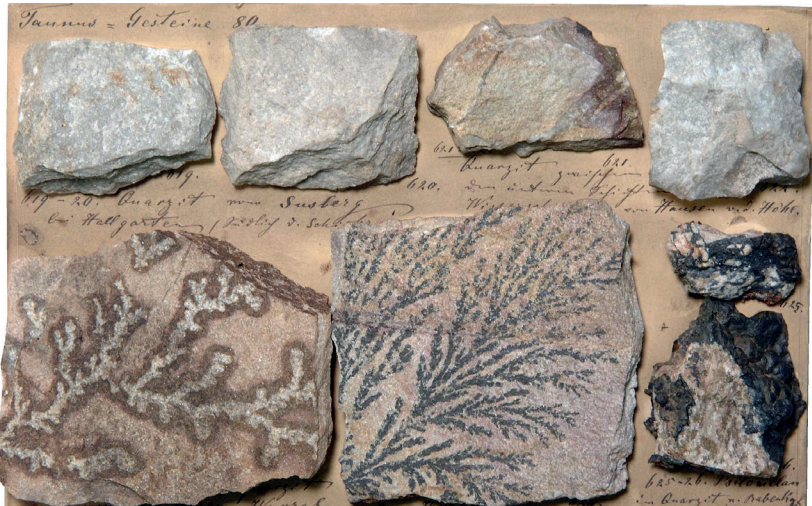
Abbildung 13: Tafel 76 (Taurus-Gesteine 80), Taurusquarzit mit Dendriten.