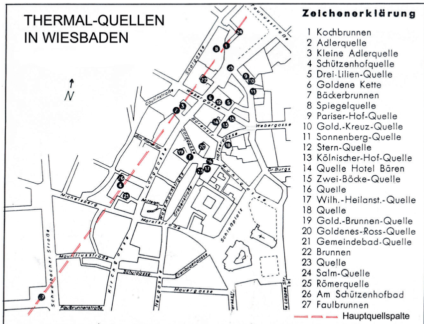
Abbildung 2: Lage der 26 Thermalquellen und des Faulbrunnens im Stadtgebiet (nach CZYSZ 1995, leicht verändert), früherer Zustand; heute sind nur noch 15 Quellen vorhanden, davon wird nur ein geringer Teil genutzt.

In Abb. 3 ist eine Profilserie einiger Thermalwasserbohrungen entlang der Hauptspaltenzone wiedergegeben.