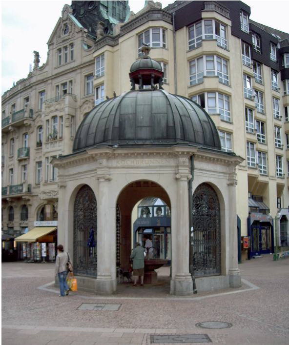
Abbildung 4: Kochbrunnen-Tempel; im Hintergrund das ehemalige Palast Hotel.