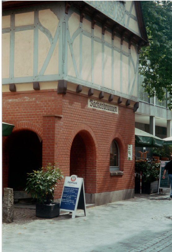
Abbildung 7: Bäckerbrunnen; Photo Dr. Stengel-Rutkowski 2004.

ergasse (heute Wagemannstraße) zum Brühen der Schweine. Außerdem war er Entnahmestelle für die Einheimischen. Später wurde der Bäckerbrunnen an ein kompliziertes Leitungssystem angeschlossen, mit dem eine Trinkstelle in der Brunnenkolonnade versorgt wurde. Überschüssiges Thermalwasser wurde zum Bäckerbrunnen zurückgeleitet (Abb. 7), wo es trotz langer Wegstrecke noch immer eine Temperatur von 50 °C besaß (CZYSZ 2000).