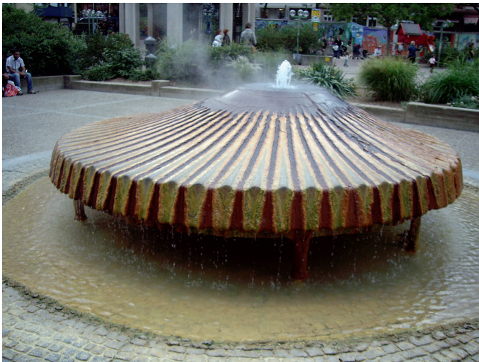
Abbildung 5: Kochbrunnen-Springer, Granit-Fassung.