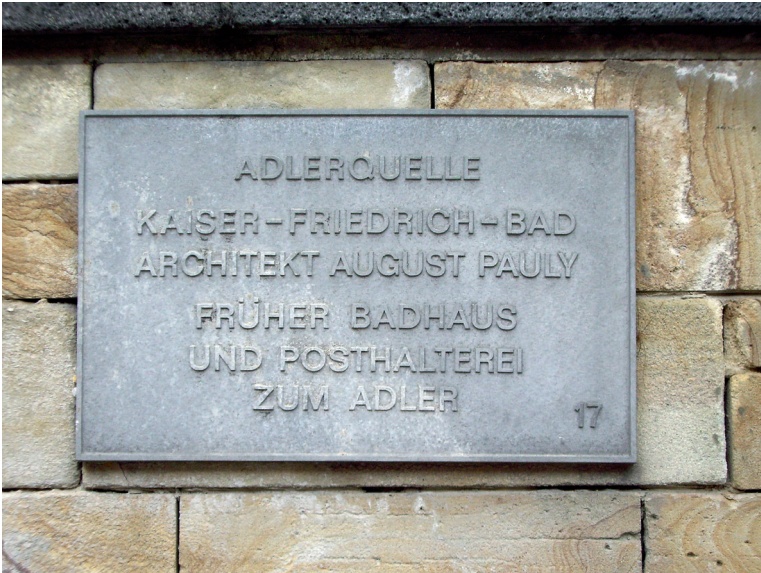
Abbildung 6: Hinweis auf die Lage der Adlerquelle.

Im Gebäude des Kaiser-Friedrich-Bades befinden sich zwei große Behälter, in denen das Thermalwasser von Kochbrunnen, Salmquelle, Adlerquelle und Schützenhofquelle gesammelt, z.T. für eine Nutzung zu Badzwecken aufbereitet (unter Stickstoff enteist) und verteilt wird. Von hier aus wird es in das in den 70er-Jahren 1,7 km vom Kochbrunnen entfernt im Aukammtal errichtete Thermalschwimmbad und zu Heizungszwecken in das Rathaus und zum Weberhof (Palasthotel) geleitet.