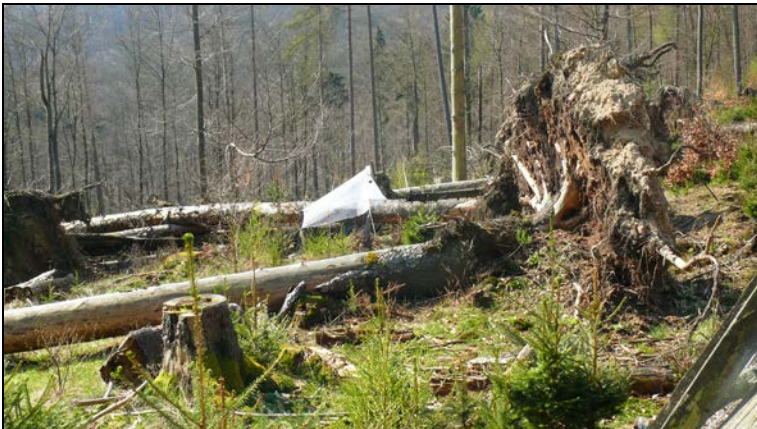
Abbildung 5: Malaisefalle auf der Husefläche (Windwurf Fläche).