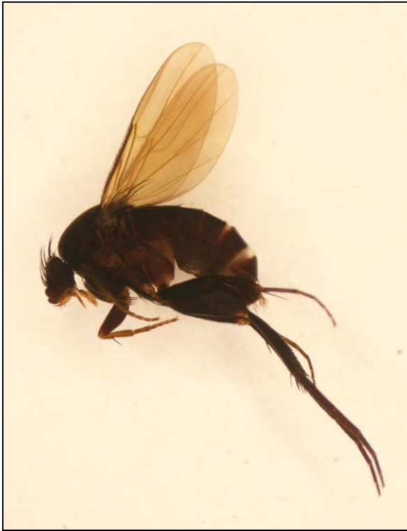
Abbildung 1: Buckelfliege Hypocera mordellaria , Männchen, Huseflähe.