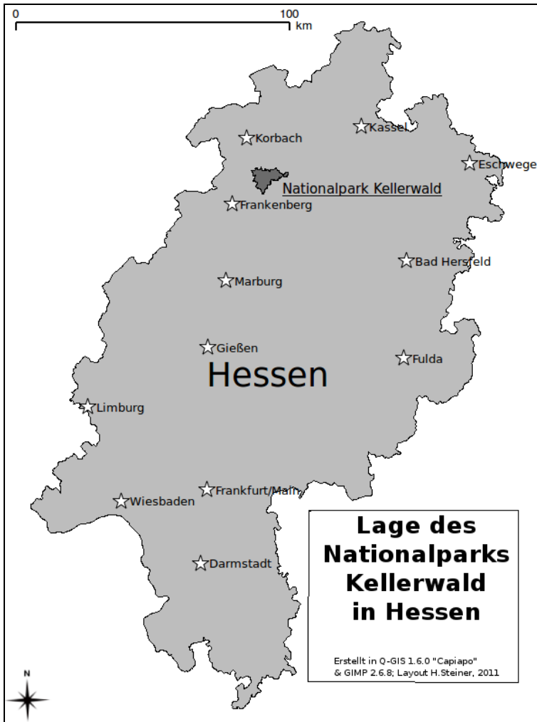
Abbildung 2: Karte des Bundeslandes Hessen mit dem Nationalpark Kellerwald.

Quellbach im Bärenbachtal (Abb. 3): ein Bachlauf mit schluchtartigen und schroffen Bergflanken; an den Hängen befinden sich Urwald-Relikte.