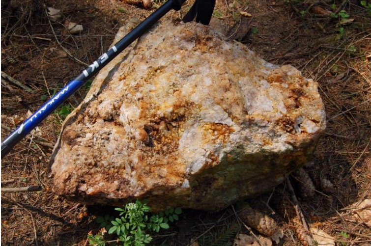
Abbildung 6: Gangquarzblock mit Quarz-xx, Metzgerpfad.

Am Metzgerpfad nordnordwestlich des Einsiedlers (Berg) trifft man direkt am Pfad auf einen größeren, im Waldboden steckenden, nicht abgerundeten Gangquarzblock (1,3 m Länge) und auf mehrere kleinere Gangquarzblöcke (bis 0,6 m Länge, nicht bis gering abgerundet) sowie auf Gerölle, die sich nahe des Pfades im Wald befinden (Abb. 6).