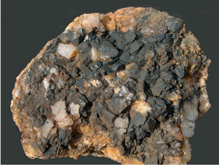
Abbildung 5: Quarz-xx mit Limonit-Überzug, Landgrafenberg (b = 10 cm).

Im nordwestlichen Gangstreichen trifft man am Ostabhang unterhalb des Landgrafenberg-Gipfels auf einige kleinere Gangquarz-Blöcke und -Gerölle (bis max. 0,7 m Länge).