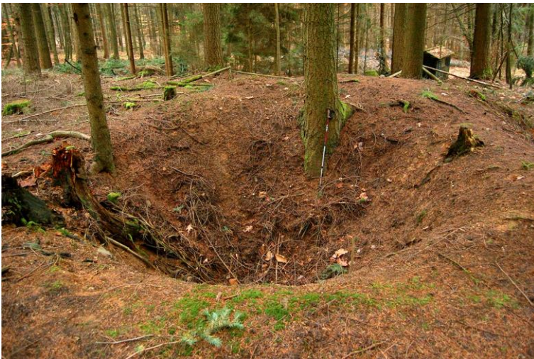
Abbildung 3: Bergbau-Pingel am Landgrafenberg.

An den Quarzgang gebunden ist eine starke Brauneisenstein-Vererzung vom Typ „Hunsrückerde“; diese ist als Verwitterungserz im Tertiär entstanden. Zur Entstehung, Alter, und Ausbildung der Erze im Allgemeinen siehe unter KIRN-BAUER (1998b).