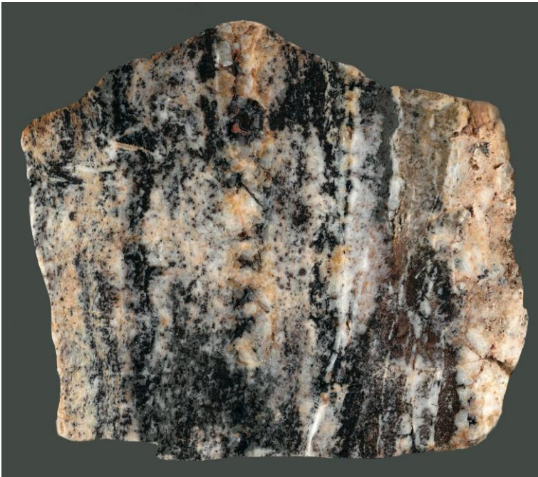
Abbildung 4: Pseudomorphosenquarz mit Limonit, Landgrafenberg (b = 7 cm).

Vorhanden sind heute noch neben den oben schon erwähnten Pingen mit Gangquarz mehrere Schachtpingen unterhalb und oberhalb eines kleinen, verlassenen, teilweise vermüllten Steinbruches; außerdem im Pingenbereich Halden mit Gangquarz (Pseudomorphosenquarz, Quarz-xx), Brauneisenerz (Limonit, derb, Überzüge und Krusten auf Gangquarz und Quarz-xx) und quarzitischem Nebengestein (Abb. 4, 5). Nachweisbar sind auch grünlichgelbe Beläge von Phosphatmineralen auf Limonit.