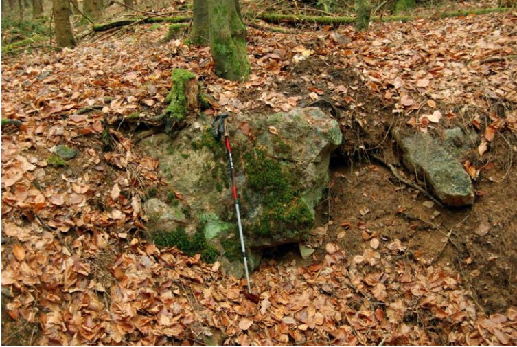
Abbildung 2: Pingel mit anstehendem Gangquarz am Landgrafenberg.

im Schmidtwäldchen am Südabhang des Landgrafenberges (Abb. 3): in einer größeren Bergbau-Pinge an zwei Seiten und vermutlich anstehend in einer kleineren Pingel in Streichrichtung. Außerdem befinden sich in diesem Bereich mehrere kleinere und größere kaum abgerundete Gangquarzblöcke (max. 1 m Länge). Die Mächtigkeit des Ganges beträgt hier mindestens 2 m.