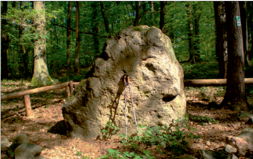
Abbildung 5: Hermann-Löns-Gedenkstein E Hagelplatz; Foto: Verfasser.

Figure 4: Eisenkiesel crystals (b = 7 mm); photo: Tom Schäfer, Gießen.