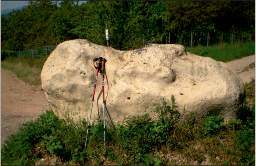
Abbildung 2: Großer Gangquarzblock S Hagelplatz; Foto: Verfasser.

infolge feiner Bänderung zu echtem Achat („Tanusachat“). Heute sind diese Bildungen nur noch sporadisch zu finden.