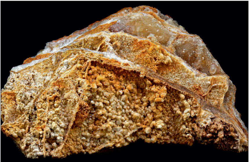
Abbildung 3: Eisenkiesel-xx (b = 8 cm); Foto: Tom Schäfer, Gießen.

Figure 2: Great block of quartz vein in the south of Hagelplatz; photo: author.