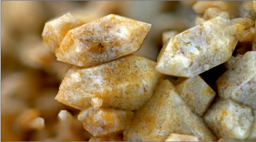
Abbildung 4: Eisenkiesel-xx (b = 7 mm); Foto: Tom Schäfer, Gießen.

Figure 4: Eisenkiesel crystals (b = 7 mm); photo: Tom Schäfer, Gießen.