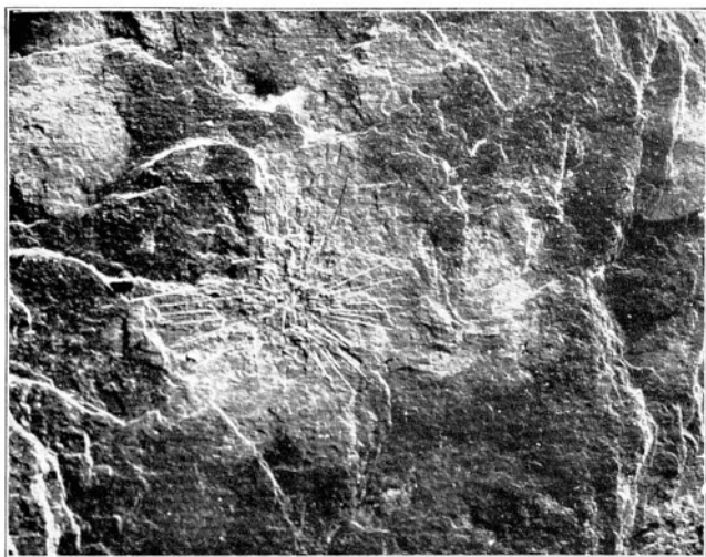
Abb. 1. Asteriscosella nassovica , Hervorhebung des Nadelskeletts,