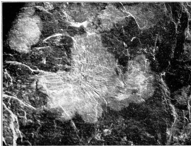
Abb. 2. Asteriscosella nassovica , Hervorhebung des Farbflecks,