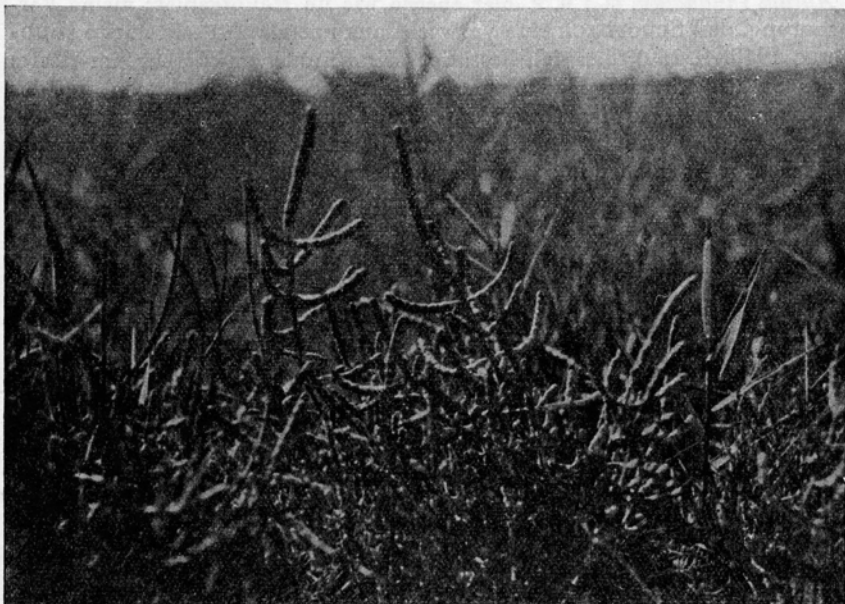
Bild 2. Der Queller auf der Salzwiese von Ober-Hörgern. — Aufn. O. NEEB, Spätsommer 1949.

Die Zahl der Chromosomen beträgt bei unseren Ober-Hörgerner Pflanzen 2n = 18 . Dieser Befund bestätigt und ergänzt die von KÖNIG (1939) gefundenen Zahlen, denn Binnenlandformen von Salzstellen bei Artern und Staßfurt haben nach KÖNIG ebenfalls die Chromosomenzahl