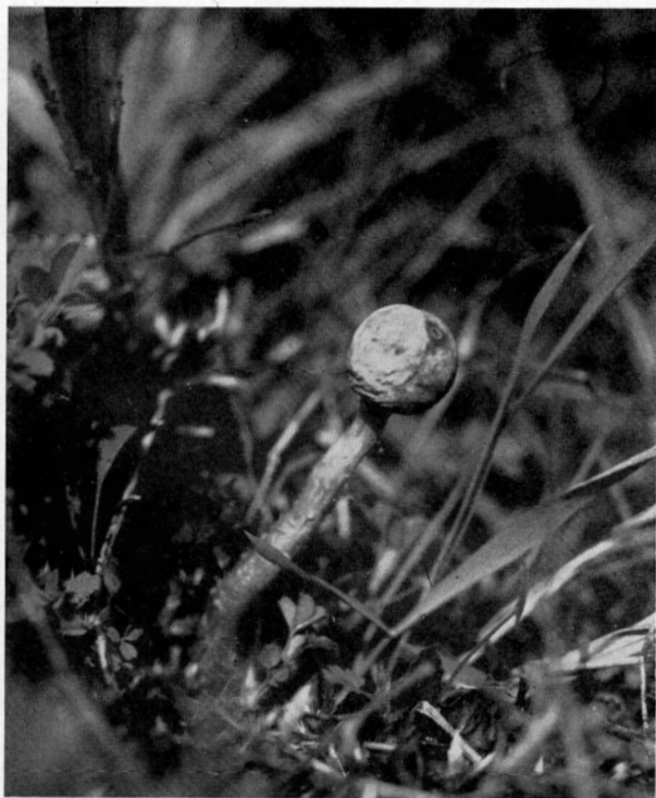
Abb. 2. Zitzen-Stielstäubling ( Tulostoma mammosum ) auf moosiger Muschelkalk-Trift; \frac{1}{1} n. Gr.-Aufn. Verf., Jena, 16. April 1927.