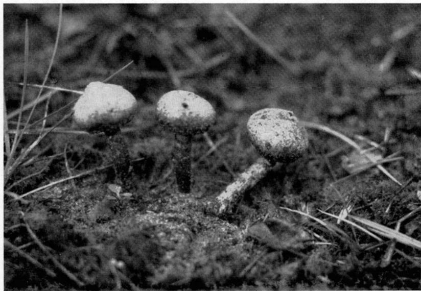
Abb. 4. Frisch gestreckte Brösel-Stielstäubling ( Tulostoma granuloseum ); \frac{1}{1} n. Gr.-Aufn. Verf., Sandhügel bei Budenheim, 31. Oktober 1953.