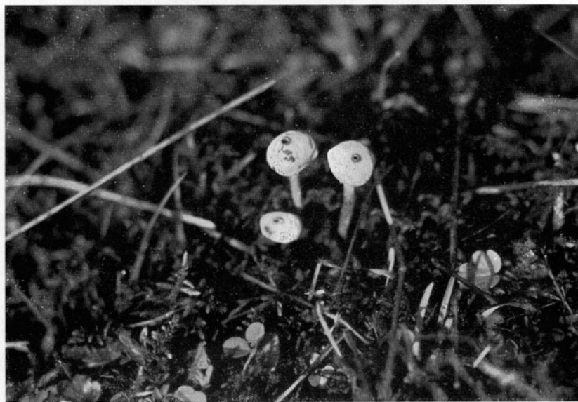
Abb. 1. Zitzen-Stielstäubling ( Tulostoma mammosum ) auf moosiger Massenkalk-Trift; 1/1 n. Gr.-Aufn. Verf. Dahlheimer Tal bei Wetzlar, 9. März 1941.