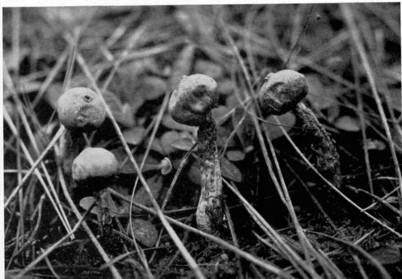
Abb. 3. Brösel-Stielstäubling ( Tulostoma granuloseum ); \frac{3}{4} n. Gr.-Aufn. Verf., Sandhügel bei Budenheim, 7. April 1952.