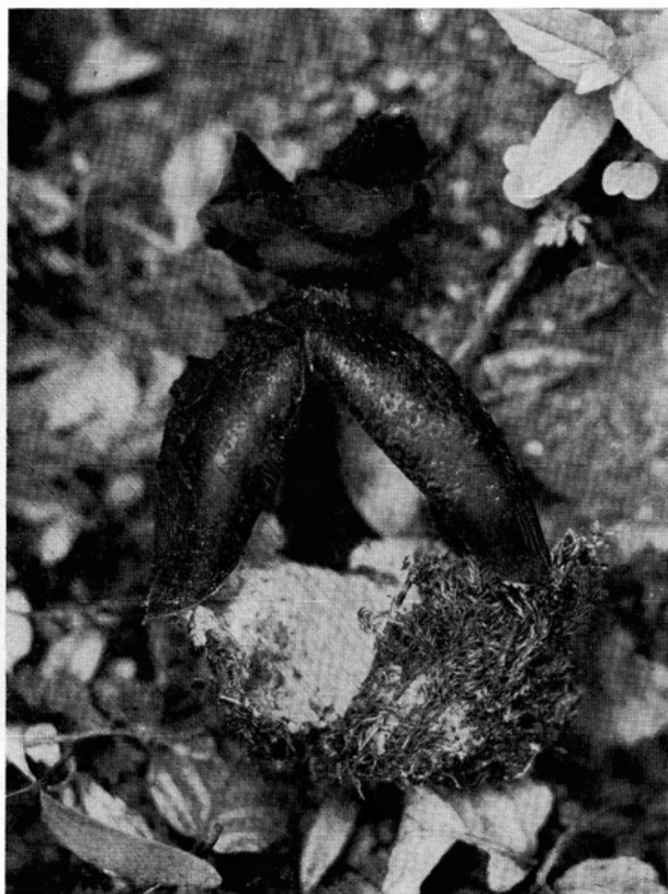
Abb. 4. Geaster fornicatus mit seinem moosbewachsenen Myzelnest; \frac{3}{4} n. Gr., Eselstein im Brombachtal (Odenwald), 16. Mai 1954.