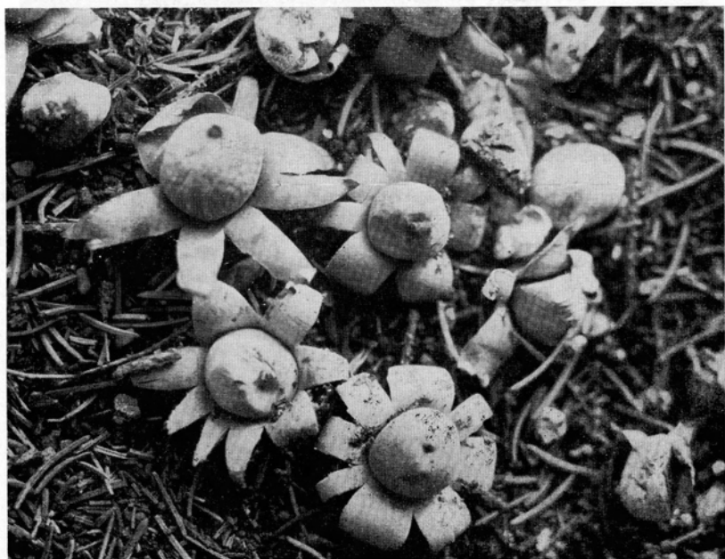
Abb. 2. Frisch entfaltete, gedrängt erwachsene Fruchtkörper des Geaster floriformis ; \frac{1}{1} n. Gr.-Aufn. Verf., Eulingsberg bei Wetzlar, 2. November 1953.