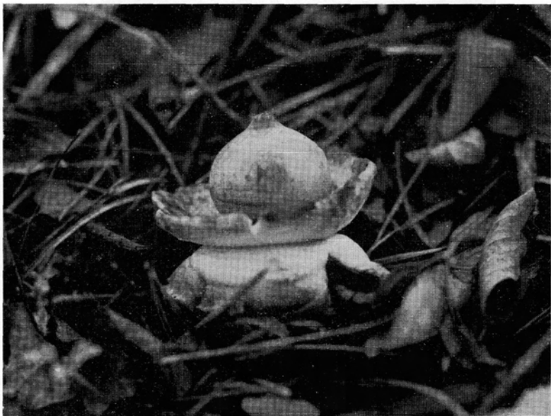
Abb. 5. Frisch entfalteter Geaster triplex mit dem aus der teilweise abgesprungenen Quellschicht gebildeten „Halskrause“; 1/1 n. Gr.-Aufn. Verf., Kiefernwald bei Alsbach (Bergstraße), 11. November 1951.