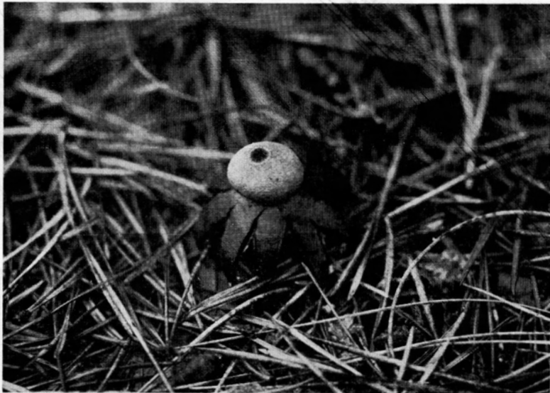
Abb. 3. Neuer Fruchtkörper des Geaster asper mit der körnig-rauhen Staubkugel; 1/1 n. Gr.-Aufn. Verf. Kiefernwald bei Budenheim. 31. Oktober 1953.