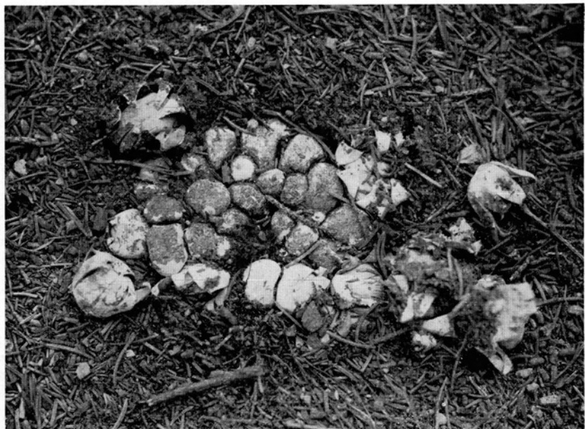
Abb. 1. Pflasterartig gedrängte, noch geschlossene Fruchtkörper des Geaster floriformis im Nadelhumus eines eingebneten Ameisenhügels; \frac{3}{4} n. Gr.-Aufn. Verf., Eulingsberg bei Wetzlar, 24. August 1953.