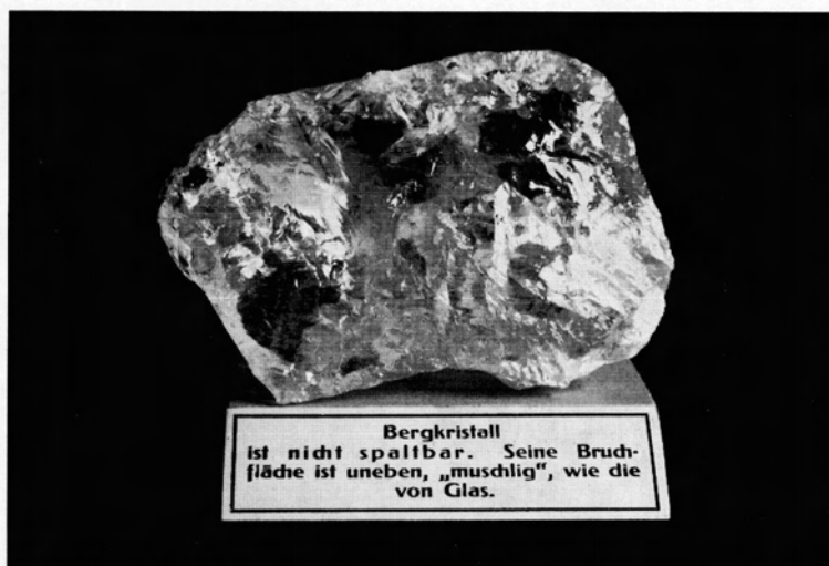
Abb. 1. Bergkristall ist nicht spaltbar. Seine Bruchfläche ist uneben, „muschlig“, wie die von Glas.