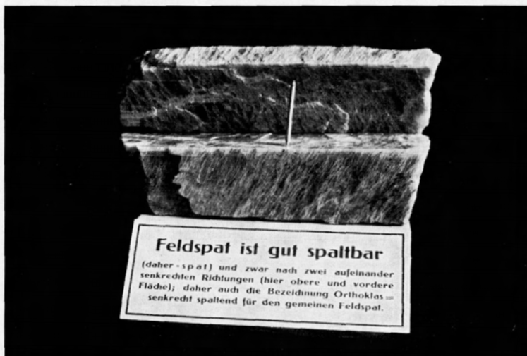
Abb. 3. Feldspat ist gut spaltbar, (daher -spat), und zwar nach zwei aufeinander senkrechten Richtungen (hier obere und vordere Fläche); daher auch die Bezeichnung Orthoklas = senkrecht spaltend für den gemeinen Feldspat.