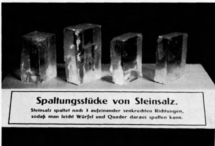
Abb. 4. Spaltungsstücke von Steinsalz. Steinsalz spaltet nach drei aufeinander senkrechten Richtungen, so daß man leicht Würfel und Quader daraus spalten kann.