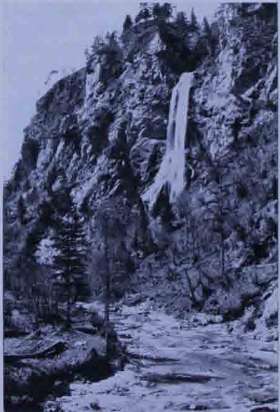
Abb. 4: Mirafall am Ötscher