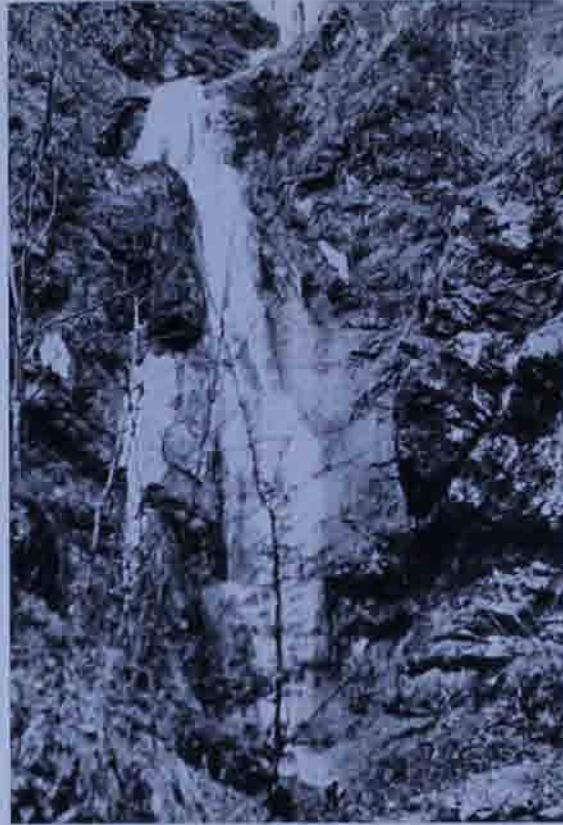
Abb. 5: Mirafall v. Kirchberg