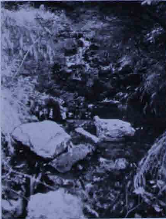
Abb. 3: Verschüttete Rohrer Miralucke