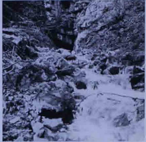
Abb. 2: Miraursprung mit Lucke