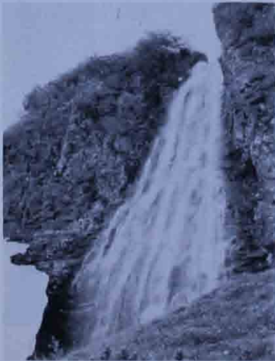
Abb. 6: Barbarafall