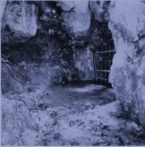
Abb. 1: Miralucke