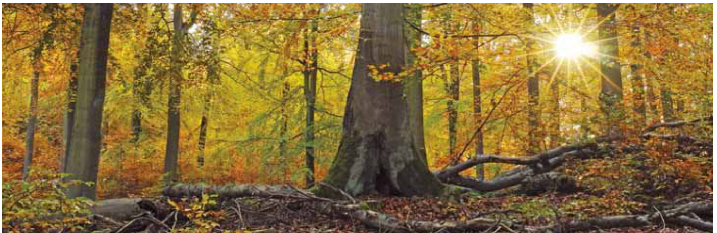
Alte Buchenwälder Deutschlands

In den folgenden Beiträgen werden die beiden Weltnaturerbestätten und das Weltkulturerbe „Bergpark Wilhelmshöhe“, das eine enge Verbindung zwischen Kultur und Natur beinhaltet, vorgestellt.