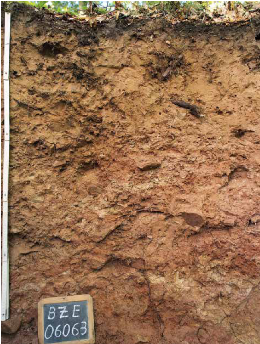
Abb. 4: Braunerde aus Lösslehm über Buntsandstein

Bewertungsbereich der Austauschkapazität. Die Basensättigung liegt bei der BZE II auf Profilebene bei knapp 30% und fällt damit in den gering-mittleren Bewertungsbereich. Die Waldkalkung kann als plausible Erklärung für die signifikante Zunahme der Basensättigung um 17 Prozentpunkte in der Tiefenstufe 0–5 cm angesehen werden.