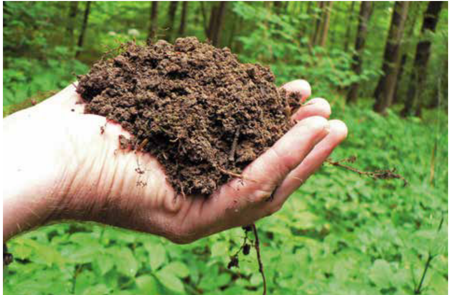
Abb. 1: Humoser Oberboden auf Kalk

In der Zeit von 2006 bis 2008 fand in hessischen Wäldern die zweite bundesweite Bodenzustandserhebung (BZE II)