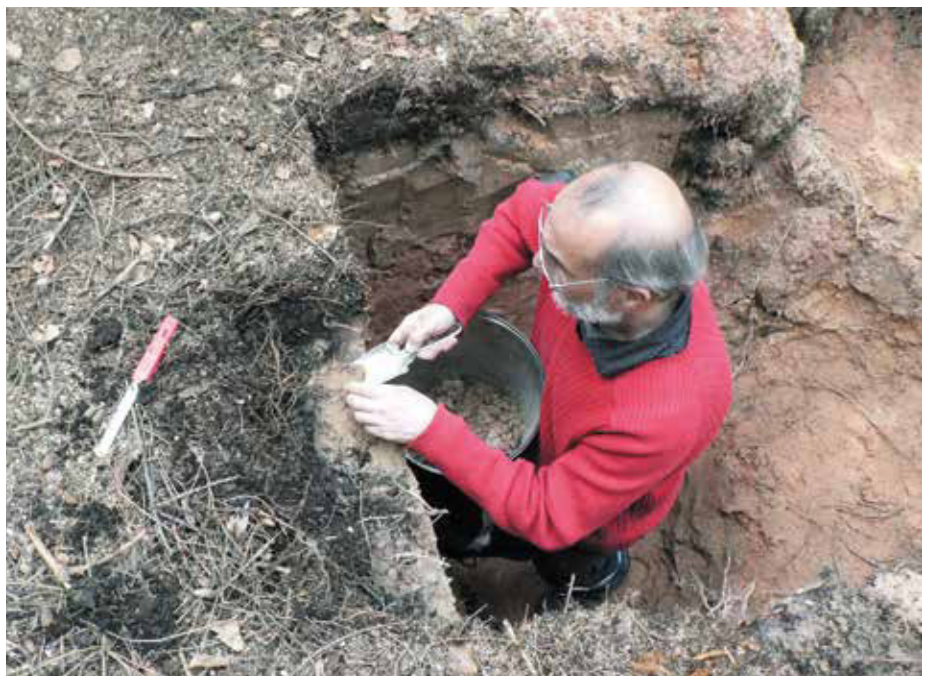
Abb. 2: Bodenprobenahme im Rahmen der BZE II

statt (Abb. 1, 2). Sie folgte der ersten Waldbodenzustandserhebung (BZE I), die in Hessen in den Jahren 1992 bis 1993 durchgeführt wurde. Wie bei der