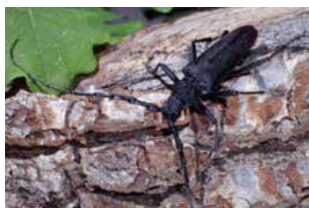
Abb. 1: Die Urwaldrelikt-Arten Feuerschmied ( Elater ferrugineus ) und Heldbock ( Cerambyx cerdo )

räumen. Dies dürfte hauptsächlich auf die großflächige Umwandlung von historischen Waldnutzungsformen (Nieder-, Mittel- und Hutewald) in Hochwälder und eine flächendeckende Erschließung zuvor schwer zugänglicher Waldbereiche zurückzuführen sein. Durch den Verlust von Laubwäldern, alten Bäumen, Totholzstrukturen und halboffenen Wäl-