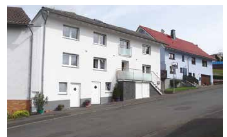
Abb. 2: Gegenüberstellung von ca. 1950 (links) und 2014 (rechts) gemachten Fotos. Obere Reihe: Kestrich, Dorfzentrum. Die Landwirtschaft wurde aufgegeben. Die Straßen sind asphaltiert. Der Sengersbach verläuft in einem Zementkanal. Offene Flächen sind mit Koniferen bepflanzt. Mittlere Reihe: Groß Felda, Marktplatz. Die Sandsteinbrücke wurde durch eine Zementkonstruktion ersetzt. Der Zugang zur Felda, ehemals vom Vieh genutzt, ist blockiert. Untere Reihe: Groß Felda, Straße „Pfungstweide“. Nach dem Ende der landwirtschaftlichen Nutzung wurden die Gebäude stark verändert. Die Straße und nahezu alle Freiflächen wurden asphaltiert.