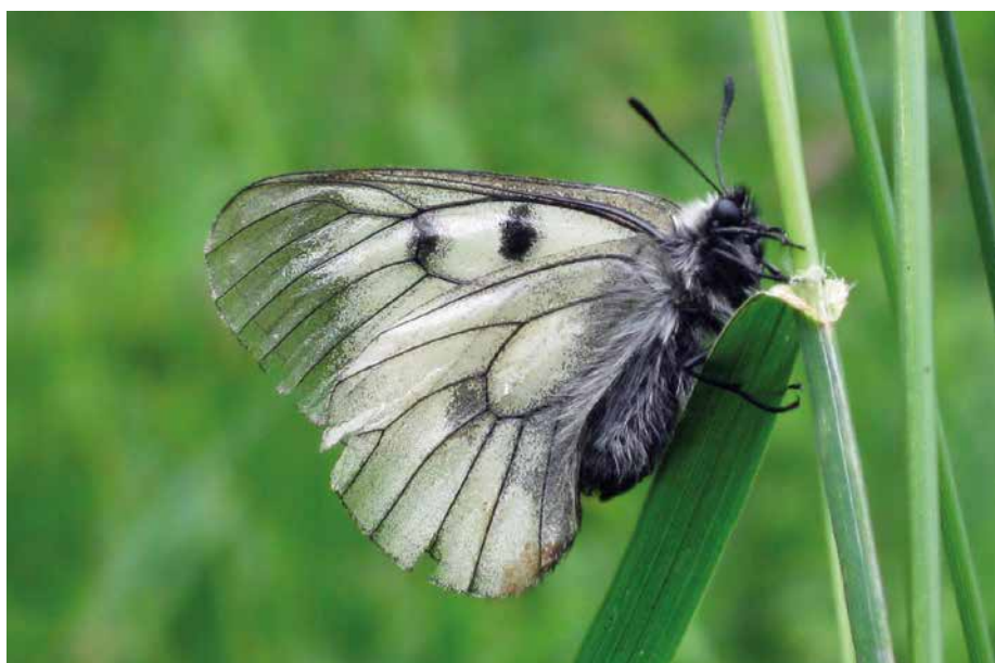
Abb. 4: Der Schwarze Apollo ( Parnassius mnemosyne ) hat sehr spezielle Habitatansprüche und erfordert entsprechende Pflegemaßnahmen.

Die Klimaveränderung ist in keinem Fall die hauptsächliche Ursache eines derzeit ungünstigen Erhaltungszustands, auch wenn sie z. B. bei der Äsche ( Thymallus thymallus ) einer von mehreren wesentlichen Faktoren ist. Bei rund 70 % der Arten und 60 % der LRT ist zumindest in der Zukunft mit negativen Auswirkungen des Klimawandels auf den Erhaltungszustand zu rechnen (HLNUG: Listen potentieller Klimaverlierer, Stand März 2019).