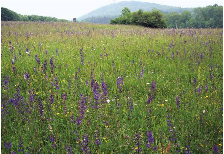
Abb. 6: Flachlandmähwiese (LRT 6510) im FFH-Gebiet 5317-305 Grünland und Wälder zwischen Frankenbach und Heuchelheim

Seit den 1950er Jahren unterliegt die landwirtschaftliche Nutzung einem tiefgreifenden Wandel, der durch zwei gegenläufige Trends gekennzeichnet ist: zum einen eine immer intensivere Nutzung des größten Teils der landwirtschaftlichen Nutzflächen, zum anderen eine Nutzungsaufgabe auf Flächen, die aus standörtlichen oder agrarstrukturellen Gründen wenig produktiv sind. Insbesondere die Nutzungsintensivierung hält im Kern bis heute an und prägt daher auch weiterhin die Entwicklung der Arten und LRT der Agrarlandschaft seit Inkrafttreten der FFH-Richtlinie. Im Grünland sind dies eine erhebliche Steigerung der Düngermengen, eine Erhöhung der Nutzungsfrequenz und eine Änderung der Nutzungsart: von Stand- oder Hutungsweide bzw. Heuwiese zu