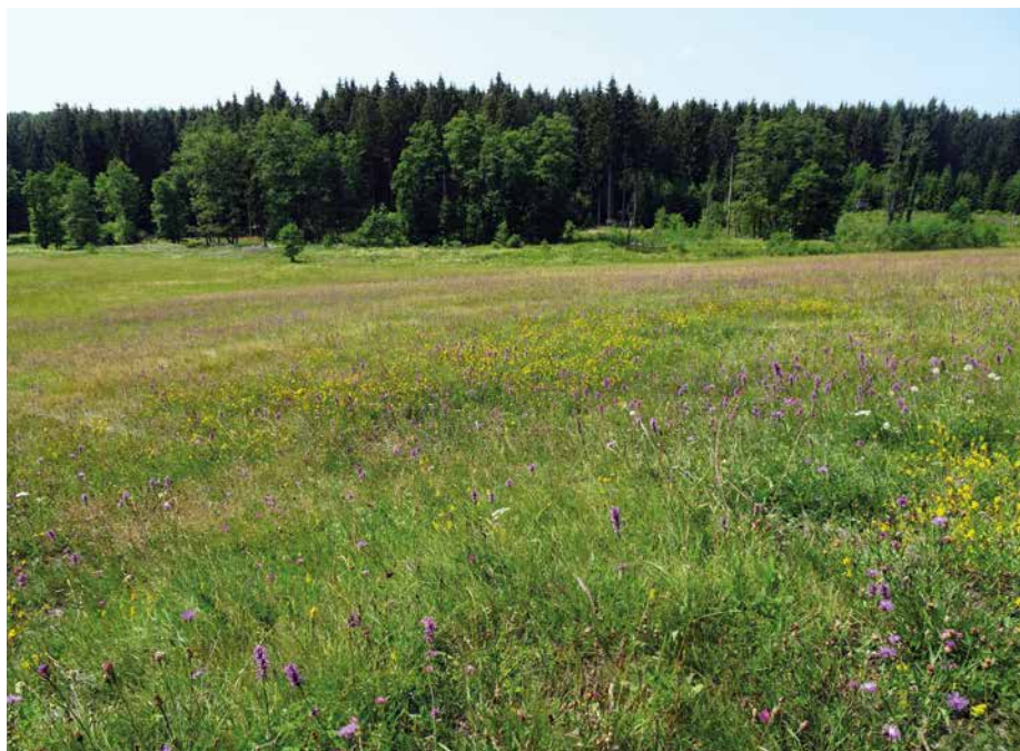
Abb. 3: Borstgrasrasen (LRT 6230) im NSG und FFH-Gebiet 5723-301 Raterod von Neuengronau

te Grünland-LRT wie Flachlandmähwiesen (LRT 6510), Bergmähwiesen (LRT 6520) und Borstgrasrasen (LRT 6230) mit großen Flächen und zahlreichen Vorkommen in Hessen (Abb. 3).