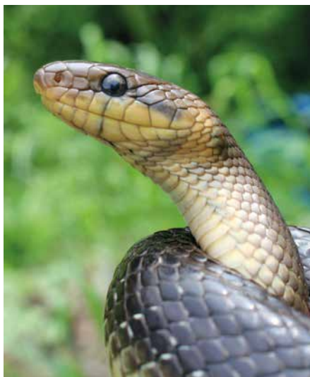
Abb. 1: Der verbesserte Erhaltungszustand der Äskulapnatter ( Zamenis longissimus ) ist das Ergebnis zahlreicher, regelmäßiger Pflegemaßnahmen.

Einen Überblick über die tatsächlichen Veränderungen gibt Tabelle 2. Eine deutliche Verbesserung ist beim Biber ( Castor fiber ) und bei der Wildkatze ( Felis sylvestris ) zu beobachten. Diese früher durch aktive Bejagung dezimierten und im Falle des Bibers sogar ausgerotteten Arten konnten sich seit dem Bericht 2013 weiter ausbreiten und haben mittlerweile deutlich vergrößerte und langfristig überlebensfähige Bestände entwickelt. Wildkatze und Biber wurden daher mit „günstig“ bewertet, auch wenn sie noch