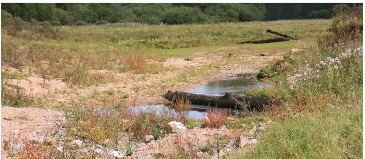
Abb. 5: Die Auenrenaturierung an der Fulda schafft neue Habitate für die Gelbbauchunke ( Bombina variegata ) und andere Pionierarten.

troffen, wenn auch nicht so gravierend wie die Amphibien und mit noch „gelbem“ Erhaltungszustand, allerdings ebenfalls mit Gesamttrend „sich verschlechternd“. Die Ursachen dieser Entwicklung sind im menschlichen Einfluss auf die Landschaft zu suchen. Weitgehend vegetationsfreie Standorte wie Felsen oder Hangrutschungen waren in Hessen schon immer sehr selten. Durch Flussbegradigungen und die Anlage von Staustufen wurden spontane Verlagerungen von Fließgewässern in Hessen weitgehend unterbunden. Eine natürliche Entstehung offener Kiesbänke, natürlicher Uferabbrüche und zunächst vegetations- und auch fischfreier Kleingewässer findet so gut wie nicht mehr statt. Für die hieran gebundenen Arten bedeutet dies einen überwiegenden Verlust ihrer Primärbiotope. Dieser Wegfall konnte lange Zeit durch die Entstehung zahlreicher sekundärer Lebensräume durch das menschliche Wirtschaften ausgeglichen und bezogen auf die gesamte Landesfläche vermutlich sogar übertroffen werden: Eine Vielzahl von Tongruben, sonstigen kleinen Materialentnahmestellen, nicht verfüllten Steinbrüchen, militärischen Übungsplätzen, Lesesteinriegeln, infolge von Übernutzung vegetationsarmen Flächen usw. bildeten lange Zeit gut geeignete und in der Fläche weit verbreitete Ersatzbiotope. Durch die Veränderungen in der Landnutzung entstehen