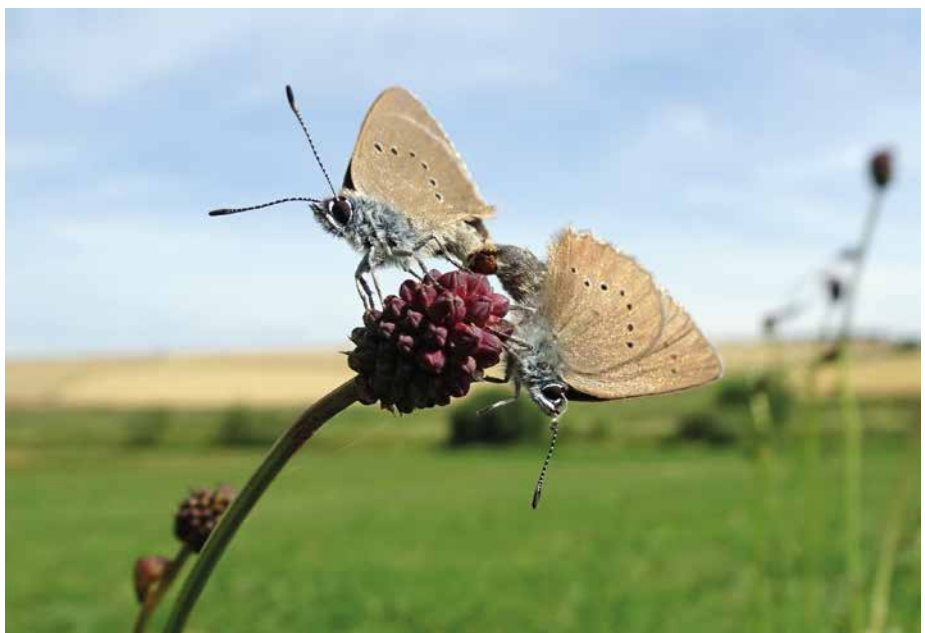
Abb. 7: Wiesen mit Großem Wiesenknopf ( Sanguisorba officinalis ) sind Lebensraum des Dunklen Wiesenknopf-Ameisenbläulings ( Maculinea nausithous ).

te baldmöglichst umgepflügt und wieder eingesät und verlieren dadurch weitgehend ihre frühere Lebensraumfunktion. Die bisherigen Schutzbemühungen zum Erhalt dieser Lebensräume und Habitats werden durch die nach wie vor wirksamen agrarpolitischen und ökonomischen Rahmenbedingungen, die eine Nutzungsintensivierung fördern, in wesentlichen Teilen konterkariert.