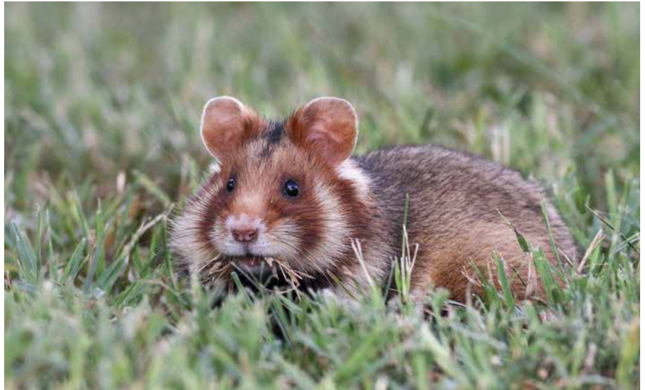
Abb. 8: Der Hamster ( Cricetus cricetus ) könnte durch Pflegemaßnahmen gut gemanagt werden, allerdings gibt es beträchtliche Umsetzungsdefizite.

Weitere Schmetterlingsarten des Offenlandes, z. B. Skabiosen-Scheckenfalter ( Euphy-