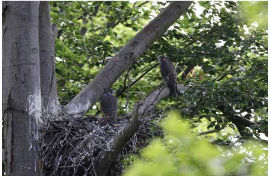
Abb. 7: Eine Besonderheit im Mittelgebirgsland Hessen: auf Bäumen brütende Wanderfalken

Auch der Uhu hat inzwischen gelernt, unter den Brücken von ICE-Strecken auf Nistunterlagen zu brüten, die eigentlich für den Wanderfalken gedacht waren. Im Gegensatz zu den oft bewaldeten Uhu-felsen kann die Großeule dort problemlos beobachtet werden. Auch Brutplätze an anderen Bauwerken besiedelt der Uhu inzwischen erfolgreich (Abb. 5). Hessenweit sind Bruten der Art in alten Greifvogelhorsten heute schon fast die Regel (Abb. 6), auch Bodenbruten werden beobachtet. GELPKE (2019) zufolge kann die Eule mittlerweile praktisch überall auftauchen und brüten. Für das Jahr 2019 gab es in Hessen 258 positive Uhu-Nachweise, wie Revier- und Brutpaare, dabei allerdings auch angefangene bzw. abgebrochene und vom Betreuer nicht weiter verfolgte Bruten. Hinzu kommen ungefähr 225 potentiell mögliche Standorte und auch bisher unentdeckte Reviere. Für das Jahr 2019 können daher bis zu 400 oder sogar 450 Uhu-Reviere in Hessen angenommen werden (GELPKE 2019). In Hinblick auf den Wanderfalken können seit 2014 auch in Hessen Baumbruten beobachtet werden (Abb. 7), was für die weitere Flexibilisierung der Brutplatzwahl auch bei dieser Art spricht.