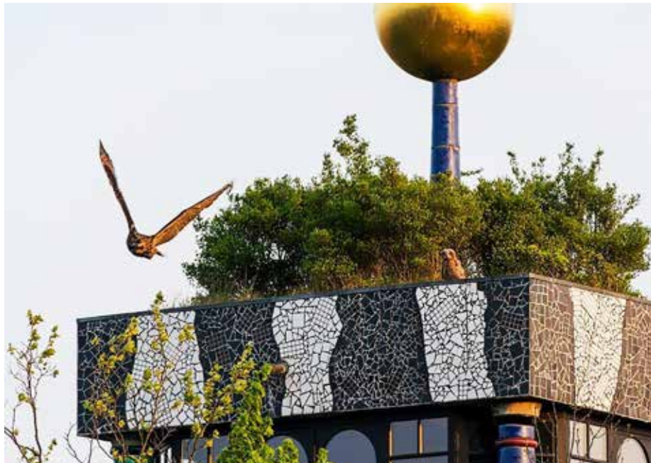
Abb. 5: Uhubrut am Hundertwasserhaus in Kronberg im Taunus

Die unerwartet schnell vollzogenen Bauerksbesetzungen durch den Wanderfalken, bzw. die Verdrängung dorthin, haben etwas mit der Zunahme und der Ausbreitung des Uhus zu tun und nicht zuletzt auch mit dessen Flexibilität. Am Anfang der Neubesiedlungen war die Großeule eher an kleineren, teils auch dichter bewachsenen Felsen zu finden, während der Wanderfalke die steilen, mehr offenen Felswände bevorzugte. In neuerer Zeit sind beide Arten – auch und