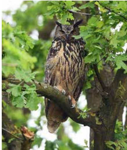
Abb. 1: Uhu ( Bubo bubo)