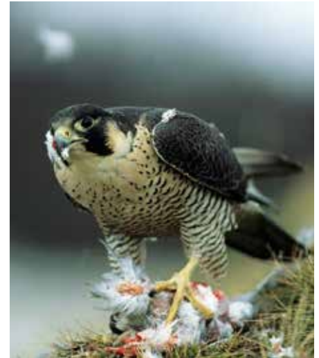
Abb. 2: Wanderfalke ( Falco peregrinus )

Creuzburg (Thüringen) und Bad Sooden-Allendorf (Hessen) belegt, dabei bestehen Nachweise für die thüringischen Felsmassive der Ebenauer Köpfe und des Heldrasteins (GÖRNER 2016) sowie für den hessischen Dreierherrenstein bei Heldra und die Schöne Aussicht bei Bad Sooden-Allendorf (BRAUNEIS 1984).