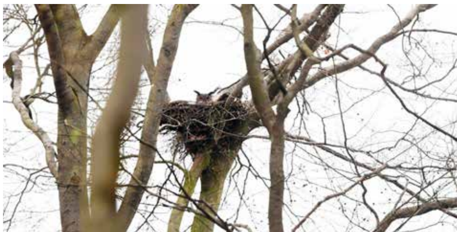
Abb. 6: Junge Uhus in einem nachgenutzten Habichthorst

schriff und besonders hoch sind. Beispielhaft seien die nordhessischen Kalkfelsen und Steinbrüche genannt, wo solche Situationen jährlich festzustellen sind. Die Wanderfalken harren aus, obwohl die neue Habitatbesetzung durch den Uhu bereits feststeht. Dass die Wanderfalken das ganze Terrain, wenigstens am Tage, oft lautstark rufend und warnend ständig befiegen sowie Jagdbeute herbeitragen, empfindet der in der Nähe nistende Uhu nicht als Störung. Wobei auch Altfalken durchaus in die Gefahr geraten, selbst zur Uhu-Beute zu werden. Es kam auch sogar schon vor, dass ein bei Tageslicht in eine Felschlucht einfliegender Roter Milan von einem Uhu geschlagen wurde (Mitt.