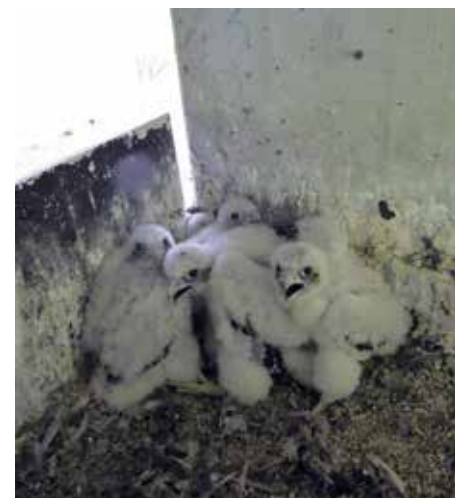
Abb. 4: Wanderfalkenbrutplatz unter der Brücke einer ICE-Strecke

Um das Phänomen der Bauwerkbruten beim Wanderfalken nachzuvollziehen, bedarf es wieder eines Blicks in die Ver-